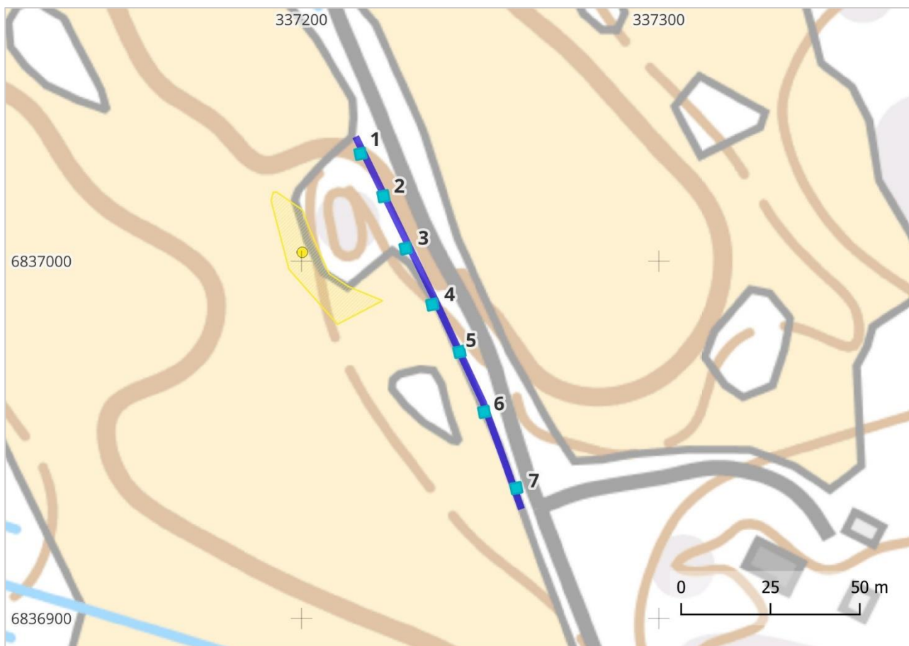
Kartta 7. Tarkkuusinventoitava linja on esitetty sinisellä ja koekuopat (1-7) turkoosilla. MK 1: 1000.