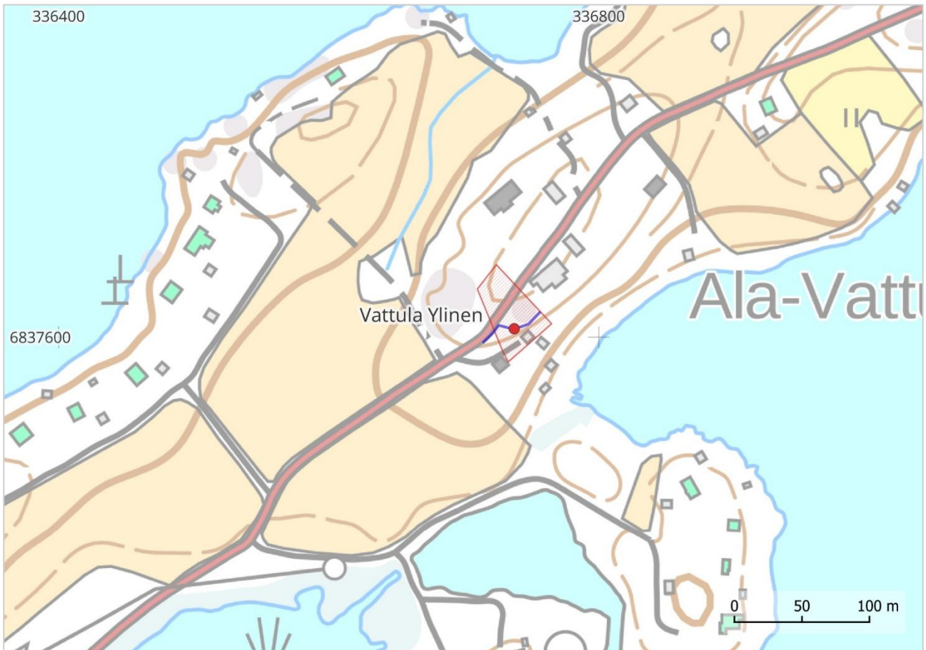
Kartta 2. Kiinteä muinaisjäännös Vattula Ylinen sijaitsee Vattulantien varrella. Tarkkuusinventoitava linja (sininen viiva) kulkee sen halki. MK 1: 4000.