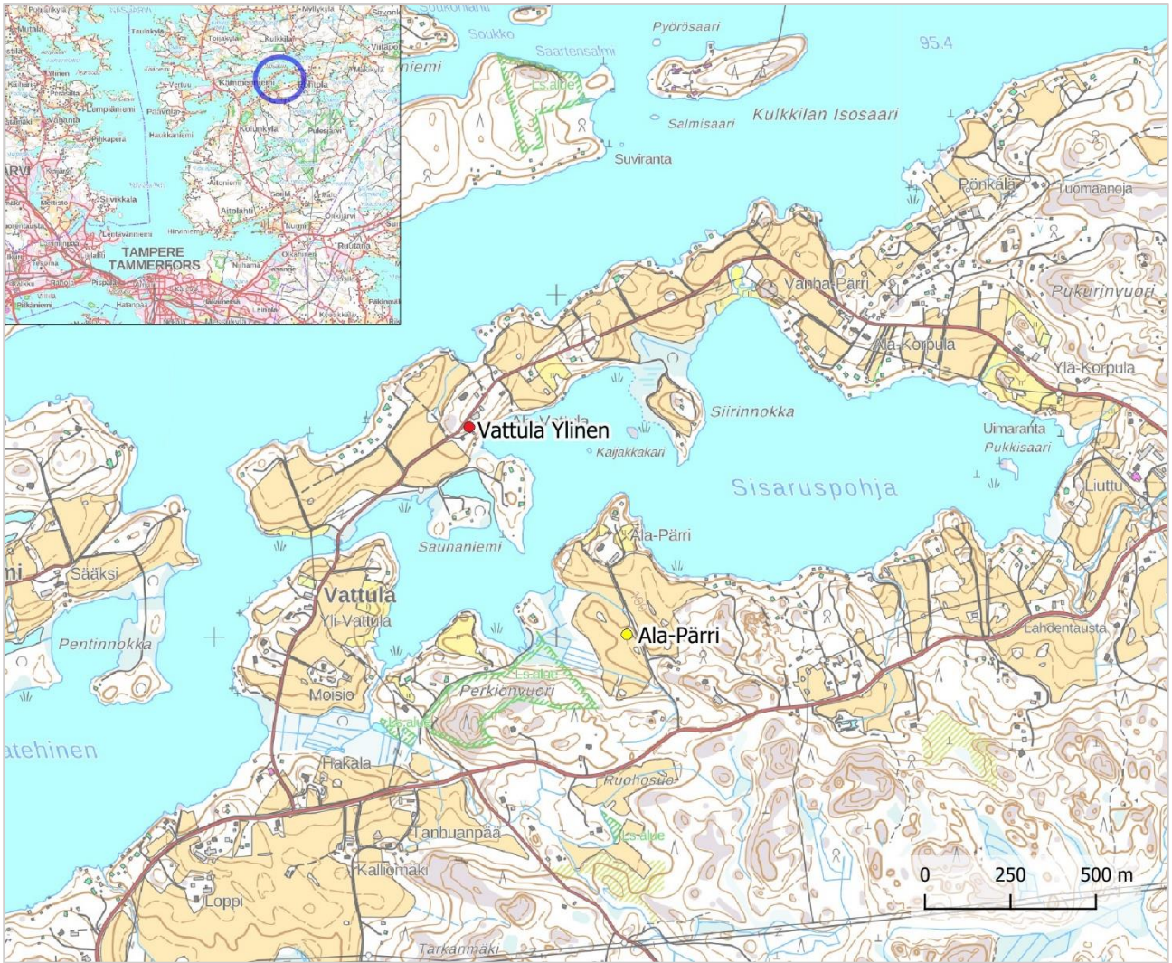
Kartta 1. Lähestymiskartta. Vattula Ylisen ja Ala-Pärrin sijainnit Sisaruspohjan alueella. MK 1: 20 000.