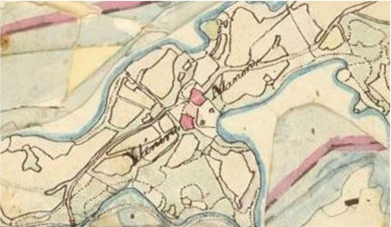
Kartta 5. Sama alue vuoden 1850 pitäjänkartalla.