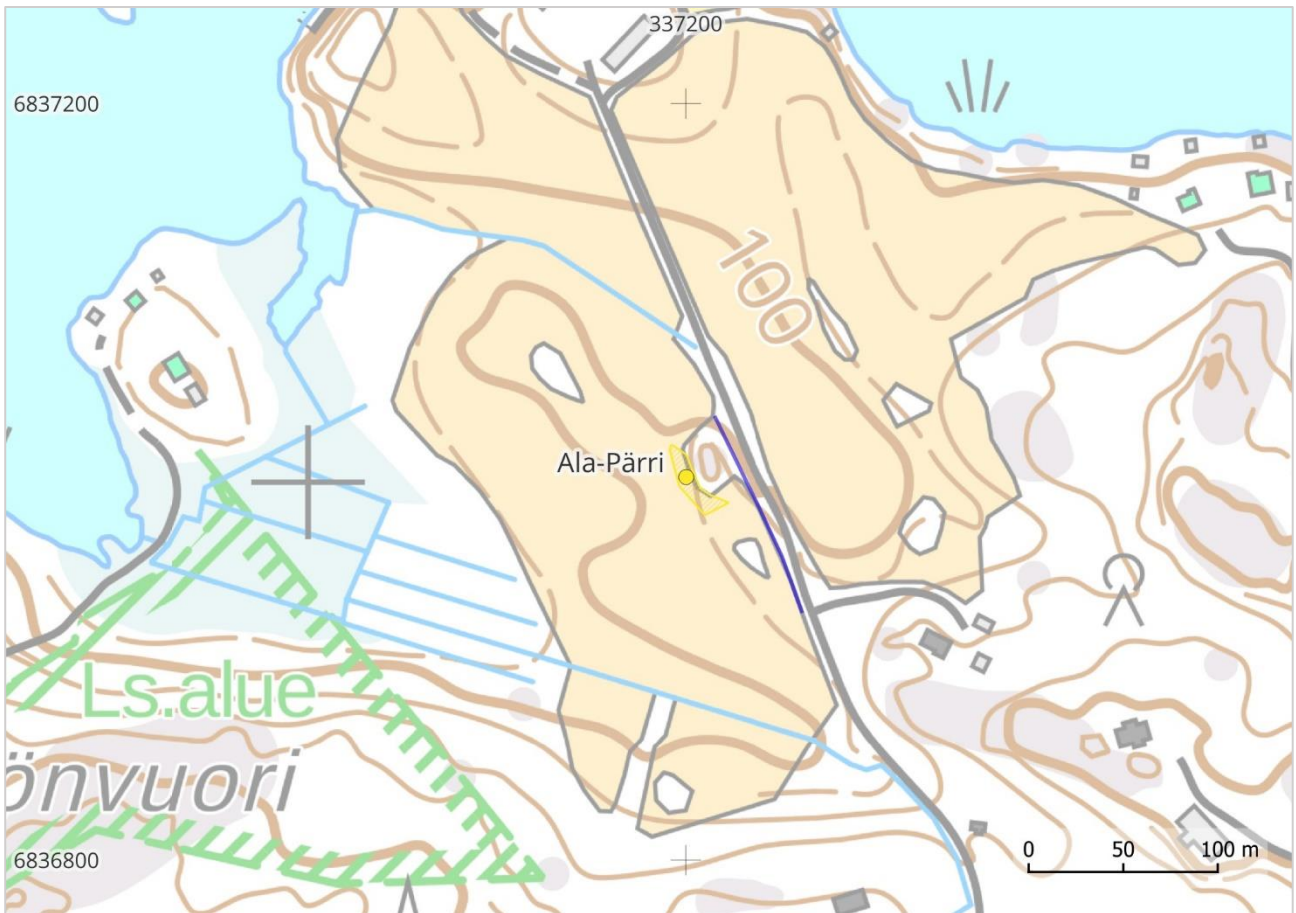
Kartta 3. Ala-Pärin löytöpaikka sijaitsee pellolla, pienen metsäsaarekkeen länsipuolella. Tarkkuusinventoitava linja kulkee sen itäpuolella (sininen viiva). MK 1: 4000.