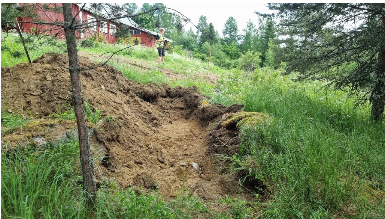
Kuva 3. Koekuoppa 5 kaivettiin muinaisjäännösalueen itäreunalle, johon maakaapeli oli jo tuotu odottamaan koekaivausta. Kuvattu koilliseen.