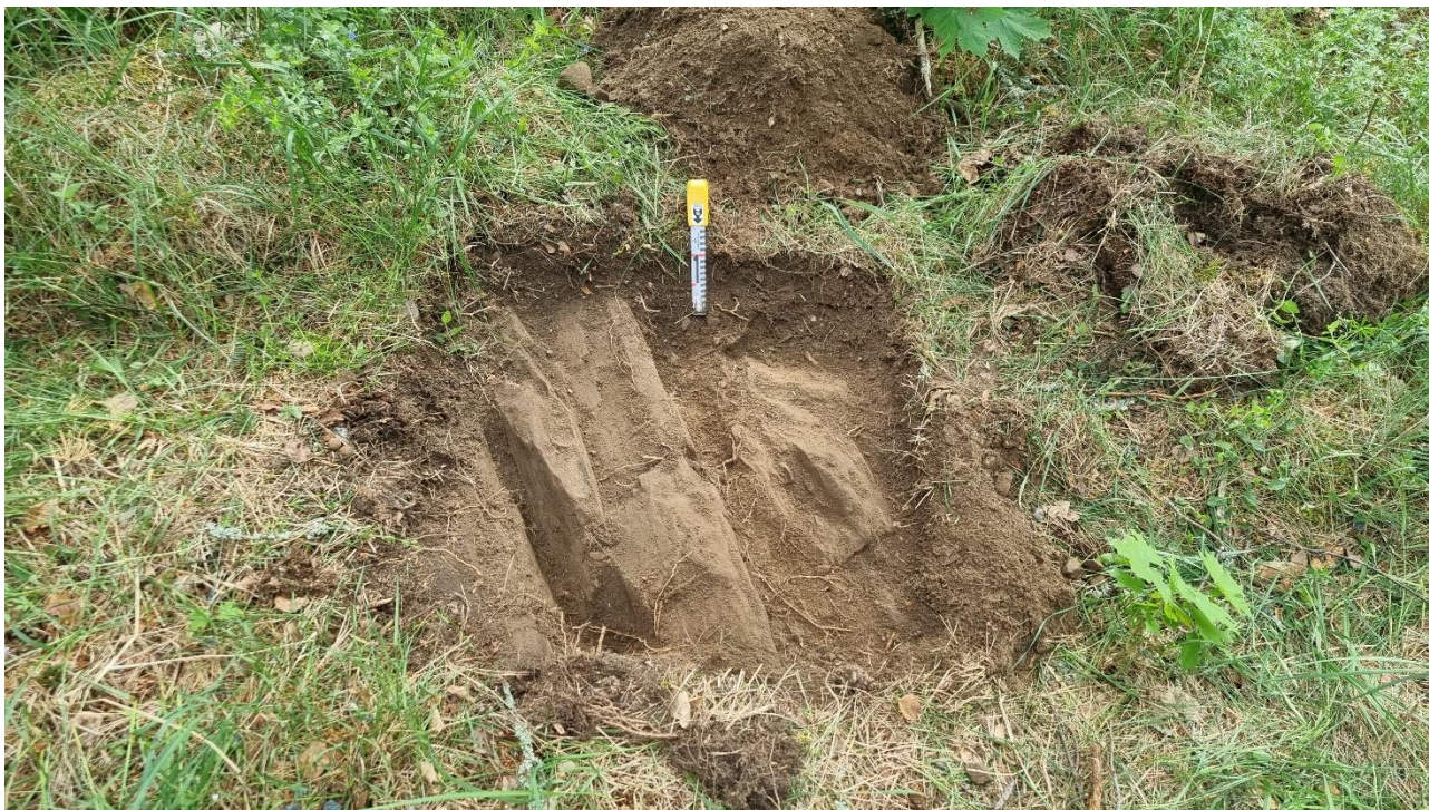
Kuva 2. Koekuoppa 3. Peruskallio tuli vastaan heti pintamullan alta.