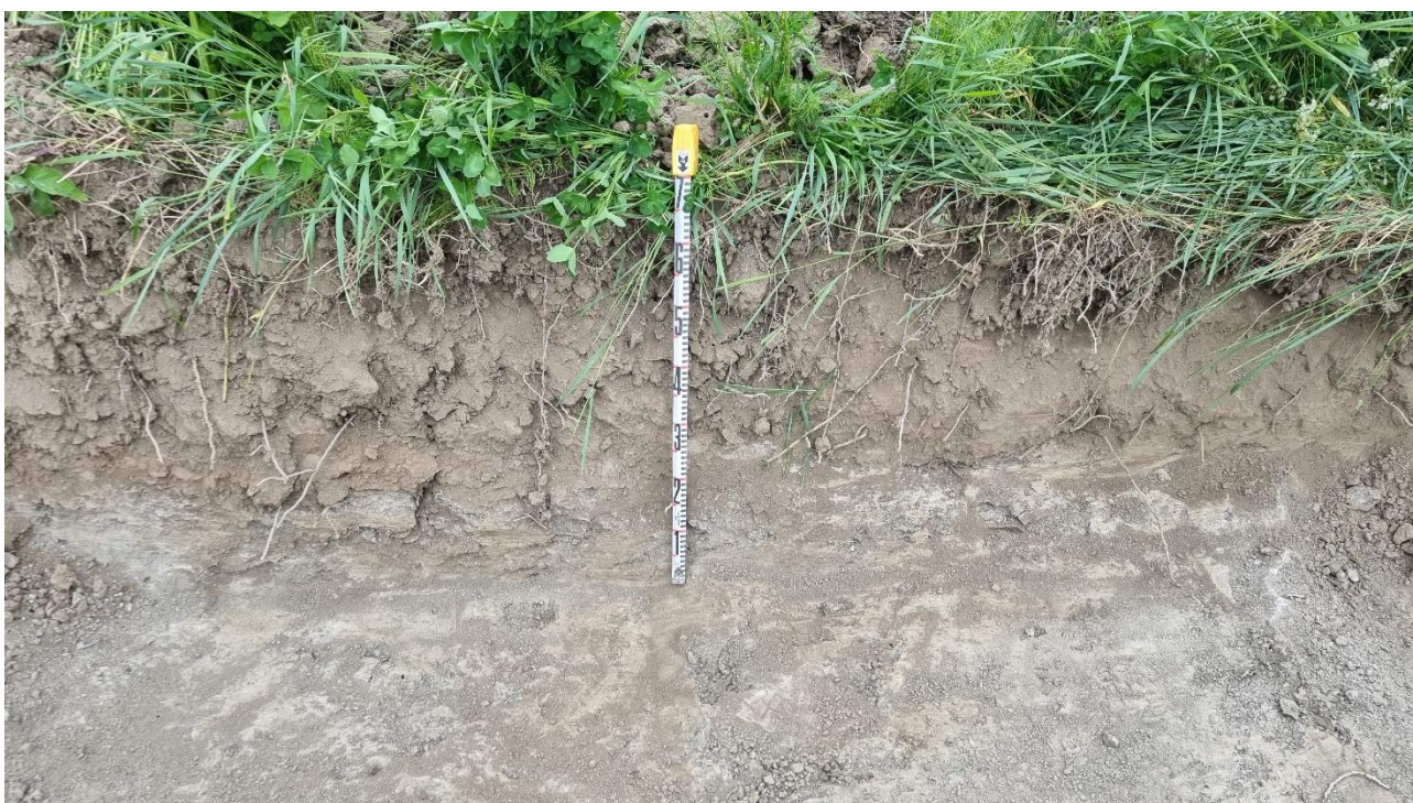
Kuva 4. Kaikissa Ala-Pärin löytöpaikan lähelle tehdyissä koekuopissa maaperä oli sekoittuneen kyntökerroksen alla savista hiesua.