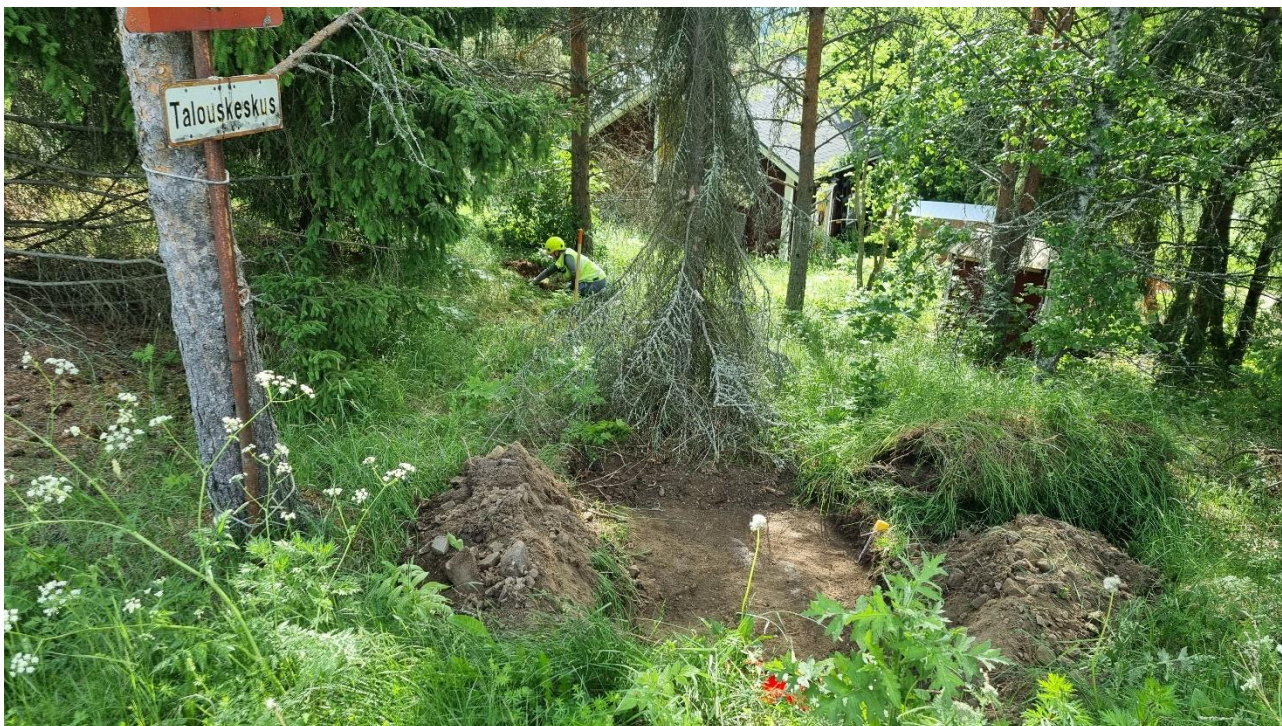
Kuva 1. Etualalla Vattulantien viereen kaivettu koekuoppa 2. Taustalla ML kaivaa koekuoppaa 3. Kuvattu itään.