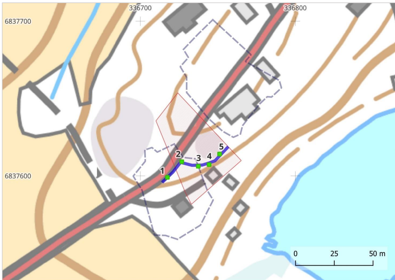
Kartta 6. Vattula Ylisen alueelle koekaivettu kaapelilinja on merkitty sinisellä ja koekuopat (1-5) vihreällä. Isojakokartassa näkyneet tonttimaat on rajattu harmaalla katkoviivalla. MK 1: 1000.