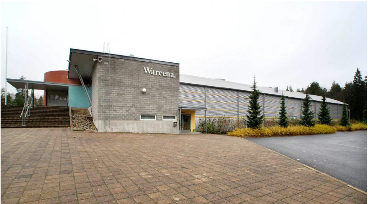
Kuva 6: Jäähalli Wareenasta

Rakennuksen on suunnitellut arkkitehtikonttori Petri Pussinen Oy / Petri Pussinen. Tämä 4425 kerrosneliön jäähalli on rakennettu vuonna 1998. Jäähallin julkisivu on harmaata muovipinnoitettua vaakapeltiä keltaisin tehostein. Sisäänkäynnin yhteydessä on puna- ja harmaatilliset osuudet sekä tehosteena turkoosinsinistä seinää. Päämassan katto on kaarimainen, pääsisäänkäynnin yhteydessä olevat rakennusosat ovat tasakattoisia. Hallin kaariteemaa säestää sisäänkäynnin lieriömäinen rakennusosa.