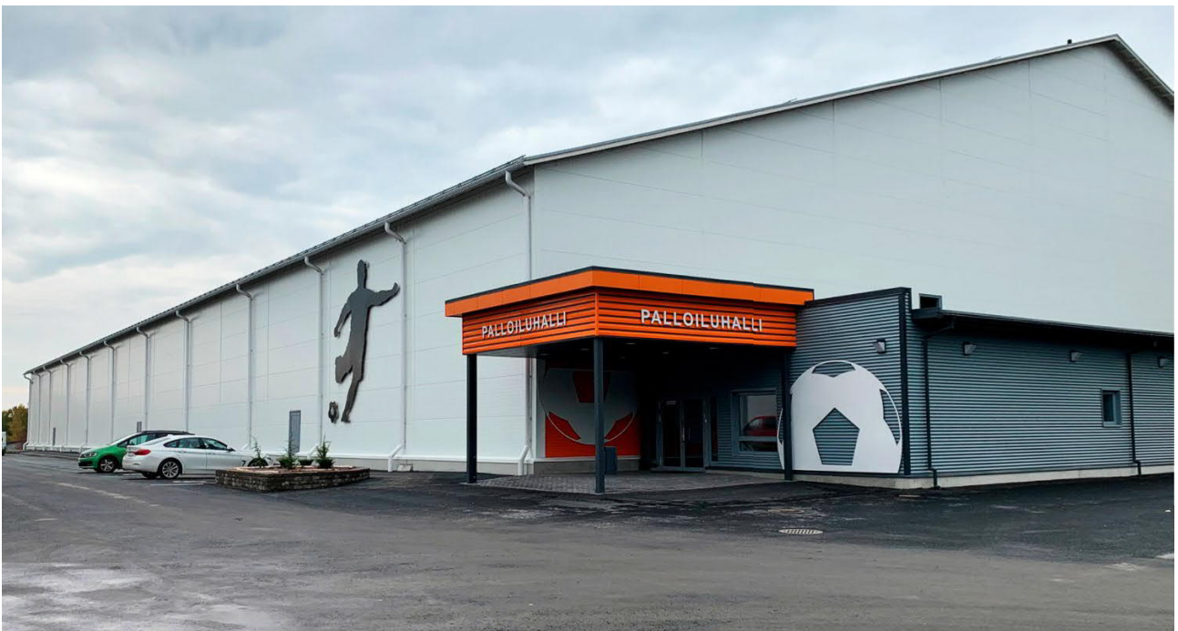
Kuva 2: Valkeakosken palloiluhalli

Suunnittelutalo PPG Oy / Heli Palvelan suunnittelema 6670 kerrosneliön palloiluhalli on rakennettu vuonna 2020. Harjakattoisessa rakennuksessa on puolilämmin jalkapallon harjoitushalli sekä siihen liittyviä sosiaalitylöitä. Hallin elementtiseinät ovat valkoiset/vaalean harmaat, ovet ja ikkunat ovat harmaat. Sisäänkäynnissä on tehosteväriä oranssia. Hallin sivu- ja päätyseinissä on isokokoiset jalkapalloilijaa kuvaavat logot.