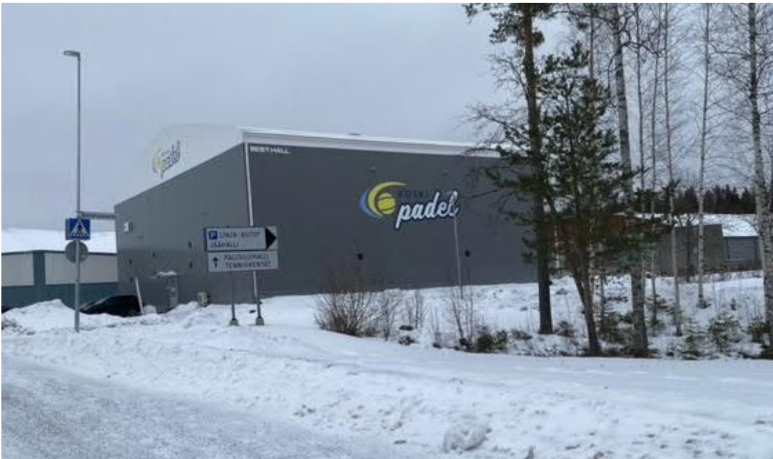
Kuva 5: Padel-Halli

Best-Hall Oy / Jukka Löytynojan suunnittelema 608 kerrosneliön kevytrakenteinen satulakattoinen Padel-halli on rakennettu vuonna 2021. Rakennus on teräsrunkoinen ja ulkoseinät ovat harmaata PVC-pinnoitettua polyesterikangasta. Seinässä iso Koski-Padel logo.