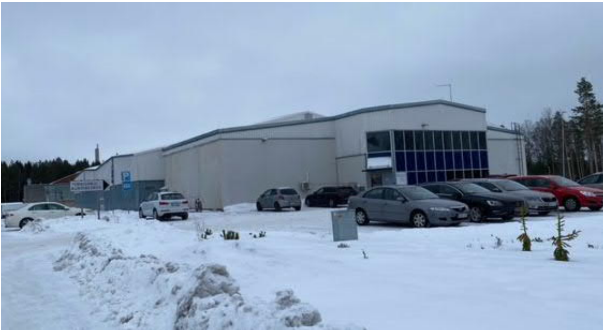
Kuva 4: Liikunta-/tennishalli

Rakennuksen on suunnitellut Insinööritoimisto Tilatek ja se on valmistunut vuonna 1988. Laajennusosan suunnitteli Arkkitehtitoimisto Jouni Salokannel ja se valmistui vuonna 1989. Rakennuksen julkisivu on pääosin vaaleaa elementtirakenteista peltilevyä. Katto on erittäin loiva satulakatto.