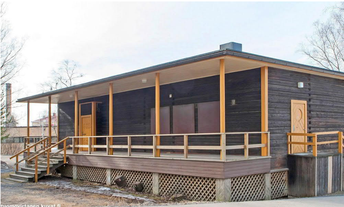
Kuva 3: Kerhomajan rakennus

Voimassa olevan asemakaavan mukaan rakennusta ei saa purkaa, eikä siinä saa suorittaa sellaisia korjaus- tai muutostöitä, jotka turmelevat rakennuksen rakennustaiteellista tai paikallishistoriallista arvoa. Rakennuksen siirtäminen sille paremmin soveltuvaan paikkaan sallitaan.