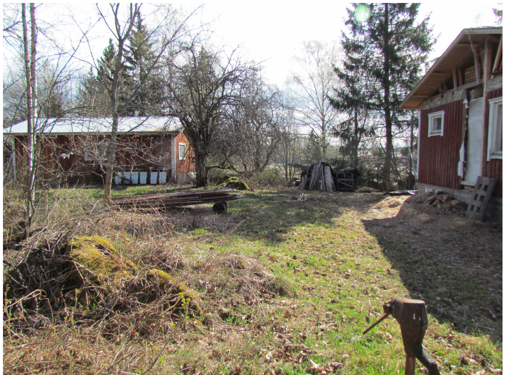
Kuva 3. Kikkerlänmäki Selvenin kalmisto sijaitsee punaiseksi maalattun asuinrakennuksen pihapiirissä (kuvassa oikealla). Kolmen keihäänkärjen löytöpaikka sijaitsee kuvassa näkyvän ulkorakennuksen