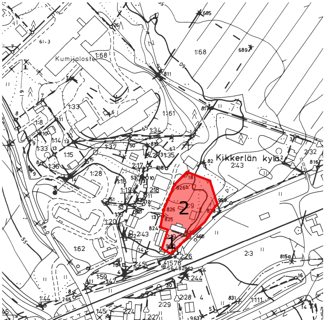
Kartta 3. Kaavakarttaan on merkitty kalmiston ja muinaisjännöksen Kikkelänmäki Selven sijainti suoja-alueineen. Numerolla 1 on kuvattu kalmiston nykyinen sijainti ja numerolla 2 alue, jolla kalmisto todennäköisesti sijaitsee. Inventoinnin perusteella muinaisjännös on syytä rajata alueen 1 pohjoispuoliselle alueelle.