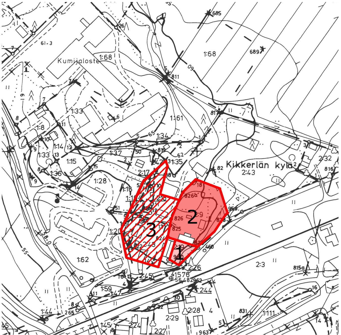
Kartta 2. Kartta inventointikohteista ja muinaisjäännöksistä. karttaan on merkitty vaaleanpunaisella värillä ja numerolla 1 tunnetun muinaisjäännöksen Kikkelänmäki Selven (mj. rek. tunnus 988010019) nykyinen raja. Numerolla 2 on kuvattu maasto- ja arkistotietojen perusteella kalmiston todennäköinen laajuus. Numerolla 3 on kuvattu kylätontin laajuus.