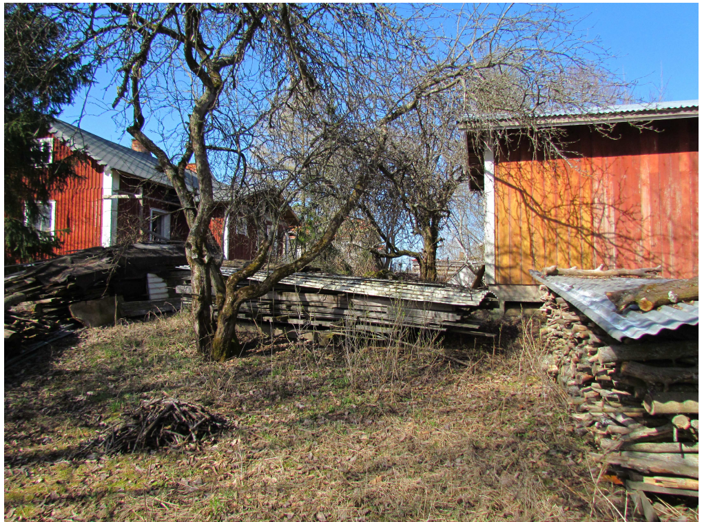
Kuva 2. Kikkerlänmäki Selvenin kalmisto sijaitsee punaiseksi maalattun rakennuksen pihapiirissä. Kolmen keihäänkärjen löytöpaikka sijaitsee kuvassa näkyvän omenapuun takana ulkorakennuksen kaakkoisnurkasta noin viiden metrin etäisyydellä. Taustalla vasemmalla näkyvää asuinrakennusta remontoidaan. Kuvattu idästä 29.4.2011.