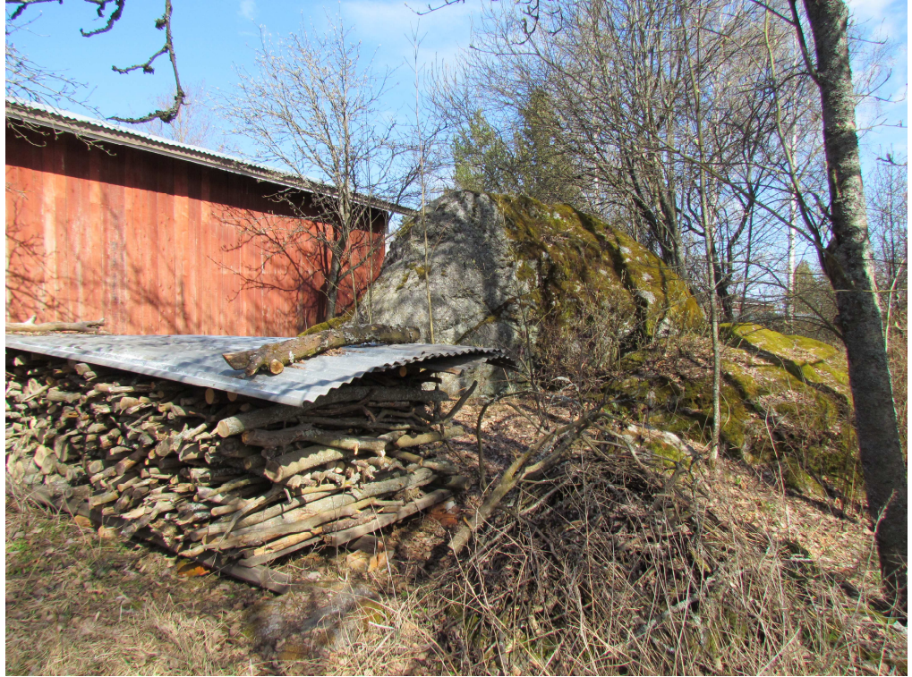
Kuva 4. Suuri maakivi sijaitsee tontin itäosassa ulkorakennuksen takana.

(taustalla vasemmalla) kaakkoisnurkasta noin viiden metrin etäisyydellä. Etuvasemmalla näkyy ajoittamaton kiviraunio, joita tontilla on useita.