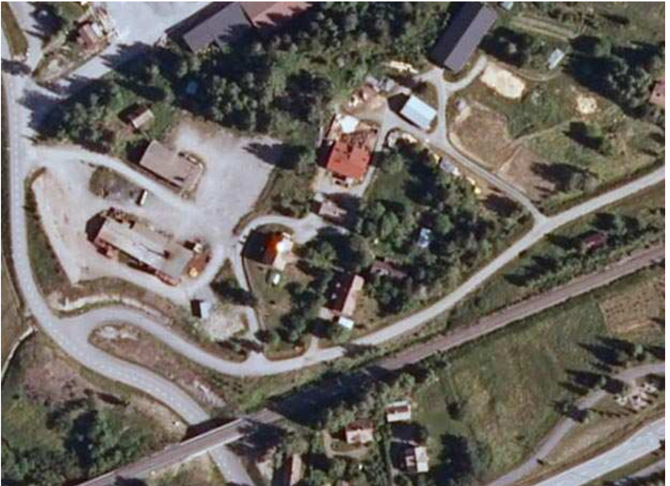
Kuva 1. Ilmakuva tutkimusalueesta.

Asuinrakennuksen lisäksi alueella on useita hylättyjä ja asumattomia rakennuksia. Alueen hylätyt rakennukset ovat huonossa kunnossa.