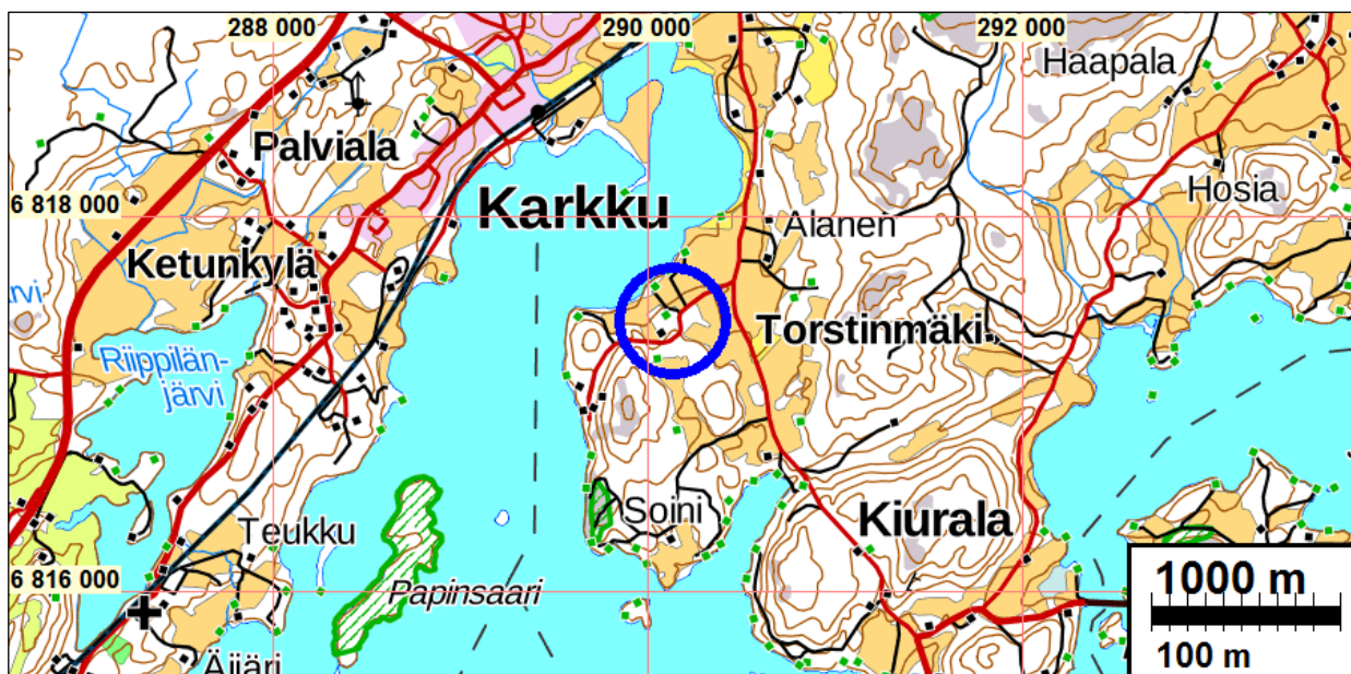
Valvonnassa kaivettava alue sinisen ympyrän sisällä.

Tulos: Arkeologin valvonnassa kaivetulla vesihuoltolinjaosuudella ei todettu mitään viitteitä kiinteästä muinaisjäännöksestä.