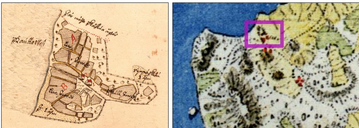
Vasen. Ote maakirjakartasta vuodelta 1644. Oikea. Ote Kuninkaan kartastosta (1776–1805), kylätontin kohta violetin rajauksen sisällä, talot korostettu punaisella kartan päälle.