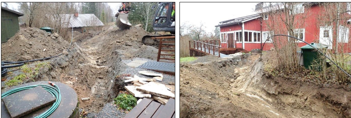
Vasen. Vesihuoltokaivanto mäen laella piha-alueella. Etualalla porakaivo, sen vieressä salaojaputkia, viemäriputkia, asennushiekkaa ja styroksilevyä. Itäkaakkoon. Oikea. Vesihuoltolinja pihatiellä ja piha-alueella kaivettuna peruskallioon saakka. Tumma kerros oikealla kaivannon seinämässä on humusta, käytännössä puutarhamultaa. Länsilounaaseen.