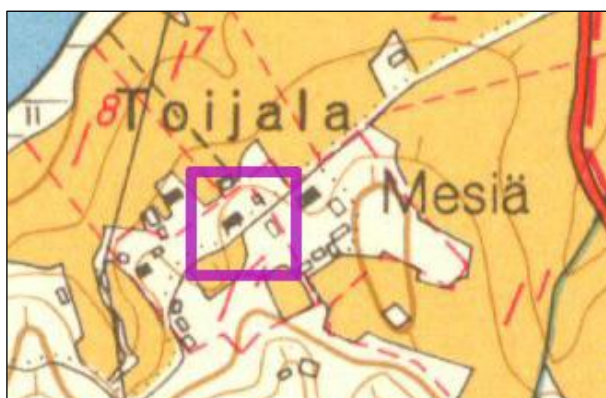
Kylätontti violetin rajauksen sisällä vuoden 1961 kartalla.