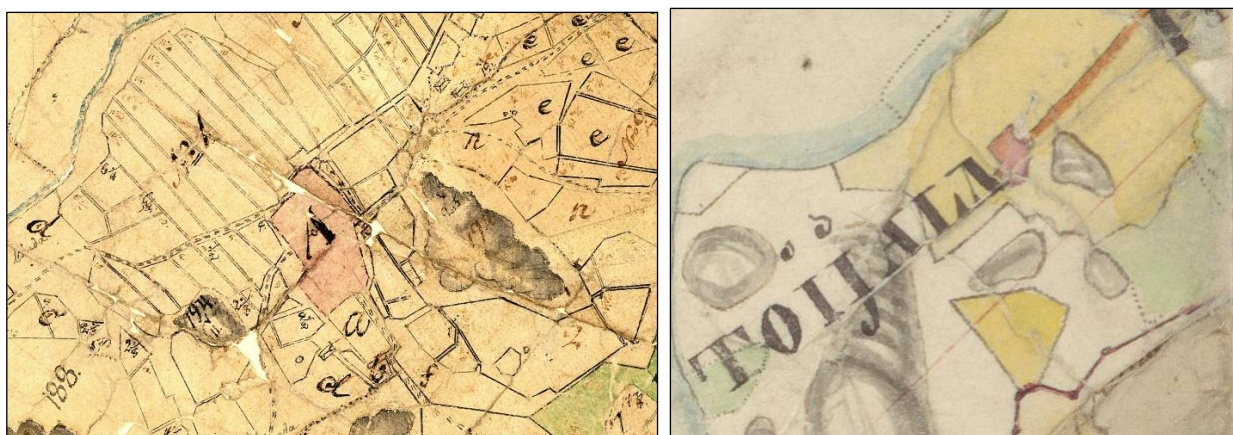
Vasen. Kylätontti vuoden 1777 kartalla. Oikea. Kylätontti punaisella vuoden 1842 pitäjänkartalla.