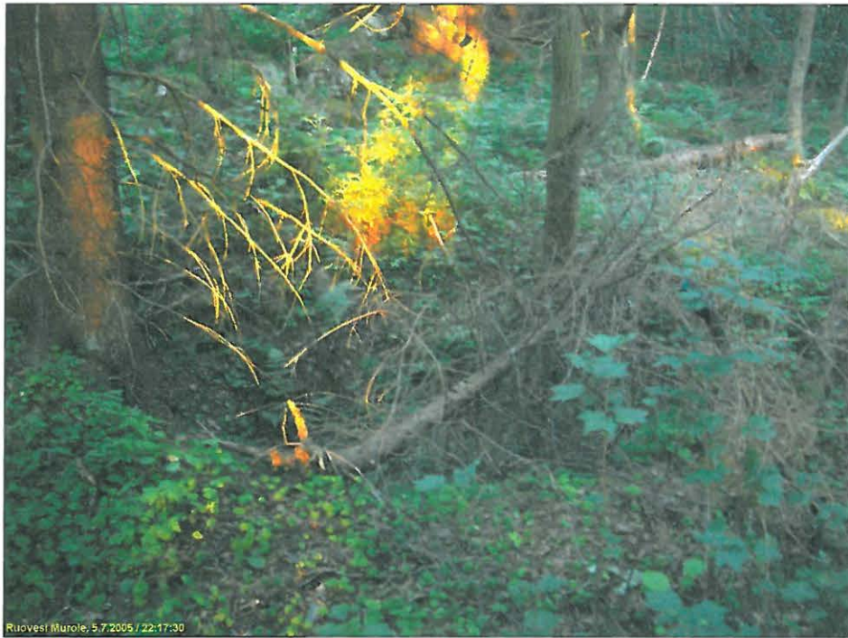
Maakellarin jäänteet. Alla oviaukon kohta, kuvattu itään.