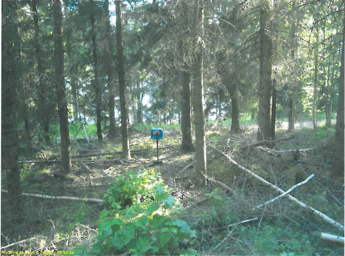
Asuinpaikan maastoa kuvattuna etelään.