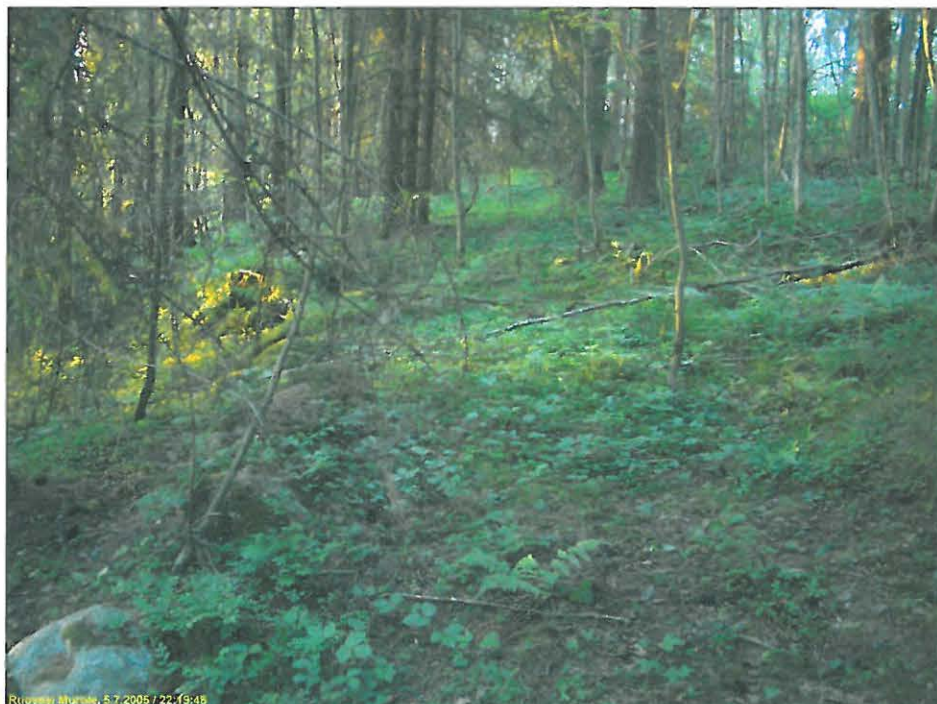
Vanha tieura rinteessä kuvattu pohjoiseen.