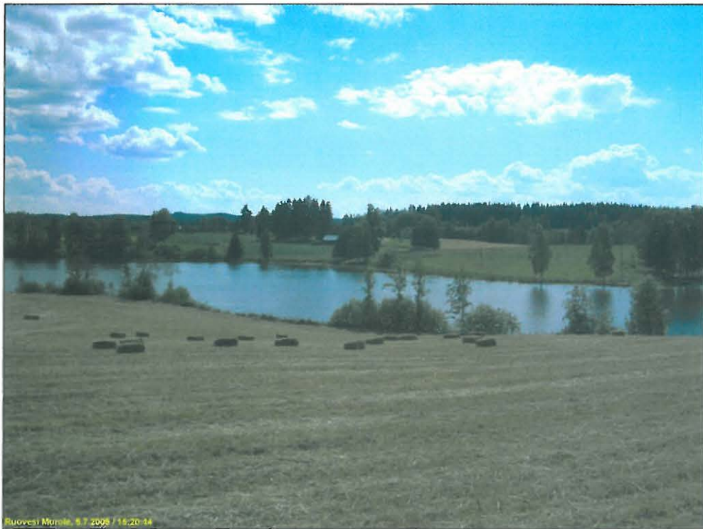
Ruovesi Murole, 6.7.2005 / 15:20-14