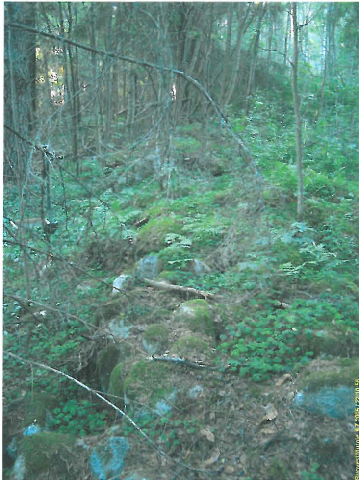
Kiviaidan eteläpäättä kuvattuna pohjoiseen.