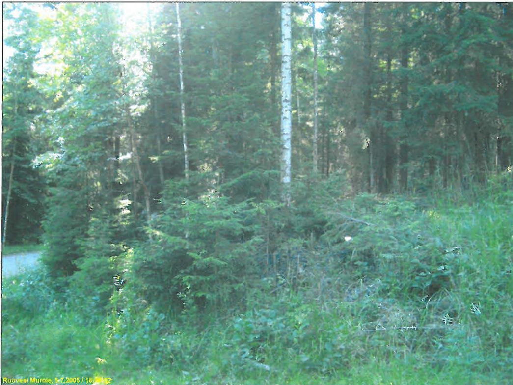
Kuvattu "laaksosta" länteen, asuinpaikka ylätasanteella metsässä.