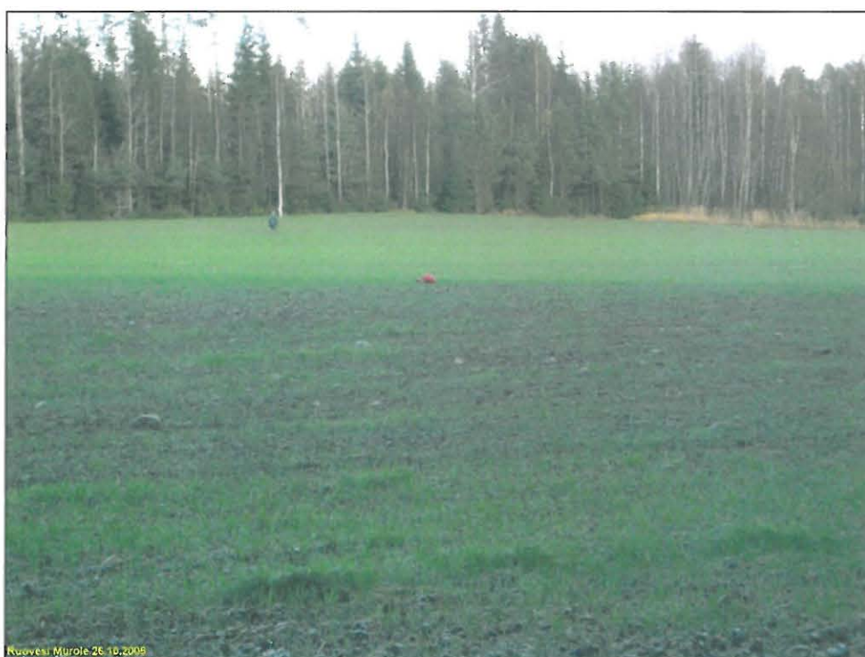
Asuinpaikan maastoa kuvan etualalla, kuvattu itään kohti Murronvainio 2 asuinpaikkaa.