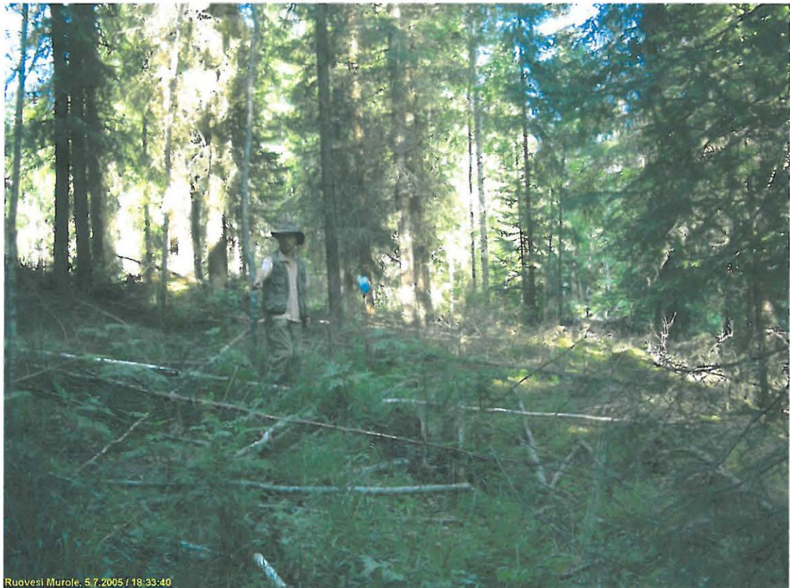
Asuinpaikan maastoa kuvattuna itään.