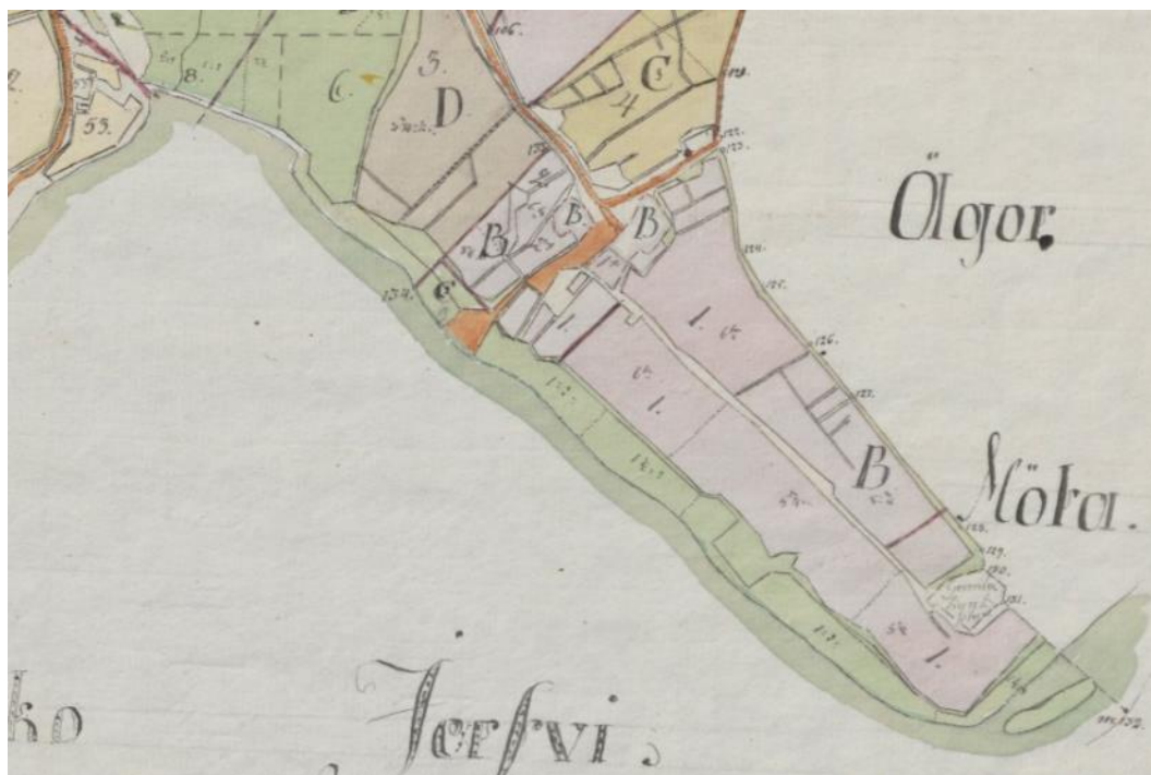
Kartta 2. Ote Tuokkolan isojakokartasta vuodelta 1811. Karttaan on merkitty vanhan kirkon paikka.

Hämeenkyrön siunauskappeli on valmistunut vuonna 1895 ja se on kirkkolailla suojeltu kirkollinen rakennus. Hautakappelin alle rakennettiin ruumiskellari vuonna 1925. Vanha siunauskappeli on todennäköisesti Pirkanmaan vanhin, alun perin siunauskappeliksi rakennettu ja vihitty rakennus, joka on edelleen toiminnassa. Kappeli sisältyy valtakunnallisesti merkittävään rakennettuun kulttuuriympäristöön "Hämeenkyrön vanha keskusta". Hautausmaan alueella on sijainnut aikaisemmin puurakenteisia kirkkoja, jotka ovat tuhoutuneet tai purettu seuraavan kirkon tieltä. Viimeisin kirkko purettiin vuonna 1824. Hämeenkyrön nykyinen kirkko valmistui vuonna 1782 rakennusmestari Abraham Tennbergin johdolla. Kirkon paikaksi vallittiin pappilasta lohkaistu alue pappilan luoteispuolella. Kirkkoa ympäröivä hautausmaa perustettiin 1870-luvulla. Vanhaa hautausmaata on laajennettu useaan otteeseen, viimeksi 1956. Vanhempien kirkkojen mahdollisesti säilyneet osat ovat automaattisesti muinaismuistolain (295/1963) rauhoittamia. Tästä syystä korjaustyöhön liittyvät kaivutyöt tehtiin arkeologin valvonnassa. Arkeologinen valvonta suoritettiin 9.10.2017 ja siitä vastasi arkeologi Kalle Luoto. Arkeologisen valvonnan yhteydessä ei havaittu muinaisjäännöksenä pidettäviä rakenteita.