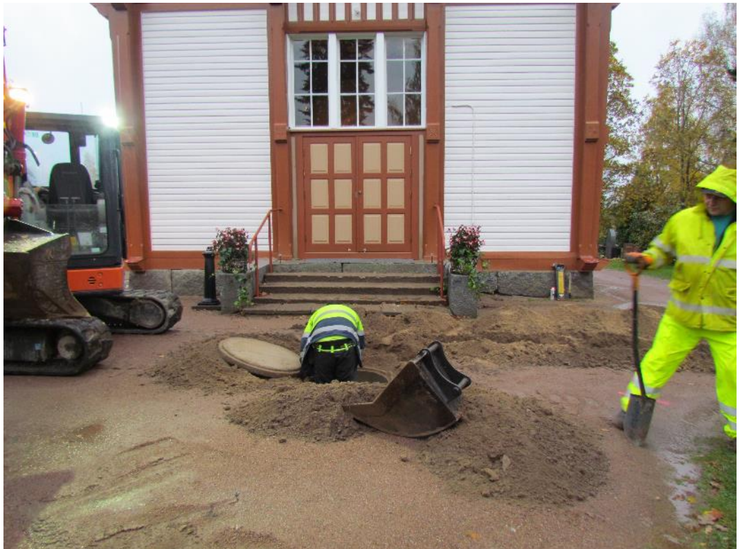
Kuva 3. Sähkökaivo kappelin sisäänkäynnin edessä.