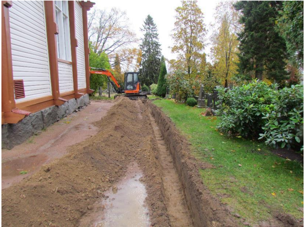
Kuva 2. Kaapeliurien kaivaminen tapahtui pienellä kaivinkoneella.