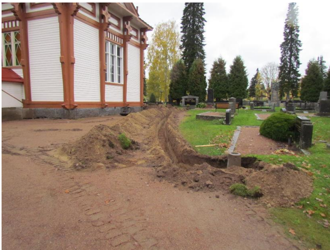
Kuva 1. kaivannossa havaittiin ainoastaan rakennustöiden yhteydessä paikalle tuotua hiekka.

Valvotun kaivannon syvyys oli noin puoli metriä. Valvonnan tuloksena havaittiin, että kappelia ympäröi täyttöhiekka, jossa ei havaittu jätteitä 1900-lukua vanhemmista kerrostumista. Kappelin ympäristöön oli aiemmin kaivettu mm. viemärikaivantoja, joiden kaivamisen yhteydessä maaperään oli kajottu. Ilmeisesti myös vuonna 1925 tapahtuneen kellarin kaivamisen yhteydessä on kappelia ympäröiviä maakerroksia muokattu.