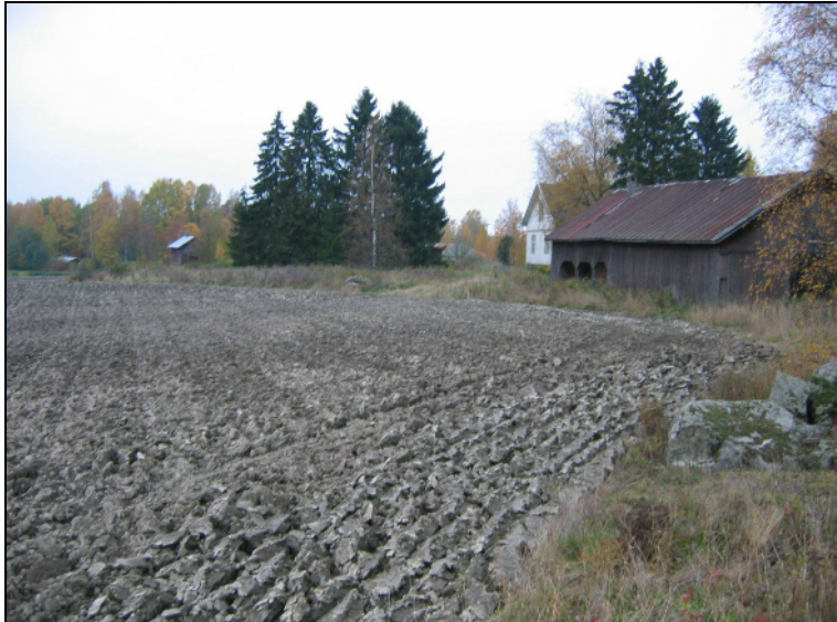
Tien pohjoispuolisen kylätontin länsipuolista peltoa. Kylätontti ulottunut oik. ladon tasalle. pellos- ta merkkejä kivikautisesta asuinpaikasta v. 2004.