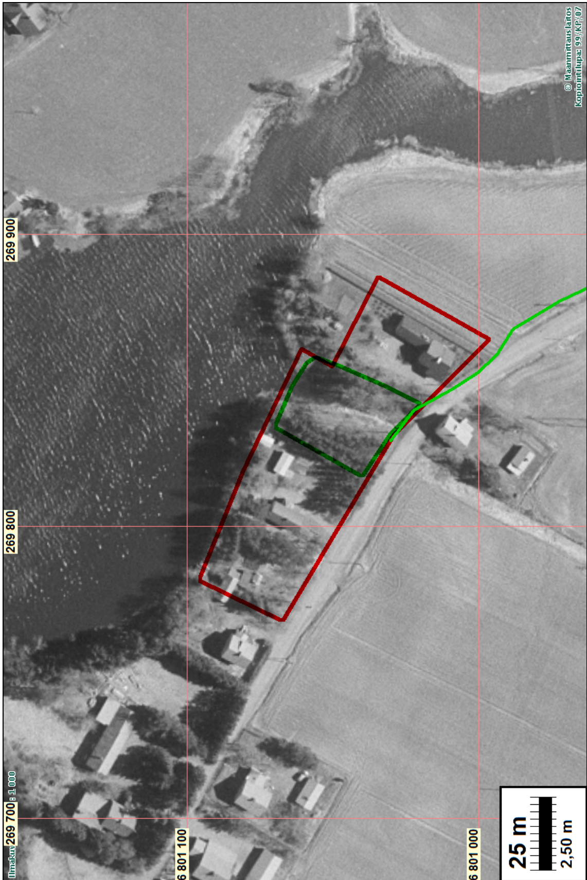
Ojanperä. Kylätonttirajaus ( \pm 5 m) punaisella. Muinaisjännösosa vihreällä. vesihuoltolinja vaalean vihreä viiva.