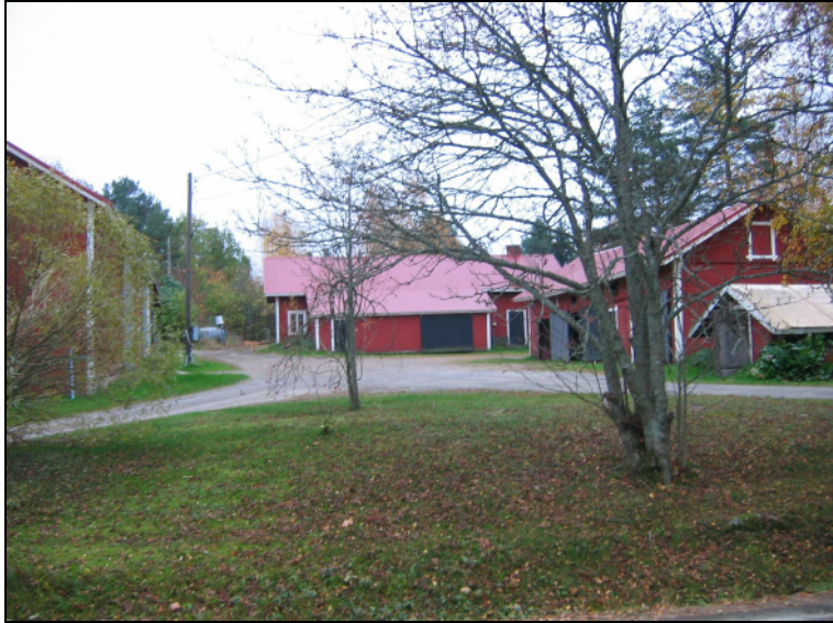
Tien eteläpuoleinen, 1646 jälkeen asutettu tontin osa.