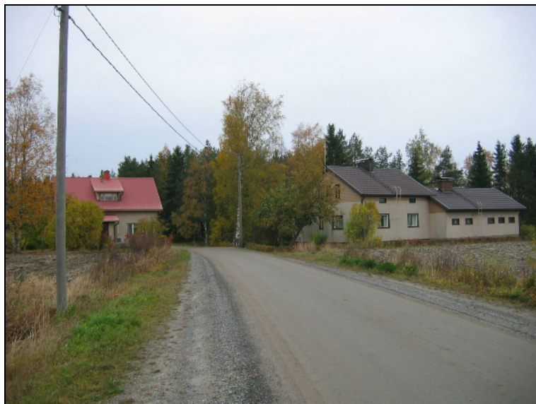
Tontin itä-kaakkoispäätä oik. talon kohdalla. Luoteeseen.

Vesihuoltolinja tontin itäpäässä kulkee tien vierustaa ja hyvin muokatun pihan reunaa eikä kulje muinaisjäännöskelpoisella alalla. Hieman lännempänä linja kaartuu aivan muinaisjäännökseksi merkatun kylätontin osan reunalle, edelleen aivan tien varressa, kohdalla missä oja ja siitä kaivettua maata. Mielestäni ei aiheuta vahinkoa alustavasti muinaisjäännökseksi merkatulle kylätontin osalle näiltä osin.