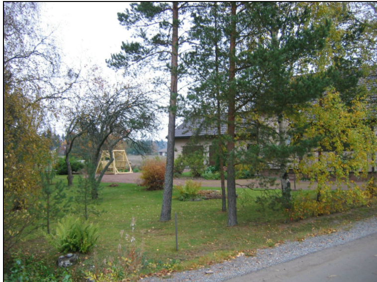
Kylätontin itä-kaakkoispäätä itään. Muinaisjäännös katsottu alkavaksi heti kuvan vasemmalta puolelta - kuvan pihamaa ei muinaisjäännöstä.