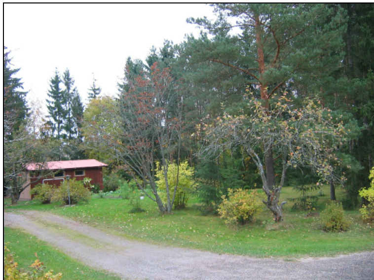
Kylätontin keskiosaa. Muinaisjäännökseksi katsottava tyhjä tontti oik. metsikössä.