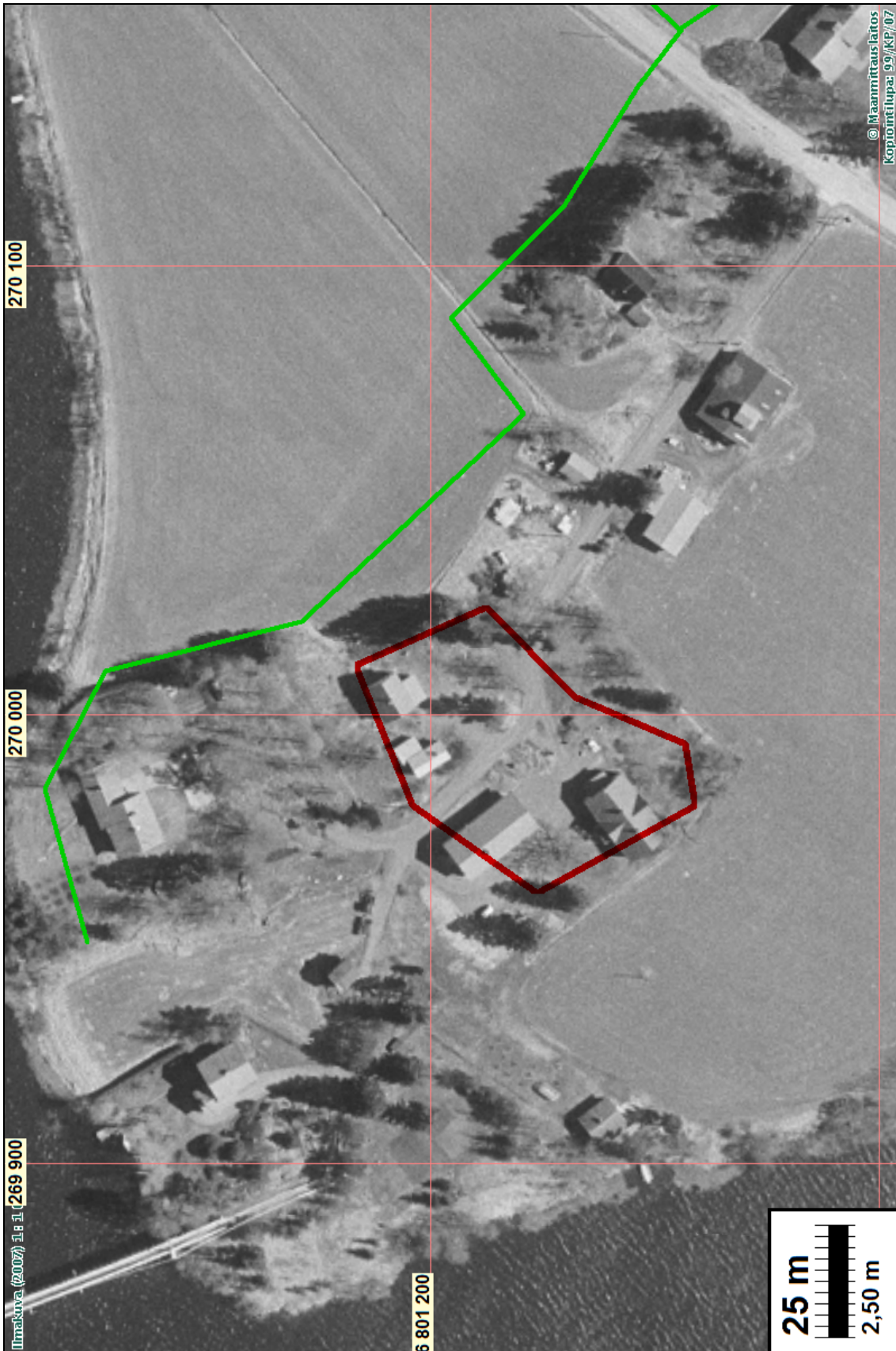
Peevo. Kylätonttirajaus punaisella. Vesihuoltolinja vihreällä