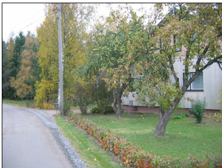
Kylätontin kaakkoisreuna tien varrella omenapuun tasalla.