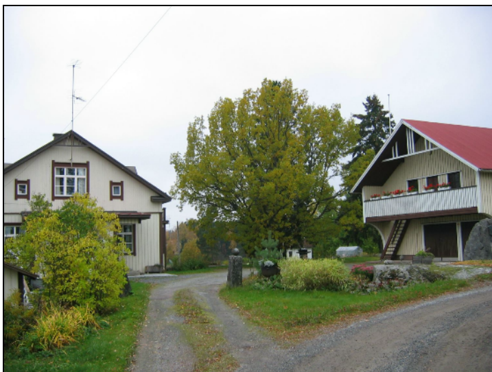
Peevon kylätontin aluetta, länsipuoli. Länteen. Alla itäreunaa koilliseen.

Vesihuolto linja kiertää selvästi paikannetun ja myös ”mahdollisen” kylätontin. Pellossa ei havaittu mitään merkkejä vanhasta kiinteästä asutuksesta. Vesihuoltolinjan kohdalla ei ole muinaisjäännöstä.