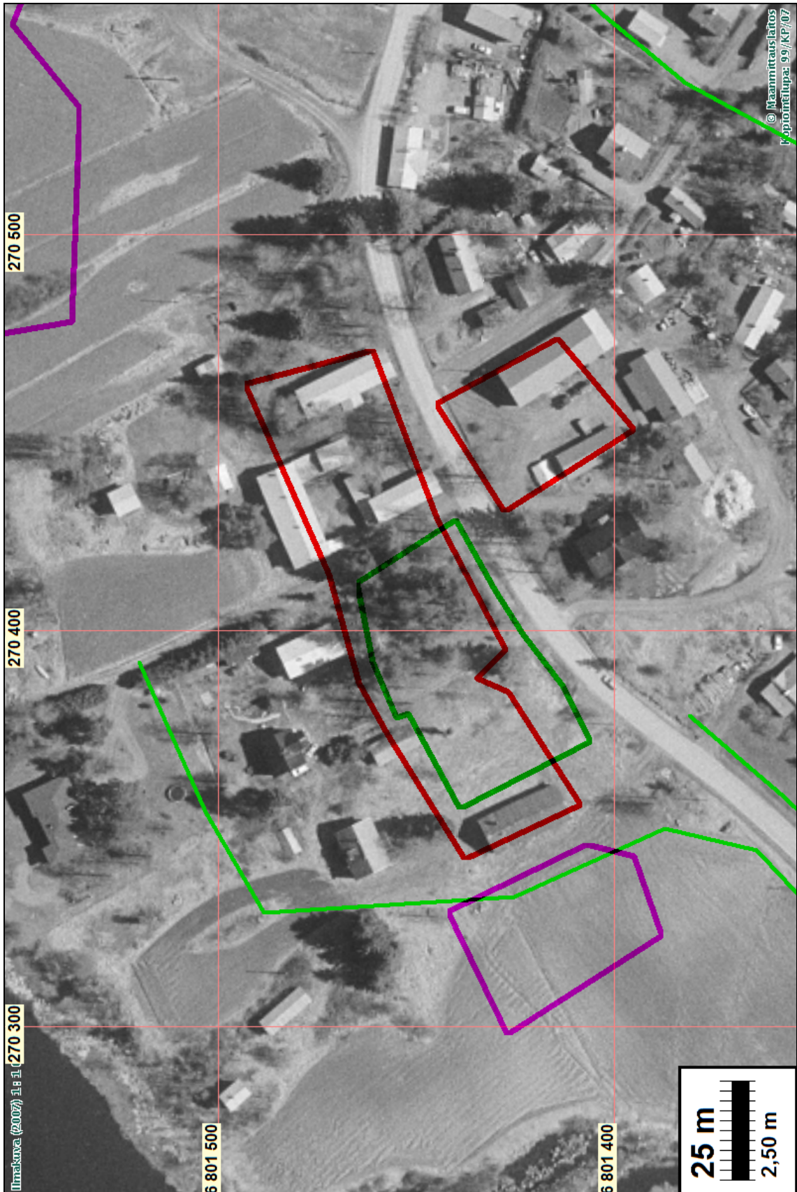
Äetsänkylä. Kylätonttirajaus punaisella, kylätontin muinaisjännösosa vihreällä. Kivikautinen asuinpaikka (todettu ja rajattu v. 2004) sinipunaisella, vesihuoltolinja vaal. vihreällä.