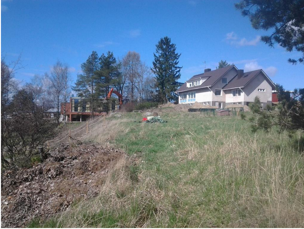
Kuva 1. Tutkimusalue ja kuvan keskellä oleva suunniteltu rakennuspaikka, kuvattu etelästä. AKDG 4241:1