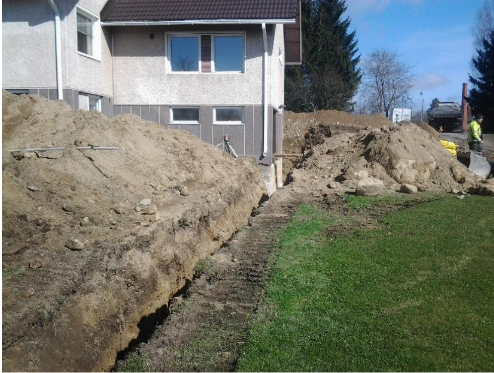
Kuva 4. Valmis kaivanto kuvattu kaakosta. AKDG 4241:4