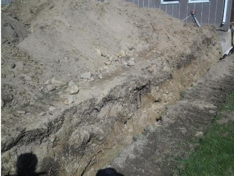
Kuva 6. Putkikaivantoa kuvattu kaakosta. AKDG 4241:6

60 cm paksuinen, paksuuntuen kohti jokirantaa, ulottuen kaivannon ja tontin eteläreunassa kaivannon pohjalle noin 1,5 metrin syvyyteen saakka. Multakerroksen alla on vaaleanruskea hiekka. Tontin ja putkikaivannon eteläreunassa täyttömaa ulottui kaivannon pohjalle, 1,5 metriin saakka. Hiekkakerroksesta poistettiin koneellisesti kaksi kookasta, arviolta noin 2 tonnin painoista kiveä. Kaivannon alueella ei havaittu muinaisjäänökseen viittaavia jälkiä.