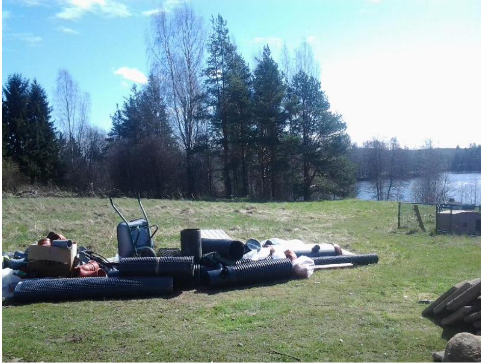
Kuva 3. Riihimäen röykkiöt sijaitsevat sekametsää kasvavalla alueella. Kuvassa etualalla muinaisjäännösalueeseen kuuluva hakamaa. Kuvattu putkikaivannon reunalta lännestä. AKDG 4241:3