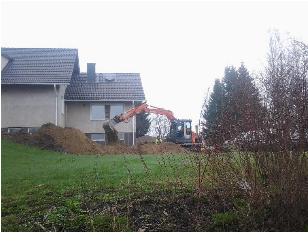
Kuva 2. Alue ennen kaivantoa kuvattu etelästä. AKDG 4241:2