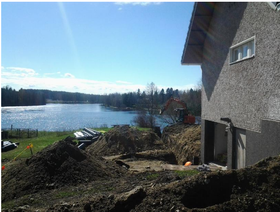
Kuva 5. Valmis kaivanto kuvattuna pohjoisesta. Taustalla Kokemäenjoki. AKDG 4241:5