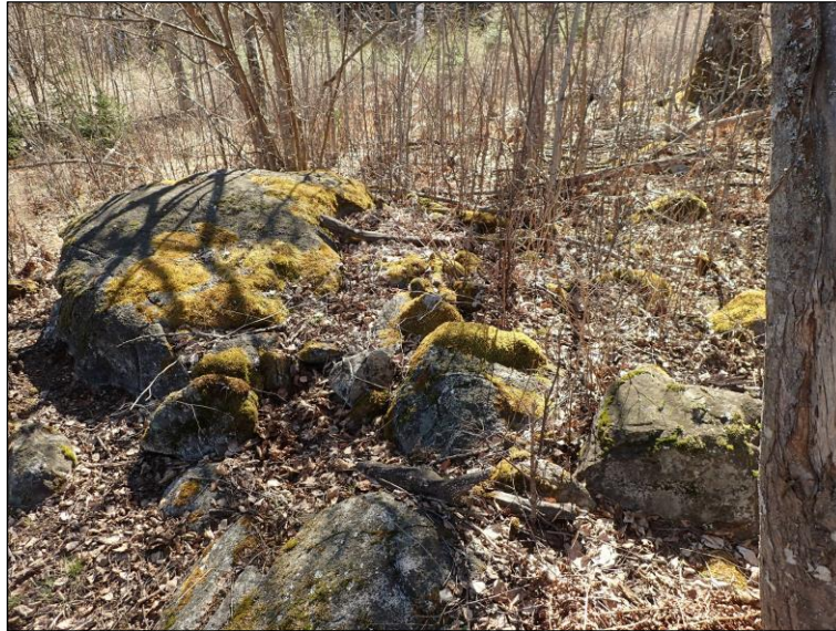
Nelisivuinen rökkiö kiven kupeessa – hieman epämääräinen ehkä.