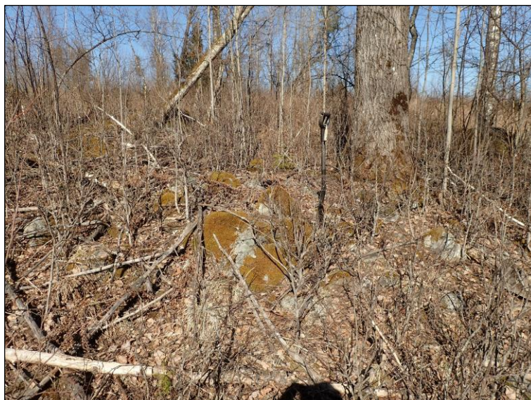
Rökkiö ison haavan kupeessa.