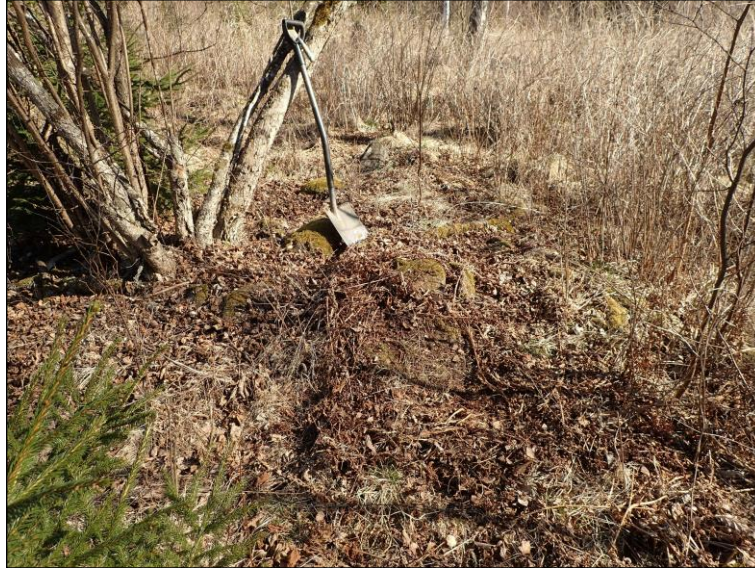
Sammalpeitteinen rökkiö - lapio keskellä