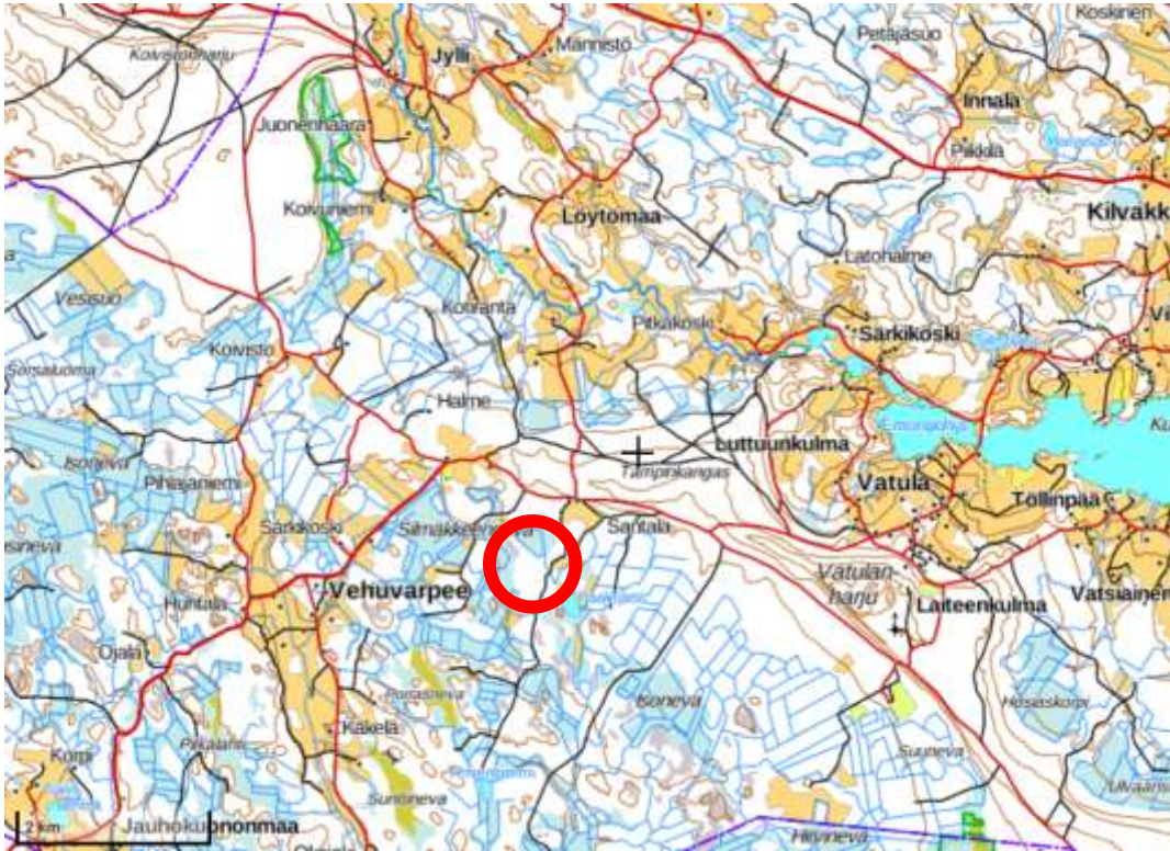
Karttaote Maanmittauslaitoksen Karttapaikka 17.8.2017. Kohde punaisella ympyrällä merkittynä.