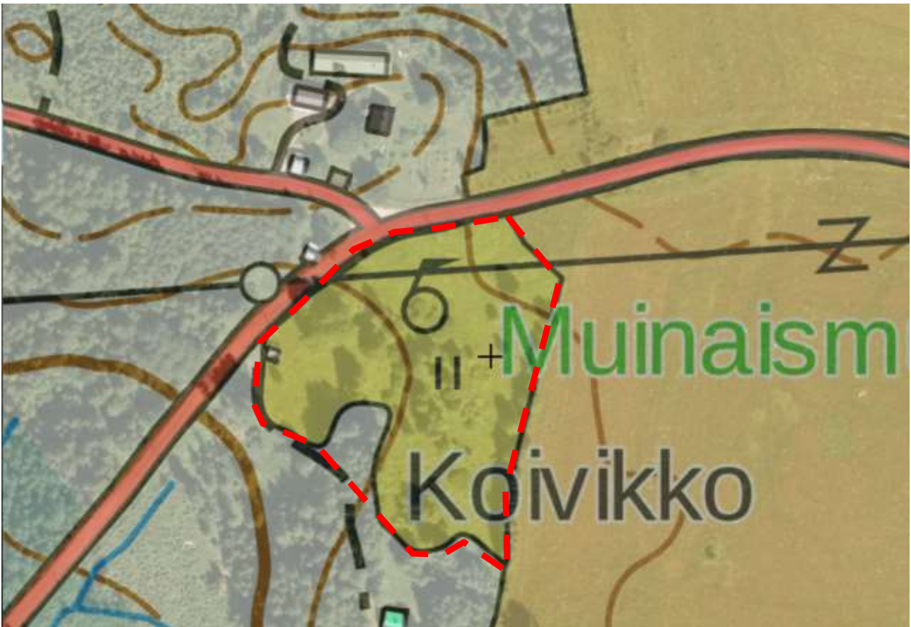
Kuva 1. Ilmakuvan ja maastokartan yhdistelmä. Punaisella katkoviivalla muinaisjäänökselle määritelty rajaus. Maanmittauslaitoksen karttapaikka 17.8.2017.

Kohteelle määriteltiin rajaus kartan, ilmakuvan ja perinnebiotoopin rajauksen perusteella (kuva 1) ja se vietiin muinaisjäänösrekisteriin ja rajattiin 17.8.2017. Kohteen muinaisjäänösrekisteritunnus on 1000031194.