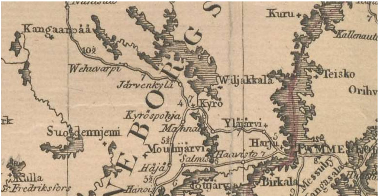
Kartta 2. Karttaote vuoden 1806 tiekartasta. 5

Vuoden 1806 tiekartalla (kartta 2) paikka on merkitty nimellä Wehuvarpi. Se sijaitsee välittömästi tien vieressä. Karttaan on merkitty vain päätiet ja suuntaa-antavasti suhteessa paikkoihin ja isoimpiin vesistöihin.