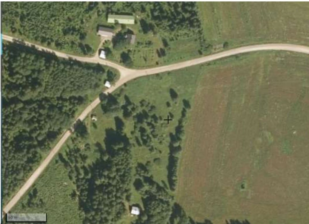
Ilmakekuvaote alueesta. Maanmittauslaitoksen karttapaikka 17.8.2017.