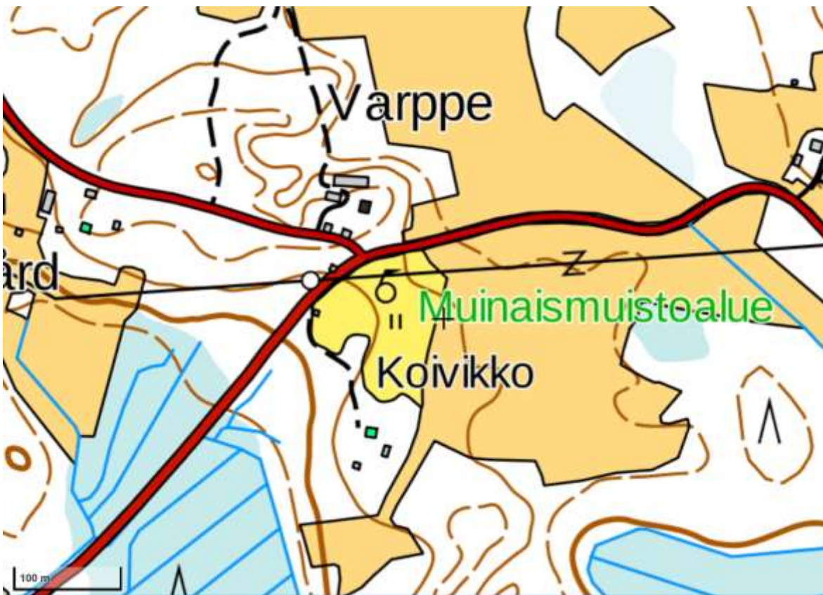
Kartta 1. Kohteen sijainti. Ote Maanmittauslaitoksen Karttapaikasta 17.8.2017.

Wehuvarpeen kestikievarin paikka sijaitsee Ikaalisissa Vehuvarpeesta 1,8 km koilliseen ja Ikaalisten kirkosta 12 km länsilounaaseen tien vieressä Varpeen tilan eteläpuolella (liite 1, kartta 1). Kohde on pellon länsipuolella oleva, heinää kasvava ja pääosin kyntämätön alue. Maanmittauslaitoksen sähköisessä kartassa paikalla on merkintä Muinaismuistoalue. Kohteen sijaintikoordinaatit ovat 6851403,096 / 280605,468 Maanmittauslaitoksen Karttapaikalla (kohteen arvioitu keskikoordinaatti, ETRS-TM35FIN). Kohde sijaitsee historiallisen Kyrönkankaantien ja Hämeenkankaantien muodostaman reitistön varrella. Tien vanhimmat linjaukset ajoittuvat jo keskiajalle.