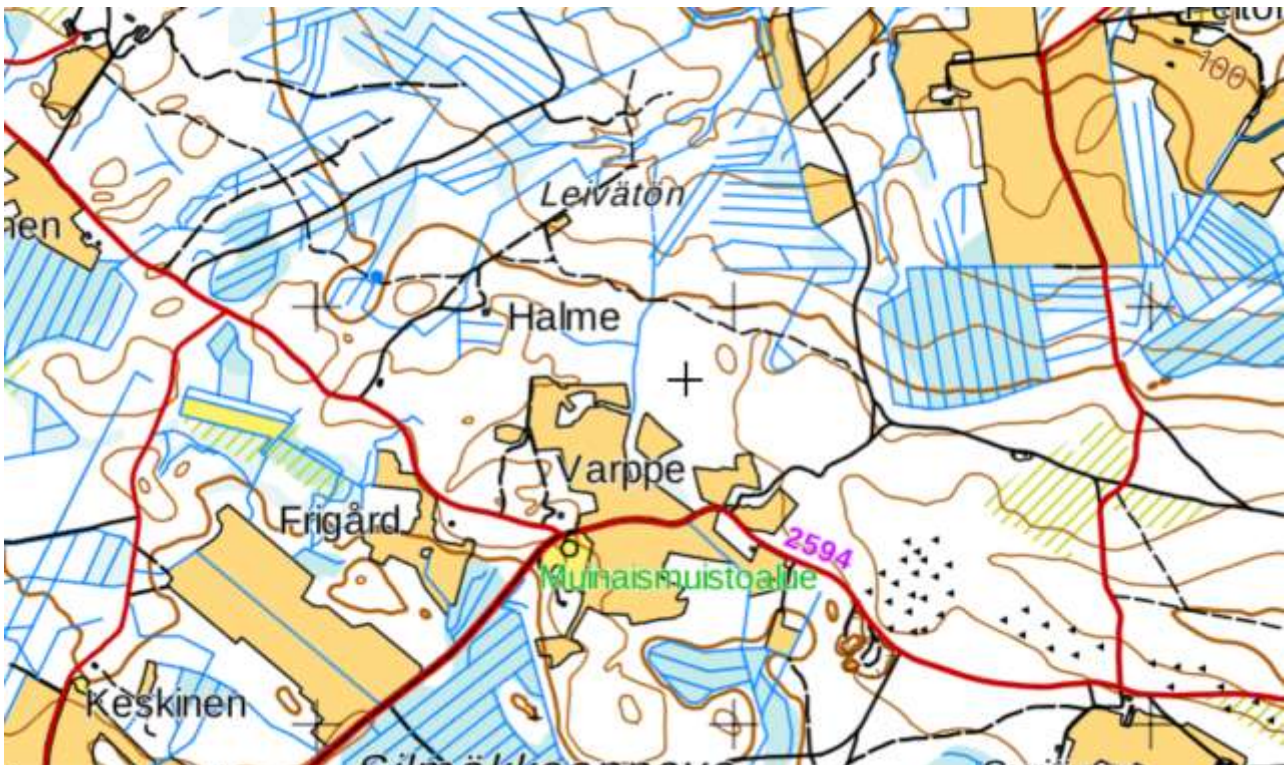
Kartta 4. Ote Maanmittauslaitoksen karttapaikasta 17.8.2017.