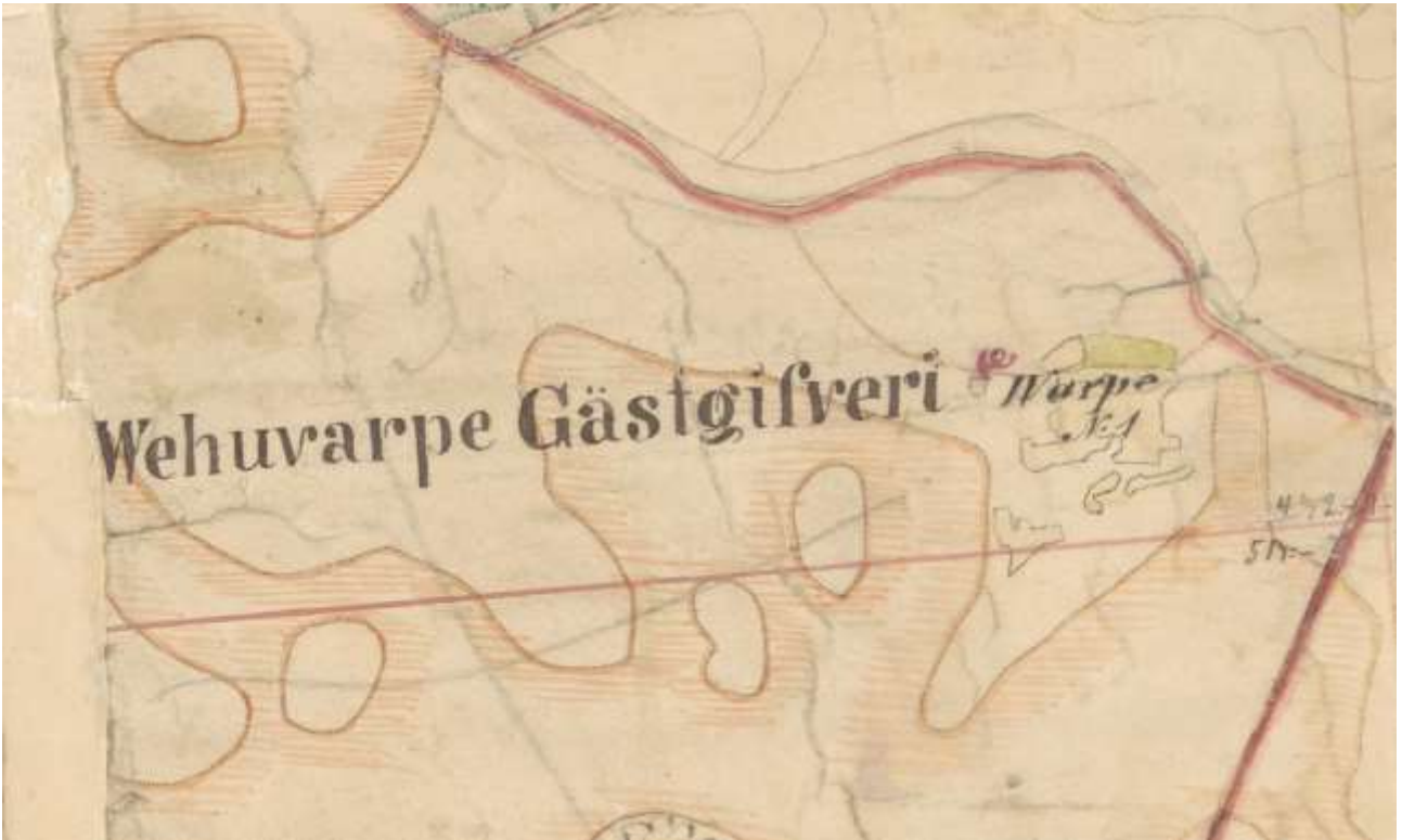
Kartta 3. Ote pitäjänkartan karttalehdestä 212205+021a. http://digi.narc.fi/digi/view.ka?kuid=1364956

1800-luvun puolivälin pitäjänkartalla (kartta 3) kohde on merkitty Wehuvarpe Gästgifveri -nimellä päätien eteläpuolella kulkevan silmukkamaisen pienemmän tien varteen. Nykykartalla (kartta 4) päätien kohdalla on vielä nähtävissä katkoviivalla merkittyä kärrytietä.