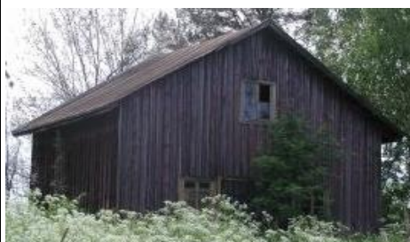
2. Talousrakennus lännestä