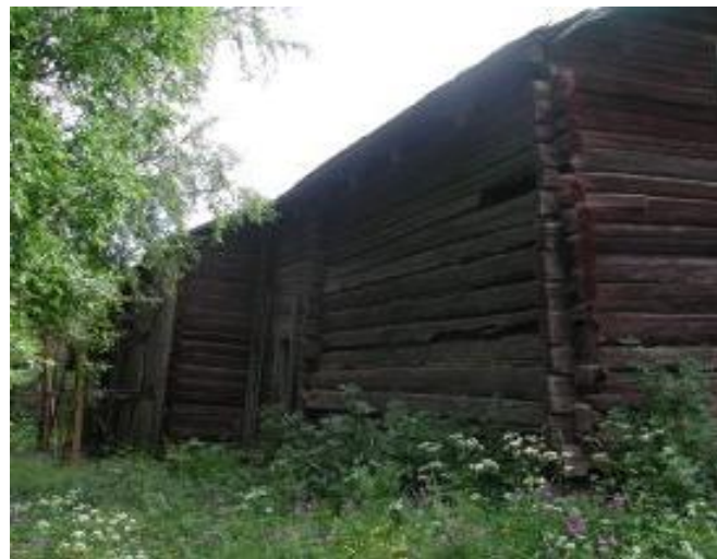
Osat 1 ja 2 pohjoisesta