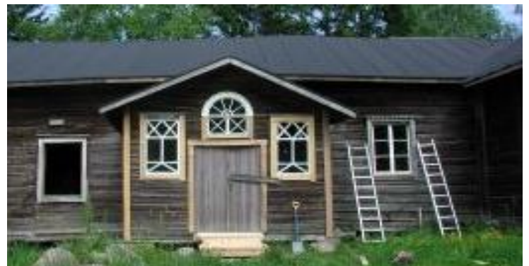
Osan 2 kaakkoispää