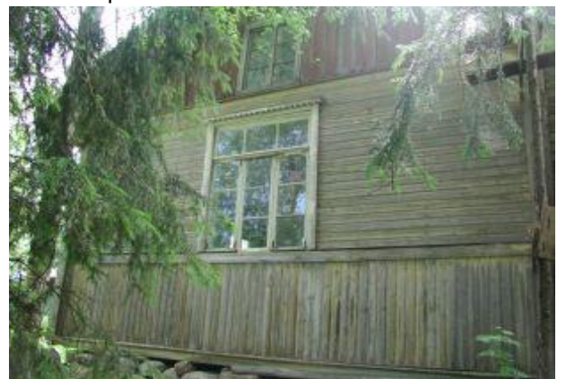
Vasemmalla osan 3 lounaispääty, ylhäällä koillispääty