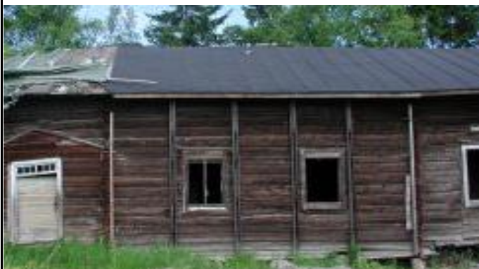
Osan 1 kuisti ja osan 2 luoteispää