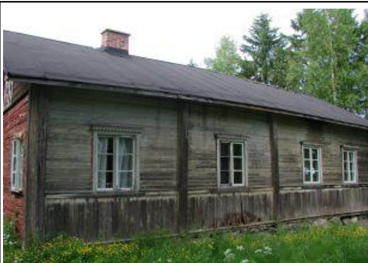
Osa 3 etelästä