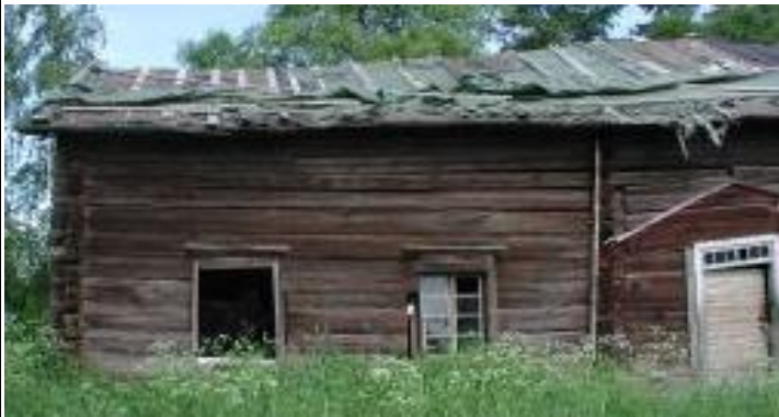
Osan 1 luoteispää