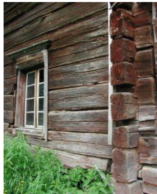
Osa 1, kuistin viereinen nurkka