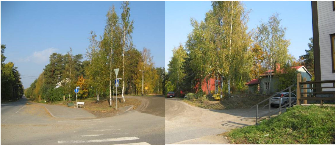
Vasemmalla pensasaidan takana Nuijala, oikealle Sirkanlinna ja Syrjänpää, laidassa Suojan talon kulma. Talviaikaan rakennukset näkyvät selvemmin.

Pälkäneen muihin käsityöläisalueisiin verrattuna Nuijanmäki on mittakaavaltaan selvästi pienempi ja vapaamuotoisemmin rakentunut. Asuinkiinteistöistä kaksi on voimassa olevassa asemakaavassa puistoaluetta.