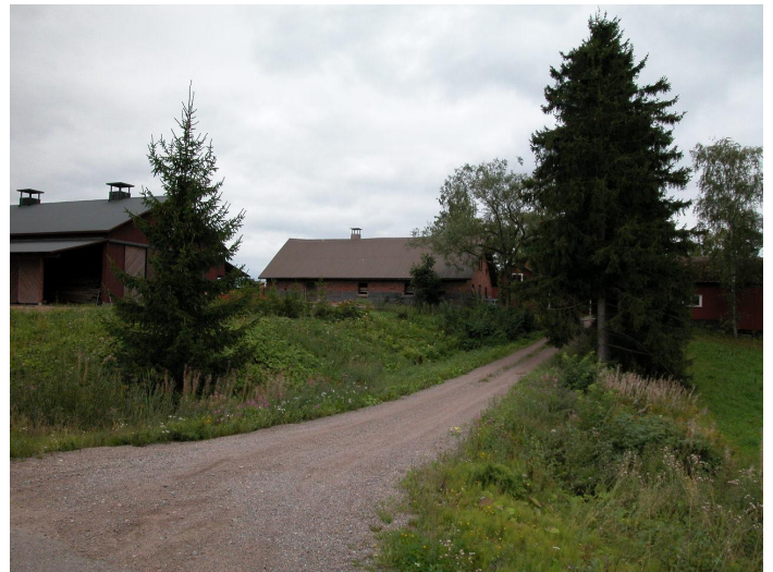
Pihatie Lempiäniemen tieltä nähtynä.