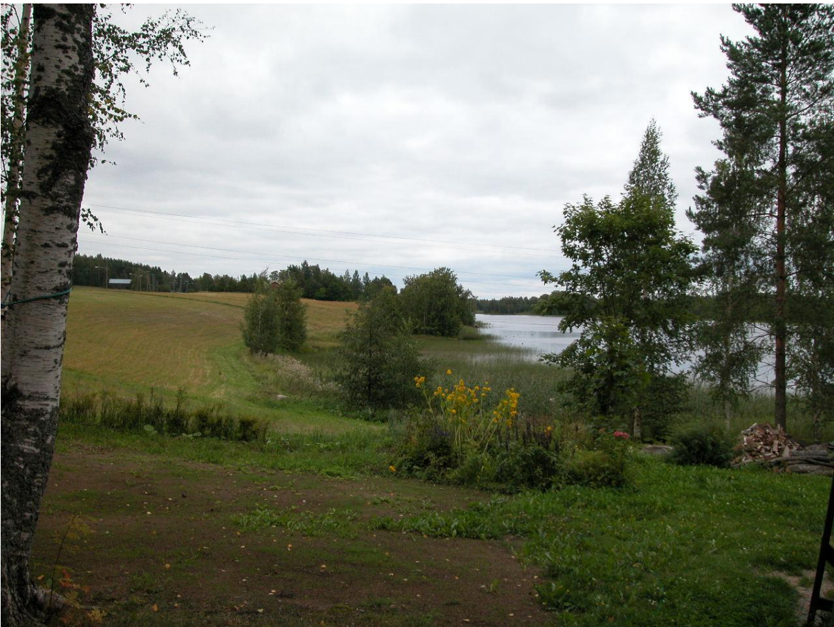
Näkymä Liimolasta kohti asemakaava-aluetta (taustalla Tiuran tila.)