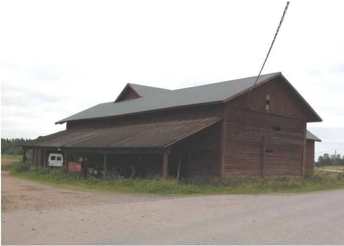
Riihi (nykyinen viljan kuivaamo)