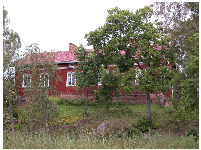
Päärakennus etelästä nähtynä.