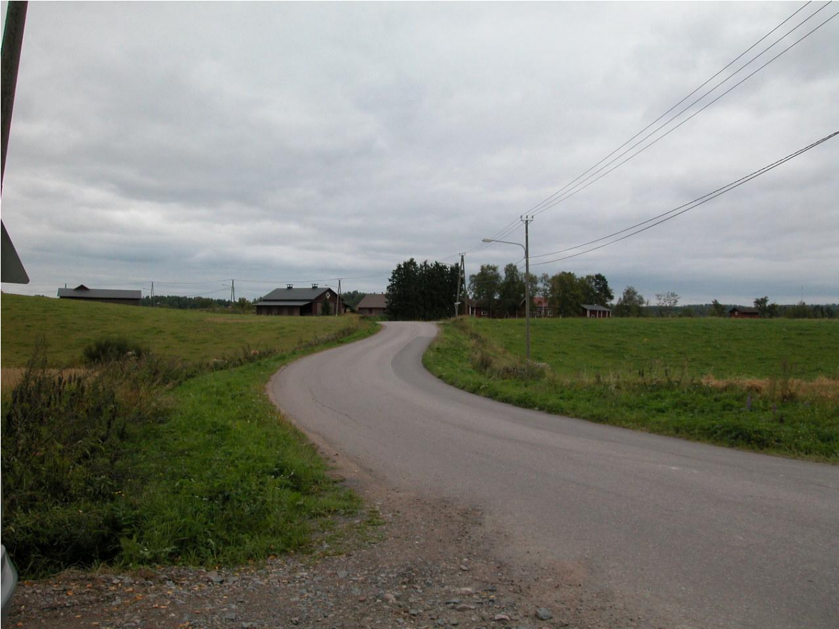
Näkymä loululta kohti Liimolan tilakekeskusta.