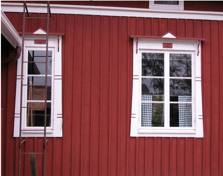
Ikkunat kuistin vieressä.