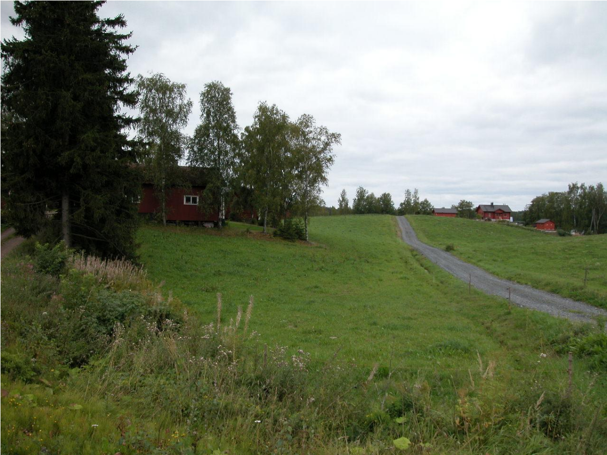
Liimolan tilakeskuksen länsireuna ja tie naapuriin.