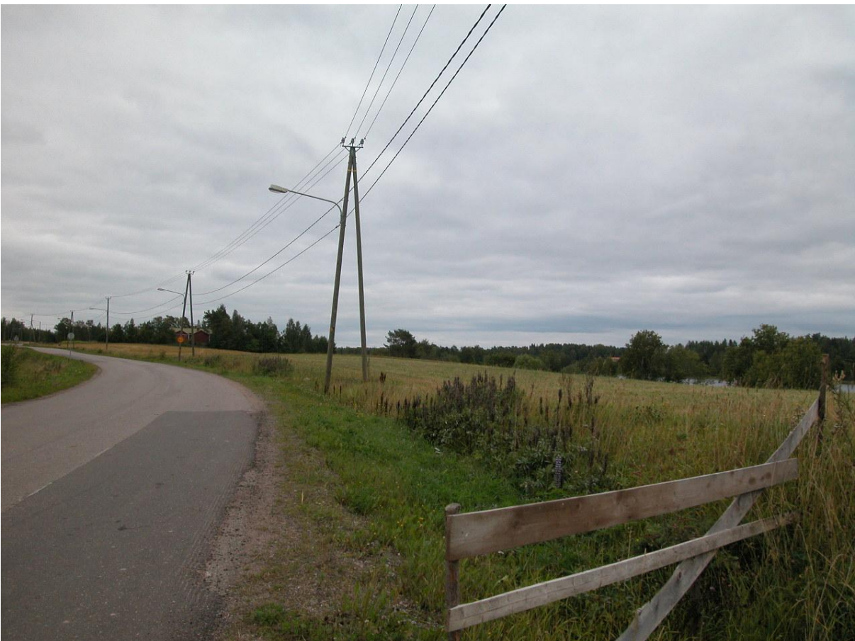
Näkymä riiheltä asemakaava-alueelle rantaan.