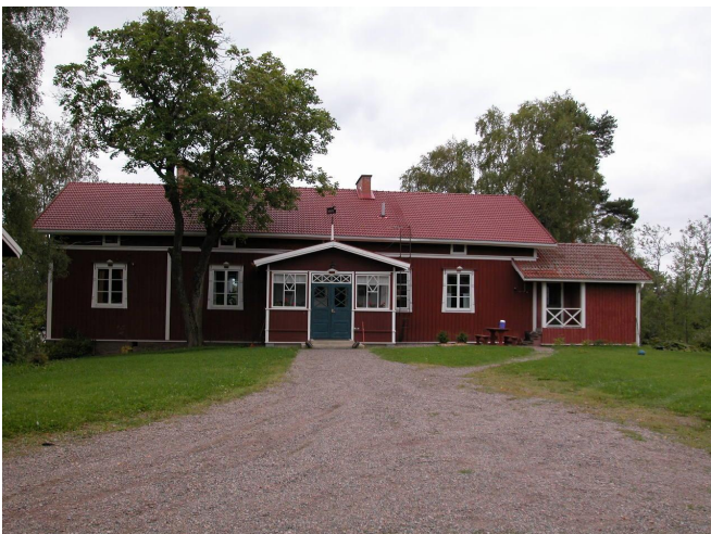
Päärakennus nähtynä pohjoisesta.