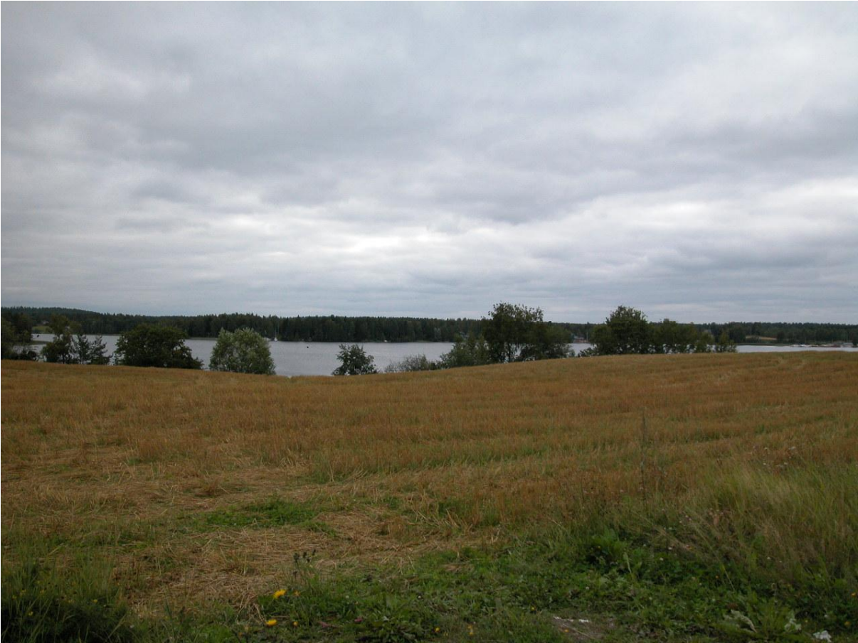
Näkymä (etelään) paikallistieltä asemakaava-alueelle ja rantaan.