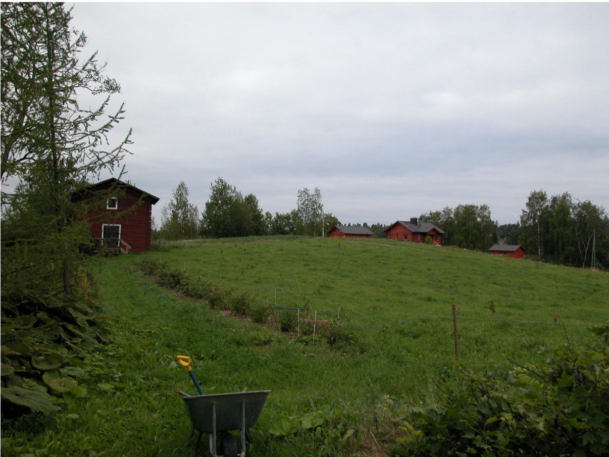
Näkämä luhtiaitan päästä Liimolan makasiinille.