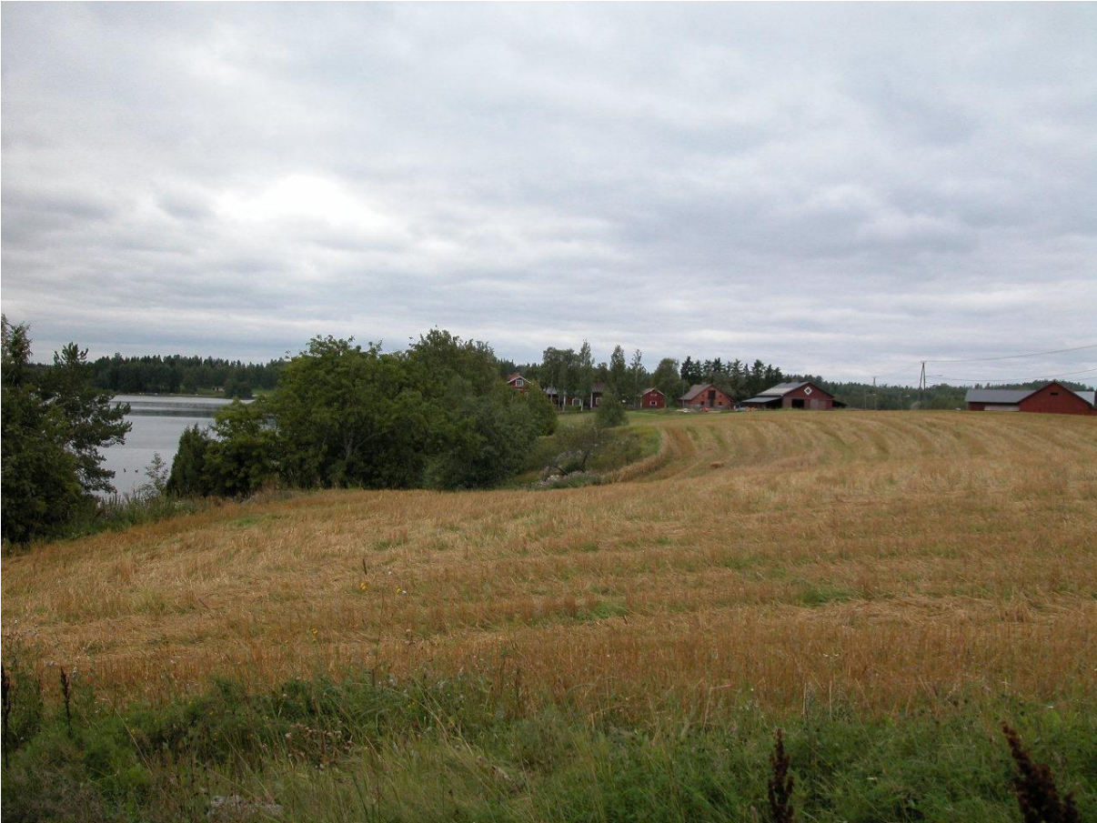
Näkymä asemakaava-alueelta kohti Liimolaa.