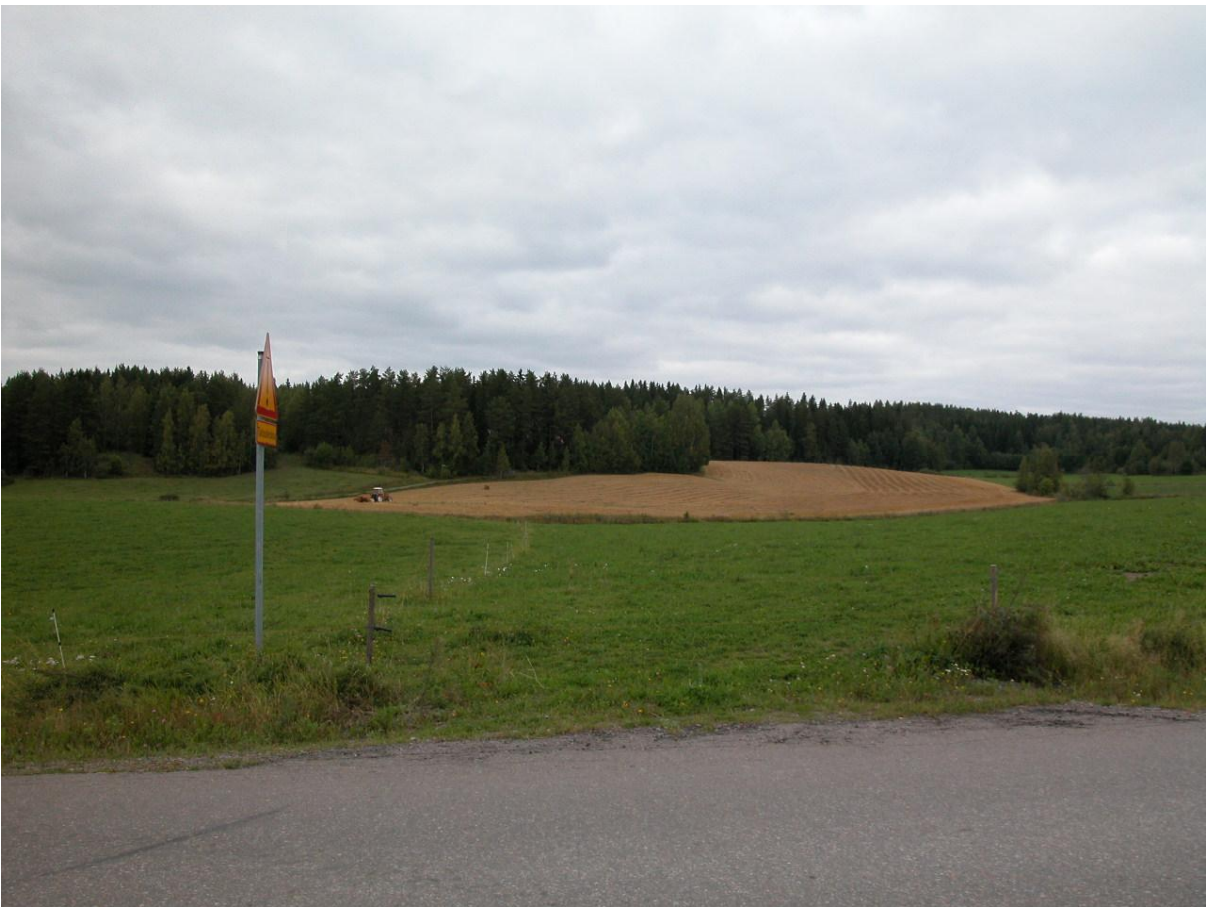
Näkymä (pohjoiseen) paikallistieltä kohti metsän reunaa.