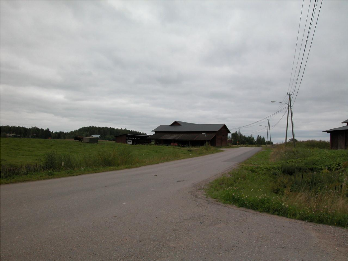
Näkymä paikallistieltä Liimolan riihelle.