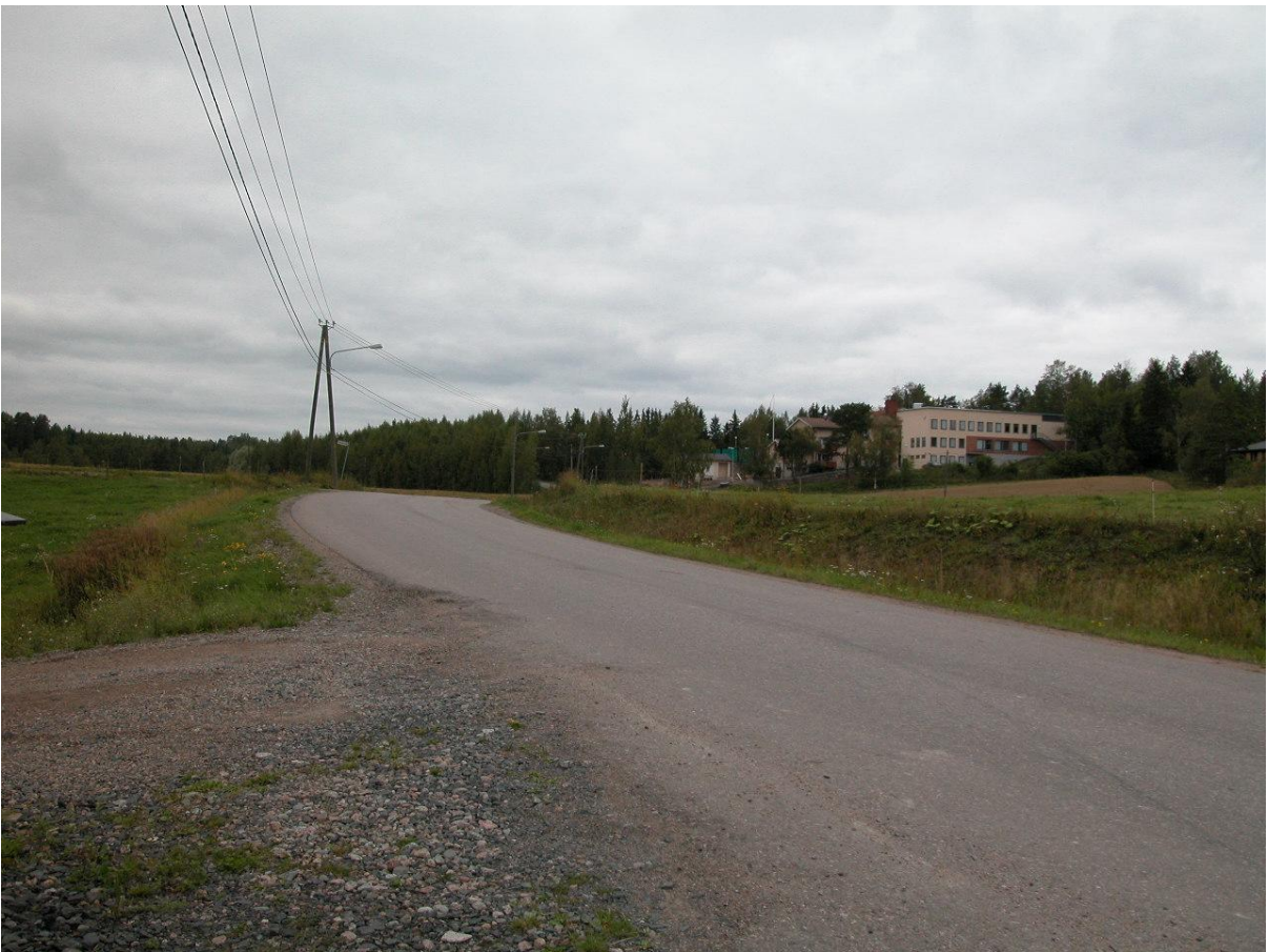
Näkymä Liimolan tilakeskuksesta kohti koulua.