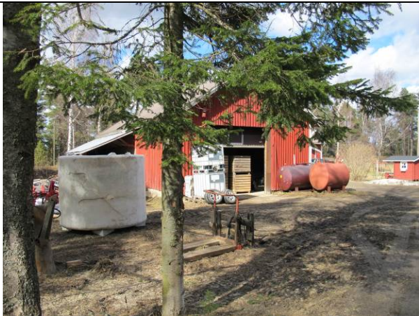
635-426-3-41 Väinölä navetta 2 etelästä 2013