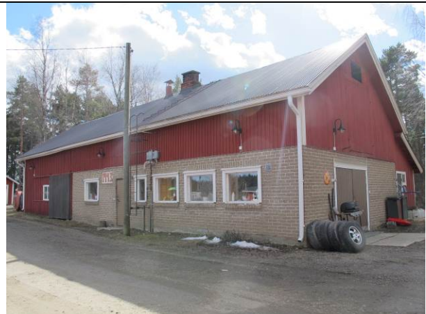
635-426-3-41 Väinölä navetta 2 pohjoisesta 2013