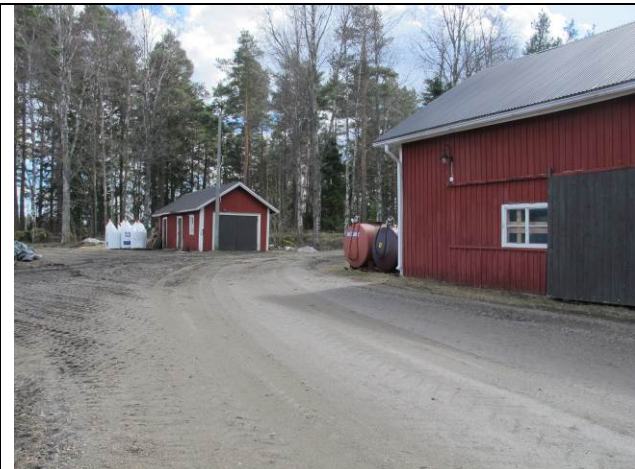
635-426-3-41 Väinölä pihaa pohjoisesta ja autotalli-sauna 3 2013