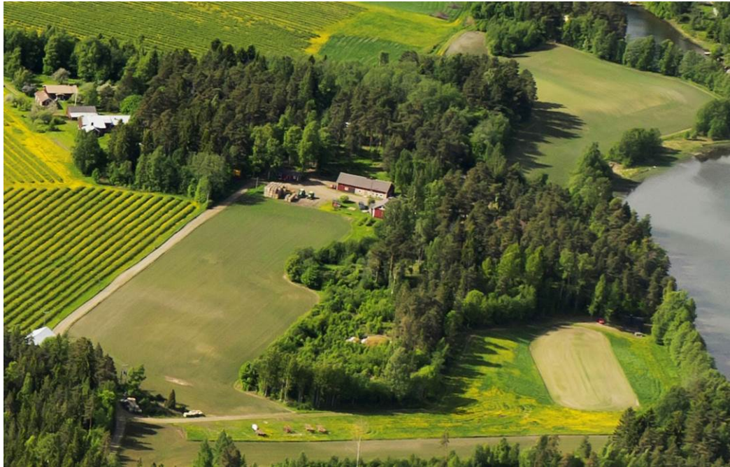
Ilmakuva koillisesta 2011.