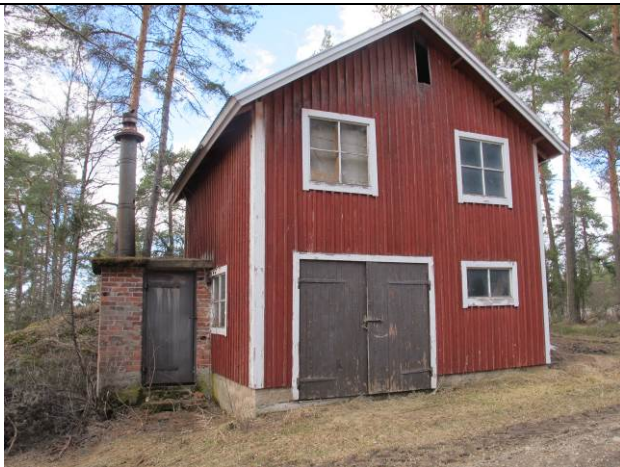
635-426-3-41 Väinölä kuivuri 4 etelästä 2013