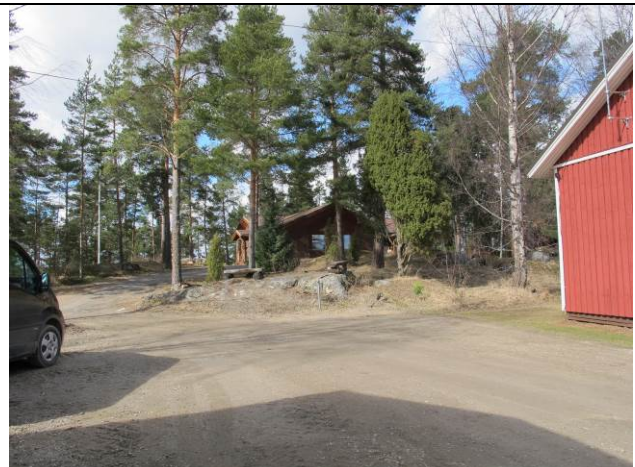
635-426-3-41 Väinölä päärakennus 6 etelästä 2013