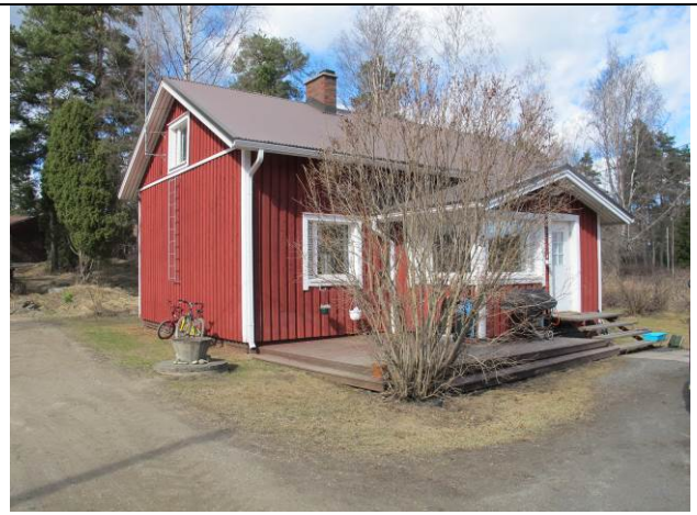
635-426-3-41 Väinölä päärakennus 1 etelästä 2013