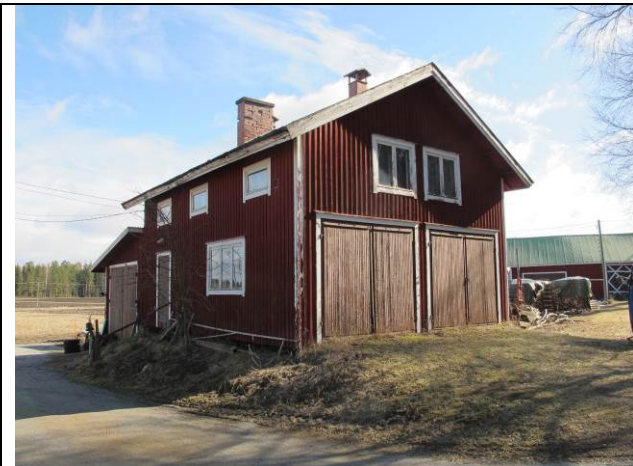
424-2-128 Yli-Hiissa traktoritalli 6 lounaasta 2013