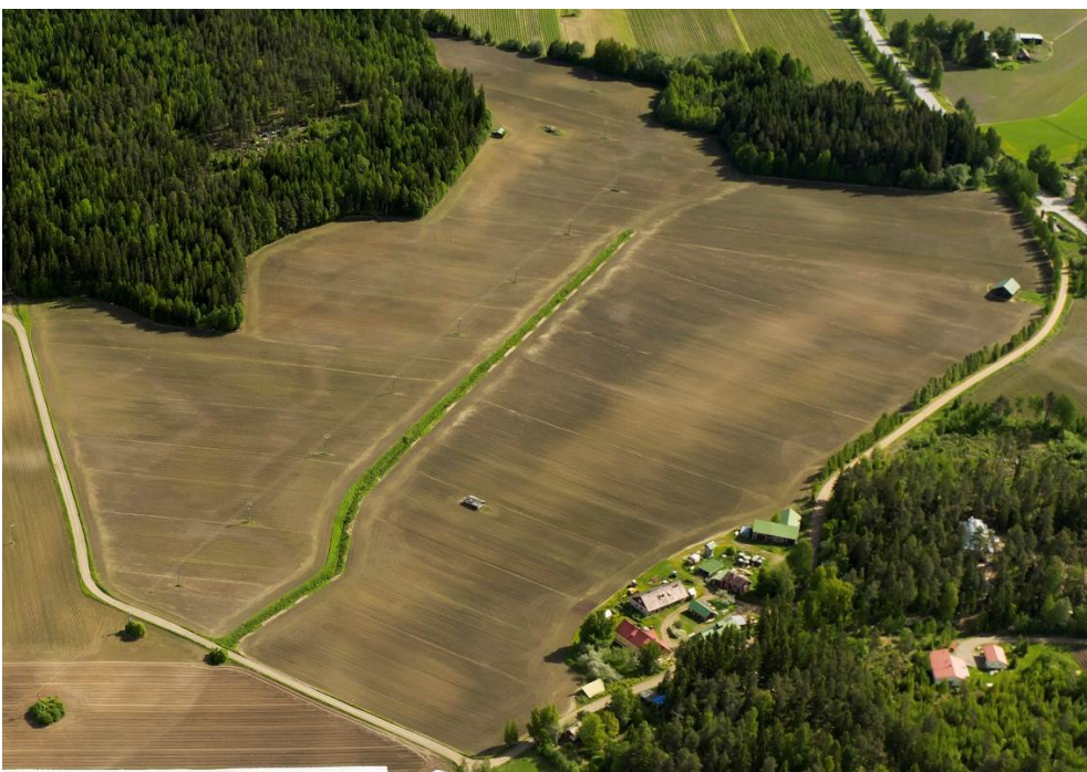
Ilmakuva lounaasta 2011. Lentokuva Vallas, om. Pälkäneen kunta.