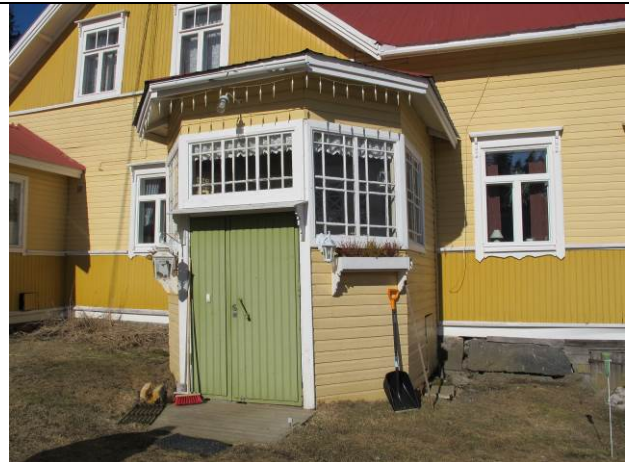
424-2-128 Yli-Hiissa päärakennus 1 kuisti idästä 2013