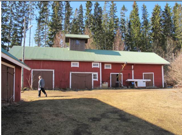
424-2-128 Yli-Hiissa aitta-kuivuri 2 lännestä 2013