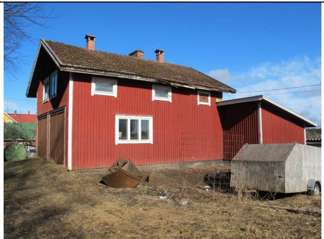
424-2-128 Yli-Hiissa traktoritalli 6 kaakosta 2013