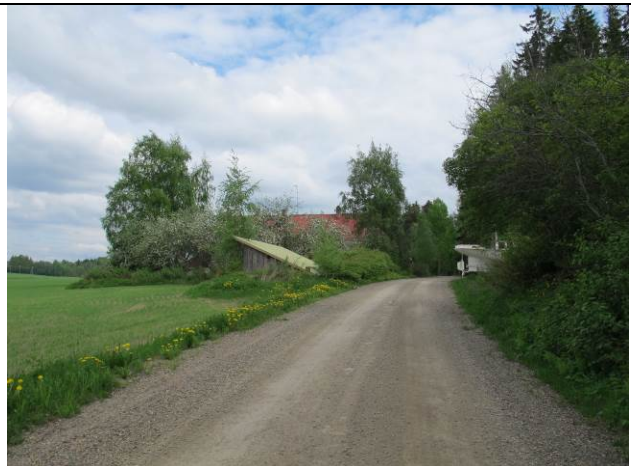
424-2-128 Yli-Hiissa kellari 10 lännestä 2013