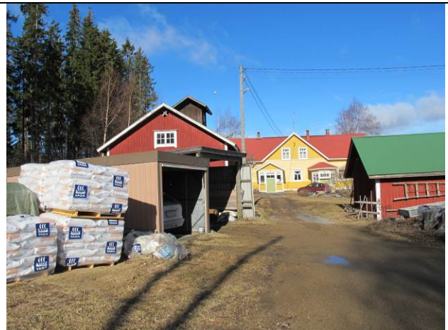
424-2-128 Yli-Hiissa autokatos 5 idästä 2013