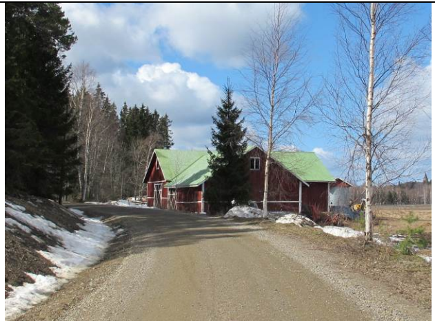
424-2-128 Yli-Hiissa lato 8 idästä 2013