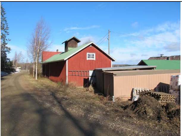
424-2-128 Yli-Hiissa näkymä tieltä lännestä 2013