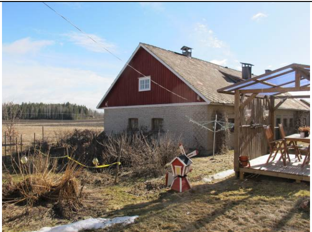
424-2-128 Yli-Hiissa päärakennus 1 lännestä 2013