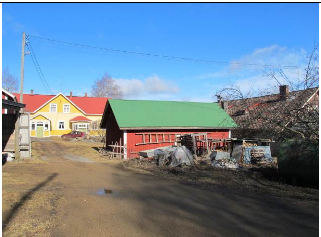
424-2-128 Yli-Hiissa sauna-liiteri 3 idästä 2013