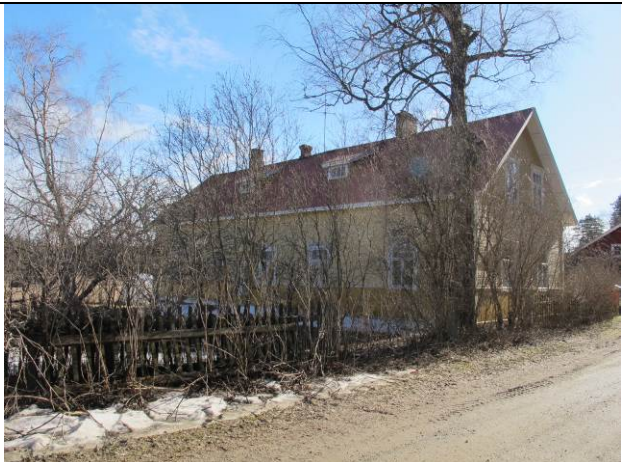
424-2-128 Yli-Hiissa päärakennus 1 lännestä 2013