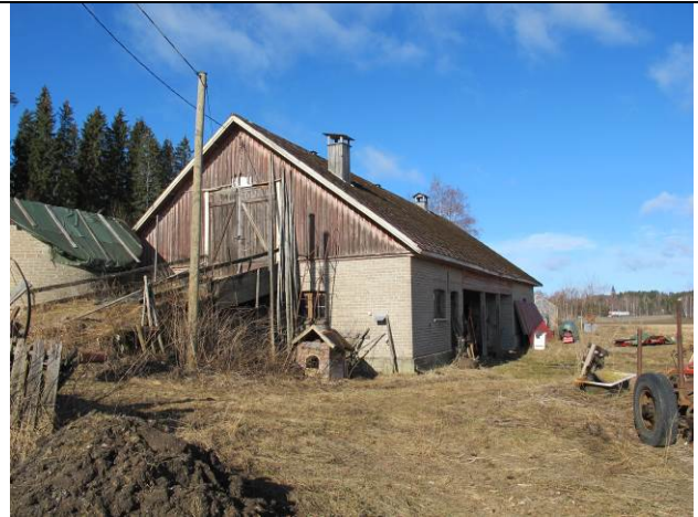
424-2-128 Yli-Hiissa navetta-varasto idästä 2013