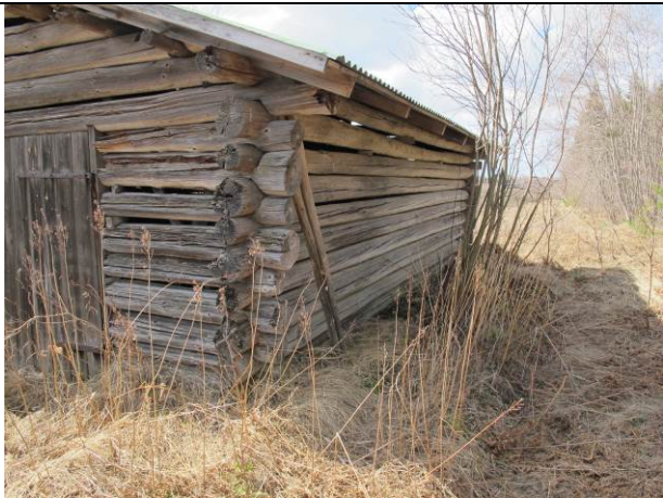
424-2-128 Yli-Hiissa lato 12 koillinen nurkkasalvos 2013