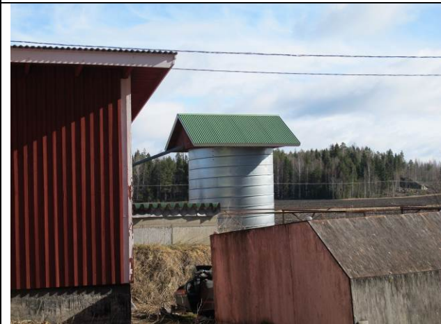
424-2-128 Yli-Hiissa viljasilo 9 etelästä 2013