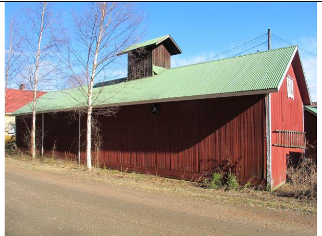
424-2-128 Yli-Hiissa aitta-kuivuri 2 pohjoisesta 2013