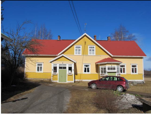
424-2-128 Yli-Hiissa päärakennus 1 idästä 2013