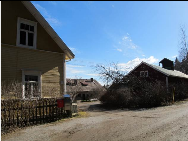
424-2-128 Yli-Hiissa näkymä pihaan lounaasta 2013