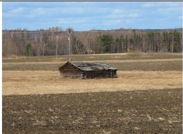
424-2-128 Yli-Hiissa lato 13 kaakosta 2013