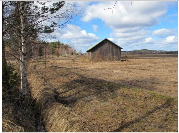
424-2-128 Yli-Hiissa lato 11 idästä 2013