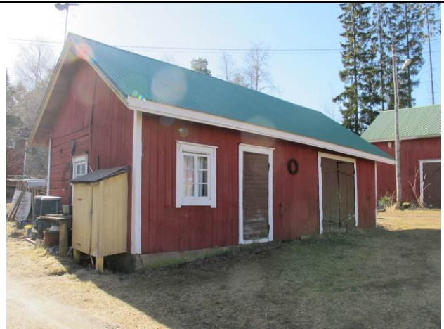
424-2-128 Yli-Hiissa sauna-liiteri 3 luoteesta 2013