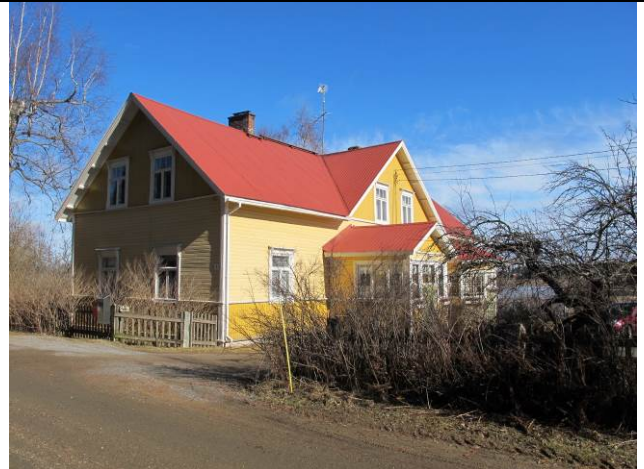
424-2-128 Yli-Hiissa päärakennus 1 kaakosta 2013