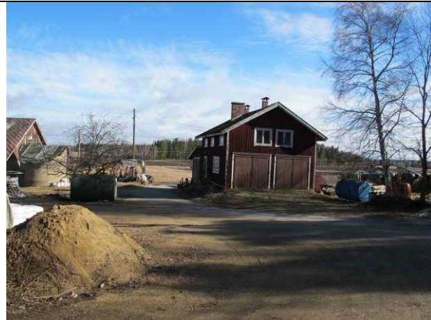
424-2-128 Yli-Hiissa näkymä talouspihaan etelästä 2013