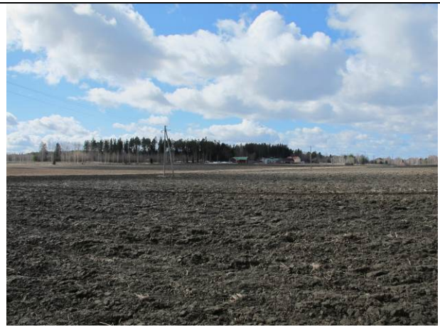
424-2-128 Yli-Hiissa näkymä ladolta lounaaseen 2013