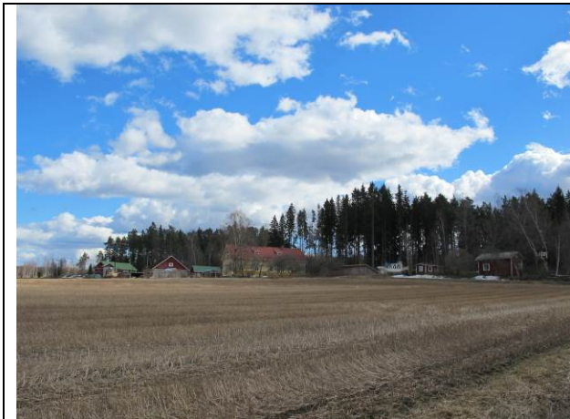
424-2-128 Yli-Hiissa yleisnäkymä luoteesta 2013