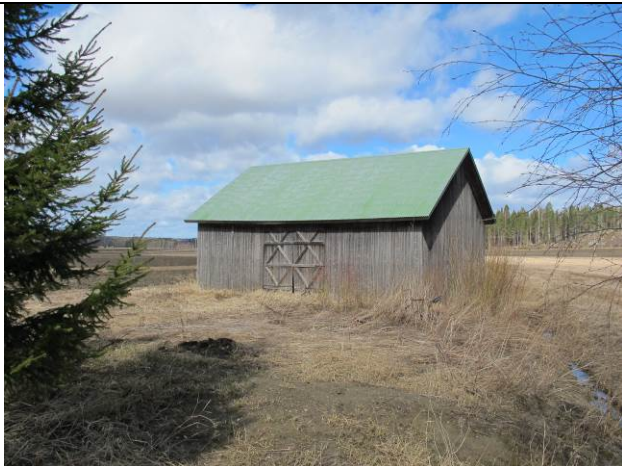
424-2-128 Yli-Hiissa lato 11 kaakosta 2013