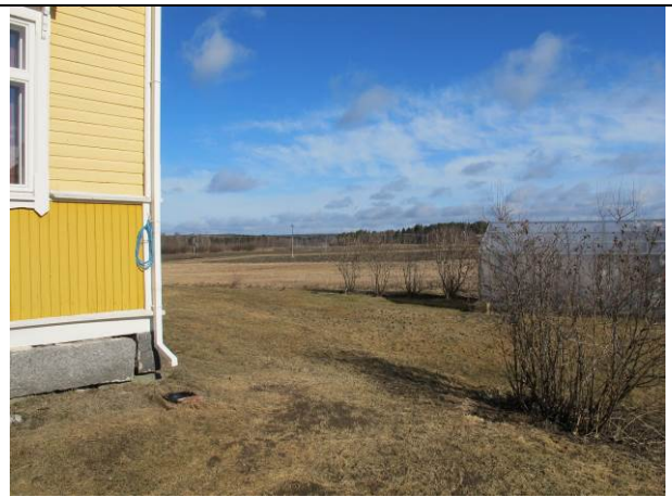
424-2-128 Yli-Hiissa näkymä pihasta Pappilanlahdelle 2013