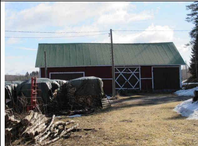
424-2-128 Yli-Hiissa lato 8 lännestä 2013