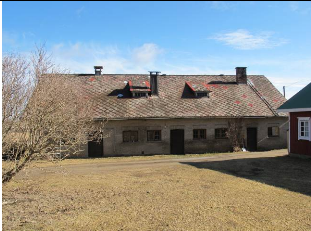
424-2-128 Yli-Hiissa navetta-varasto 3 etelästä 2013