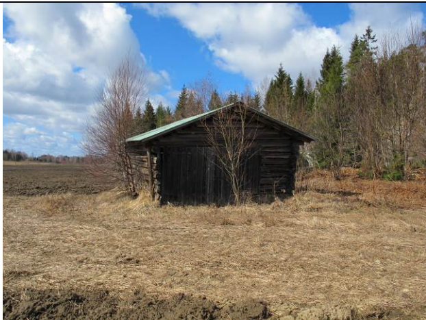
424-2-128 Yli-Hiissa lato 12 idästä 2013