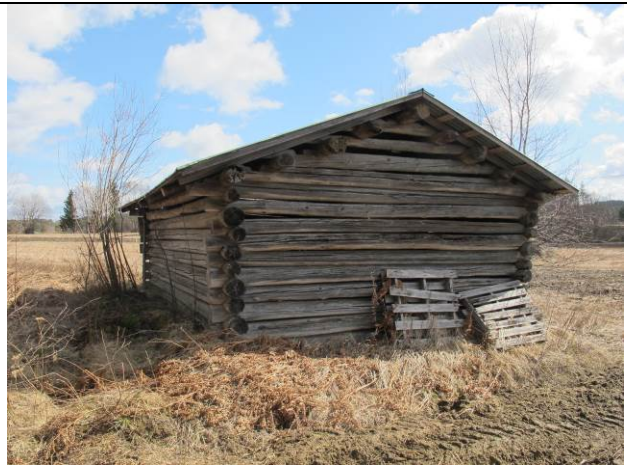
424-2-128 Yli-Hiissa lato 12 lännestä 2013