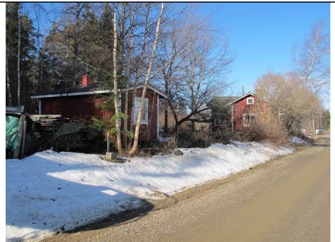
635-424-6-12 Kaislakorpi yleiskuva idästä 2013