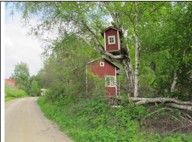
635-424-6-12 Kaislakorpi yleiskuva ja päärakennus 1 lännestä 2013