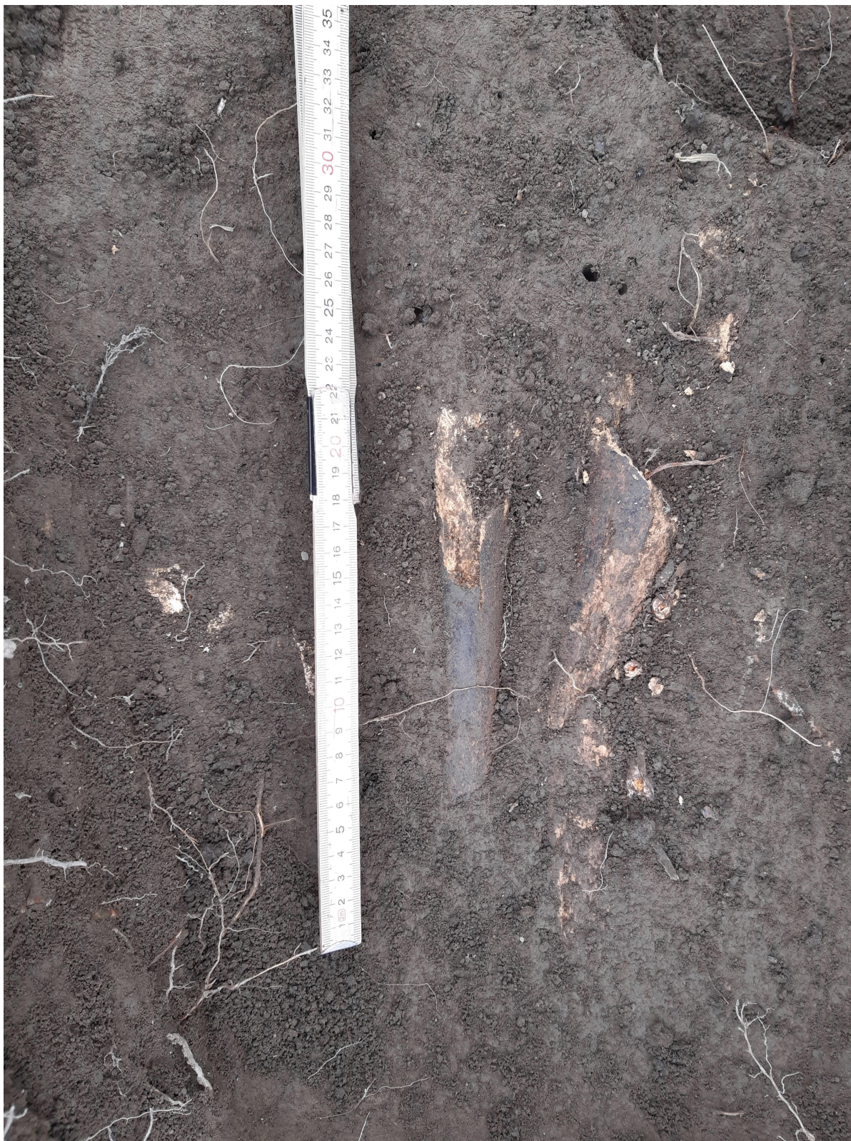
Koekuopan 1 keskimmäinen osio, jossa kaksi palamatonta putkiluuta vierekkäin Kuvattu kaakosta.