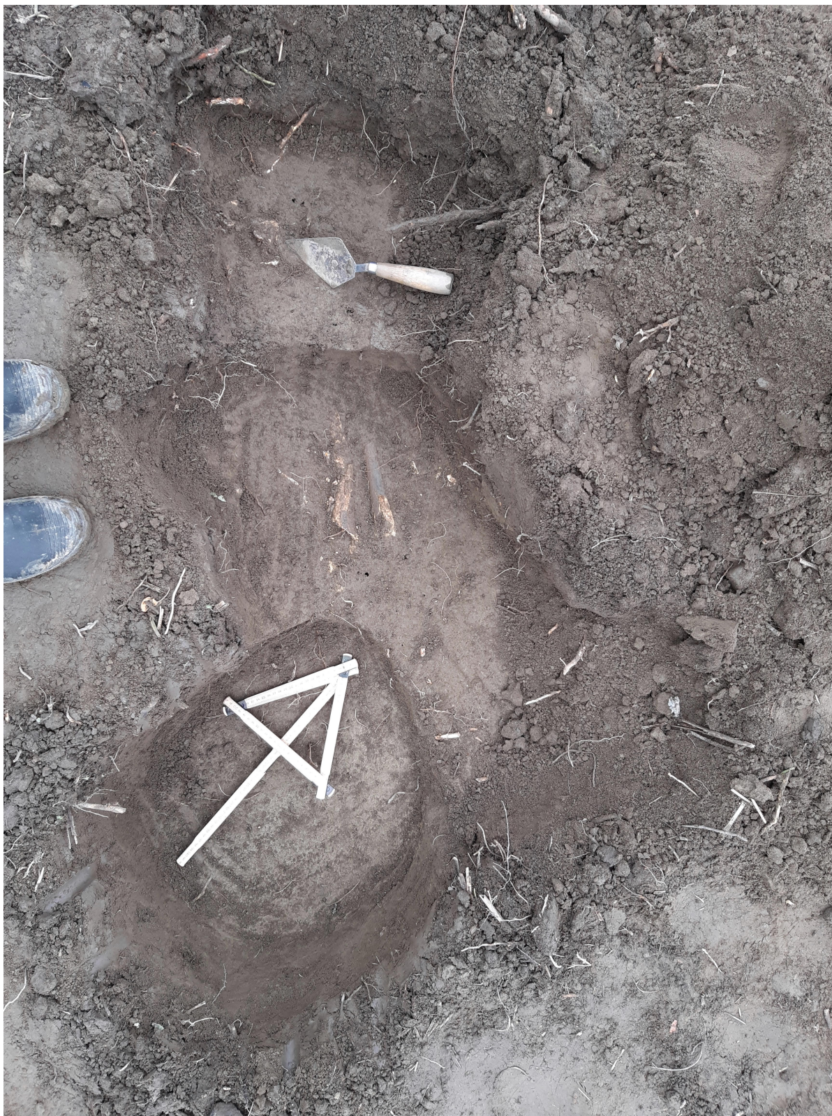
Laajennettu koekuoppa 1, josta löytyi palamatonta luuta peltokerroksen alta, 18-25 cm syvyydestä. Kuvattu eteläkaakosta. 8.10.2021