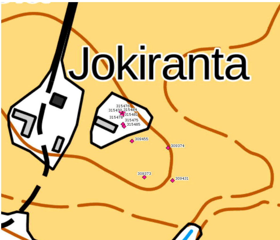
Karttaote Ilpparilöytöjen sijainnista. Pohjakartta (c) Maanmittauslaitos 01/2022 Kirsi Luoto 4.1.2022