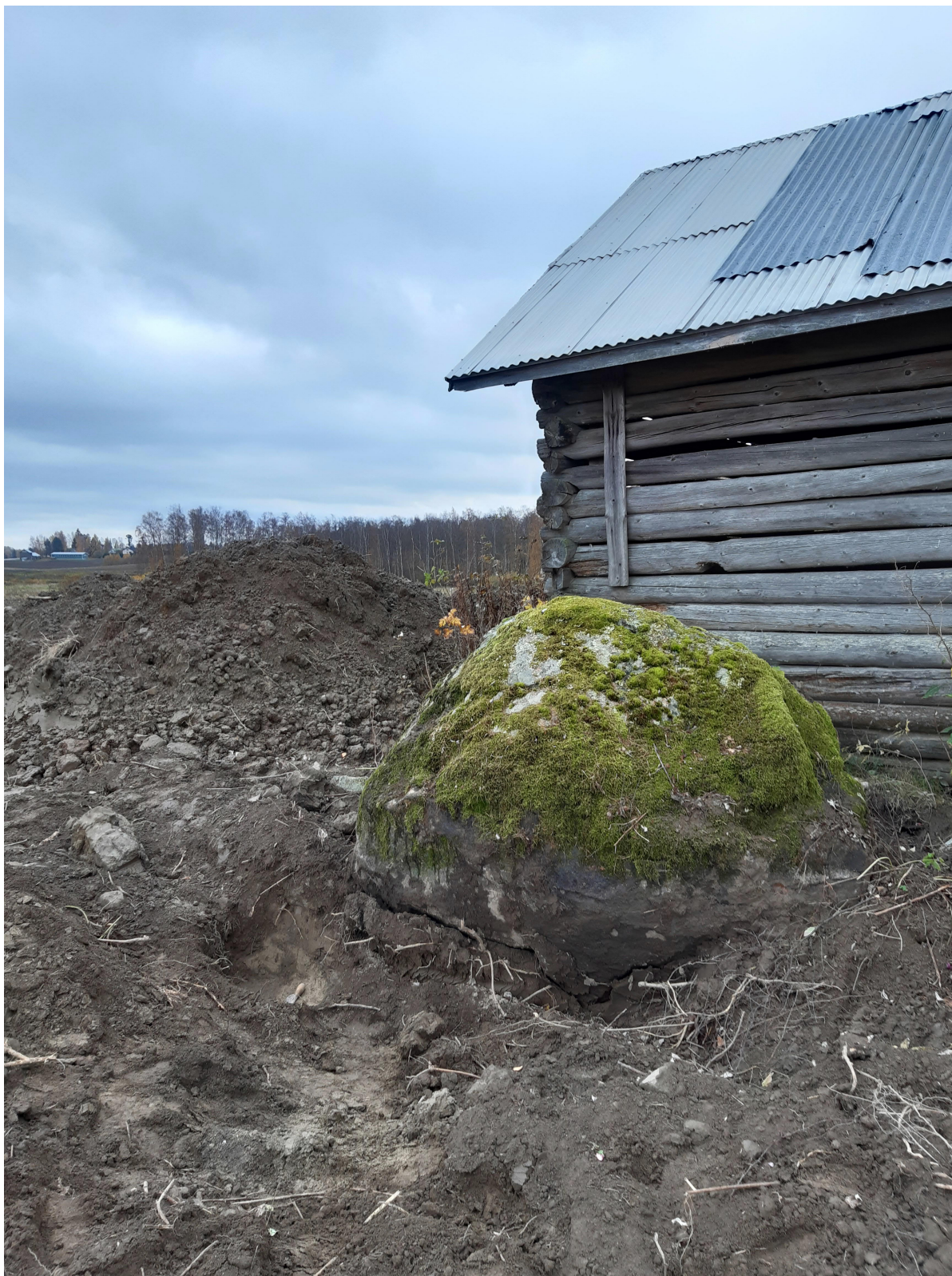
Suuren maakiven viereisen koekuopan nro 5 sijaintipaikka kuvattuna pohjoisluoteesta. 8.10.2021