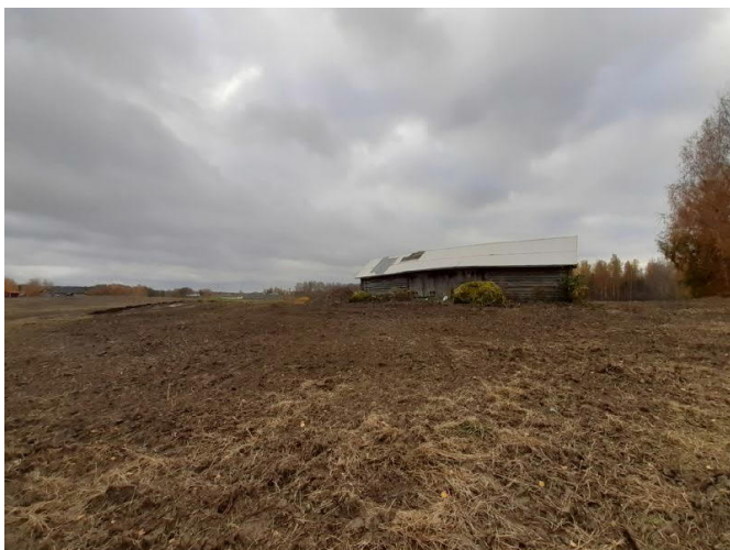
Yleiskuva kohteen alueesta kuvattuna luoteesta.