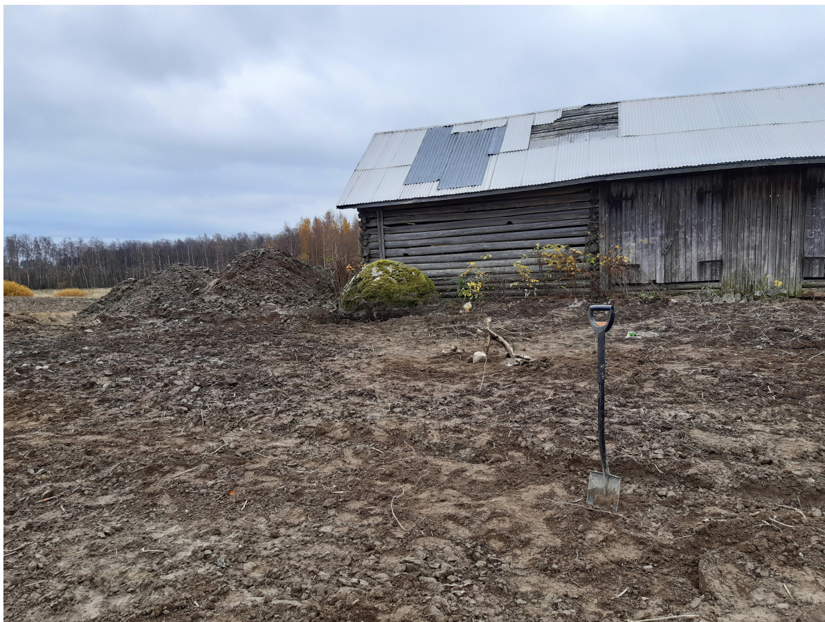
Koekuopan 1 sijaintipaikka on merkitty kuvaan kahden puun ja yhden kiven muodostamalla merkillä. Kuvattu pohjoisesta. 8.10.2021