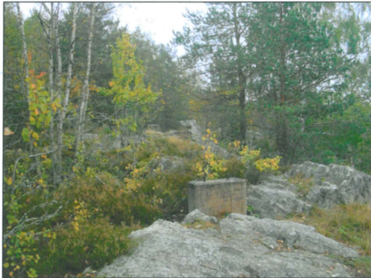
Länsipään kalliomaastoa jossa betonirakennelmien jäänteitä