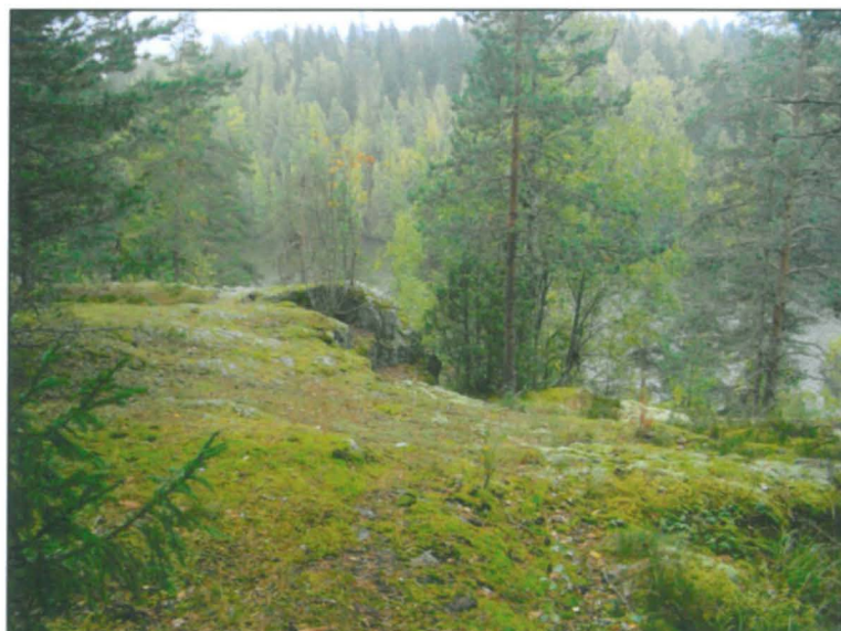
Länsipään kalliorantaa, kallion laella.