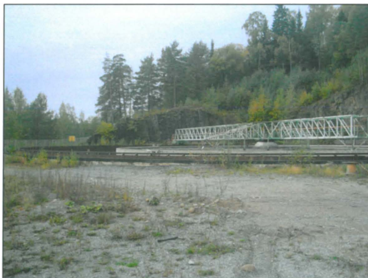
Alueen länsiosaa länteen. Kalliota louhittu pois.