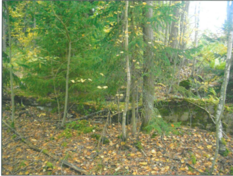
Alueen länsiosan kalliolla havaittu betoninen rakennuksen pohja