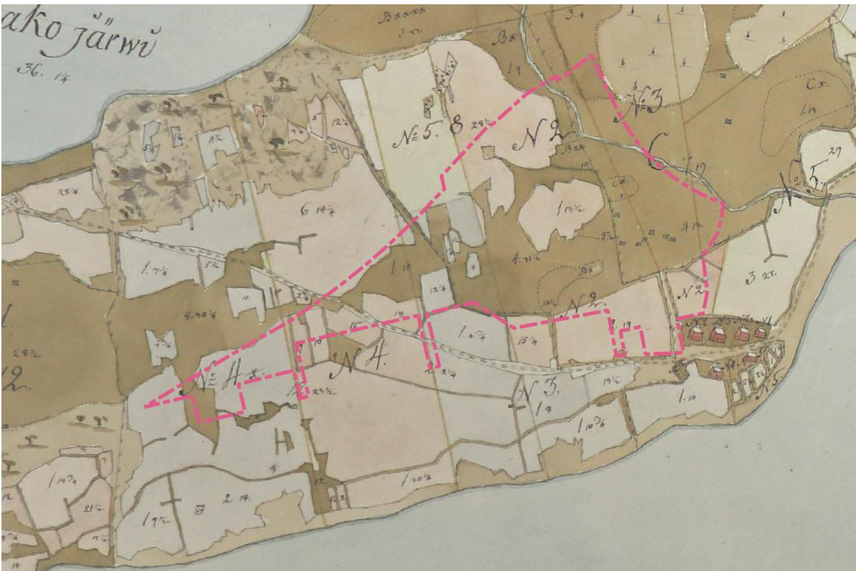
Kartta 2. Hyhkynlaakson asemakaavan muutosalue isojaon kartalla (1767 - 68).