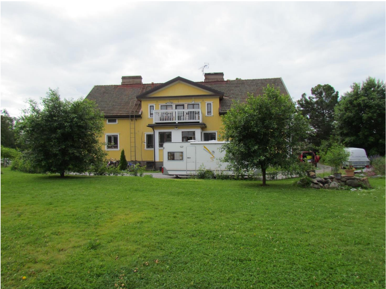
Kuva 1. Simolan talo 26.6.2019.

Kohde sijaitsee Pyhäjärven pohjoisrannalla, rantaa pitkin kulkevan itä-länsi suuntaisen harjanteen korkeimmassa kohdassa, sen itäpäässä, Hyhkynlahden luoteisrannalla Simolankadun varrella. Suurin osa alkuperäistä tonttimaata on nykyään rivitalojen (Simolankadun eteläpuolella) tai Pispän palvelukeskuksen alla. Parhaiten säilynyt muinaisjäätännöksen osa on pääosin Simolan talon tontilla ja pihapiirissä kadun pohjoispuolella (Simolankatu 6), palvelukeskuksen länsipuolella. Harjanteen pohjoispuolella on peltoalue, jolla on maisemallinen yhteys kylätonttiin.