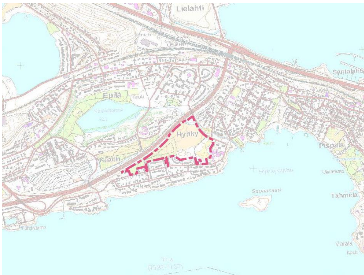
Kartta 1. Inventointialueen sijainti. MK 1 : 20 000.