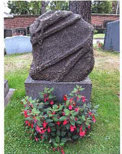
Onnistunut uusi muistomerkki haudalla Airila, 2-4-1.