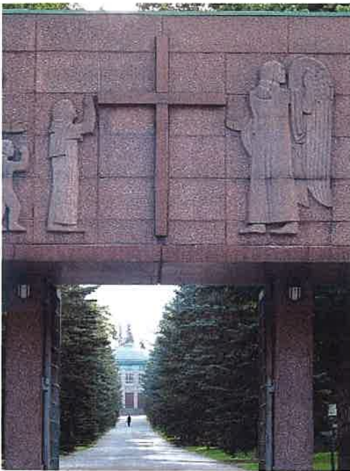
Kappeli pääportilta alkavan pääkäytävän päätteenä.