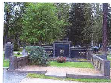
Aidattu hauta, 2-1-19, "pulla-Helin"