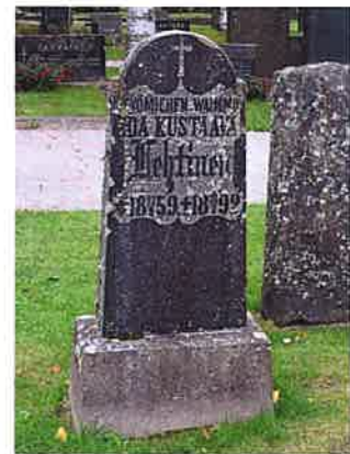
Hauta Lehtinen, 2-3-?, teksti: Työmiehen waimmo.