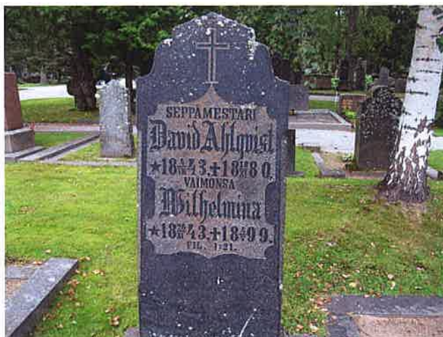
Hauta Ahlqvist 2-1-35, teksti: Seppämestari

Muistomerkeissä voi olla myös jokin raamatun lause tai muu muistolause. Neliössä 2 niitä on henkilöä määrittäviin nimikkeisiin verrattuna kuitenkin huomattavasti vähemmän. Syynä lienee, että etenkin uskonnollisia lausekkeitä käytettiin aiempaa vähemmän 1900-luvulle tultaessa.