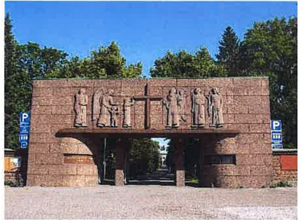
Kalevankankaan hautausmaan pääportti.

Portin suunnittelijan sekä portaalirakennelman julkisivujen materiaalin – hakattu punagraniitti – osalta toteutus noudatti lahjoituksen antajan määräyksiä. Rautabetonirunkoisen rakennelman kokonaisleveys on 14 metriä, korkeudeltaan se on 6,3 metriä. Se koostuu ajoportista, sen molemmin puolin olevista henkilöporteista sekä näiden sivuilla olevista, alun perin varasto- ja vartijanhuoneiksi tarkoitetuista pienehköistä huonetiloista. Portaalin länsifasadissa on kuvanveistäjä Gunnar Finnen suunnittelema reliefi ”Edesmenneiden vaellus enkelien saattamina ristin kirkkautta kohti”. (kuvat 1 ja 2)