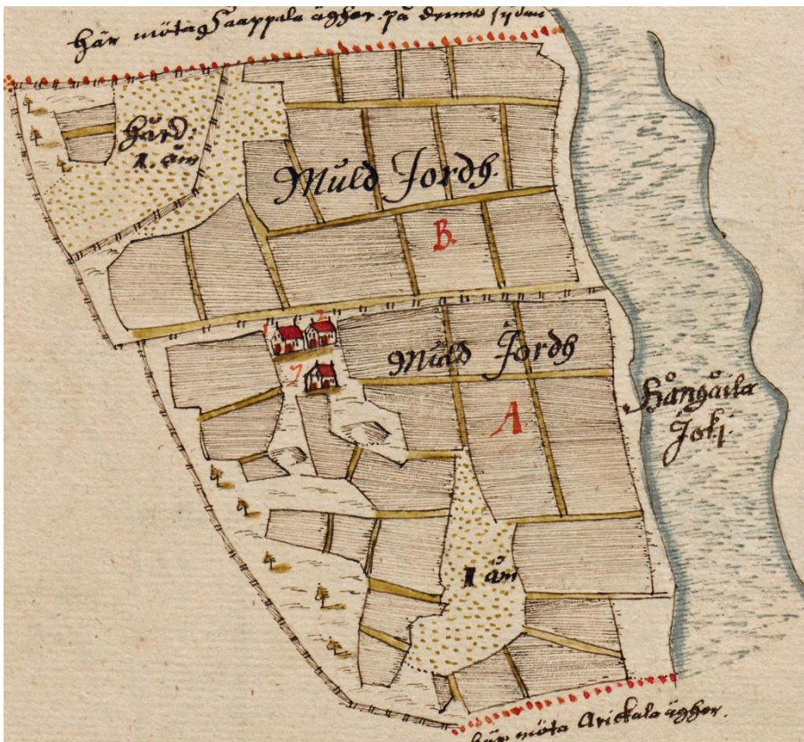
Kartta 5. Honkolan kylä vuoden 1646 maakirjassa.