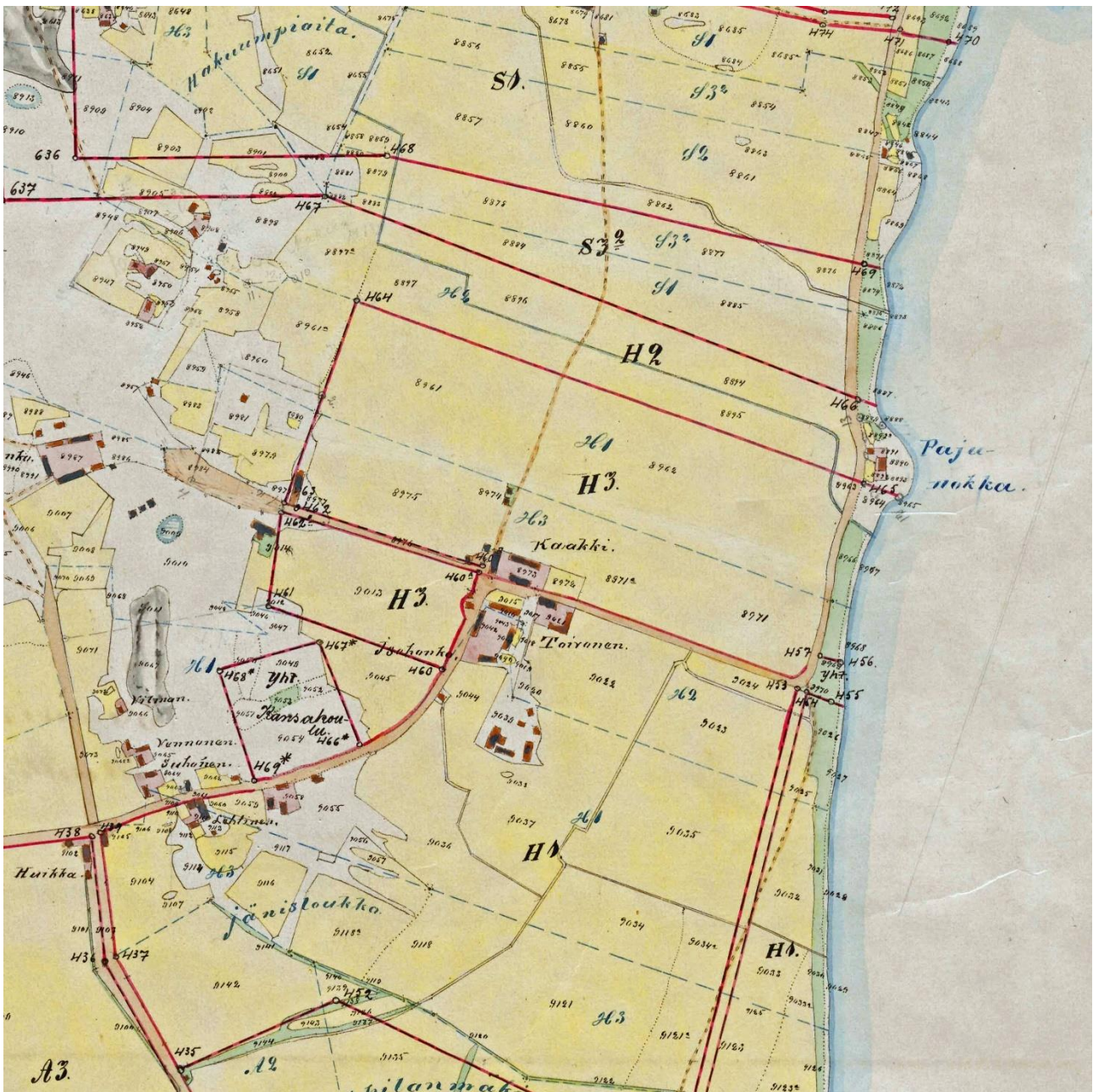
Kartta 7. Honkola vuoden 1906 tiluskartassa.