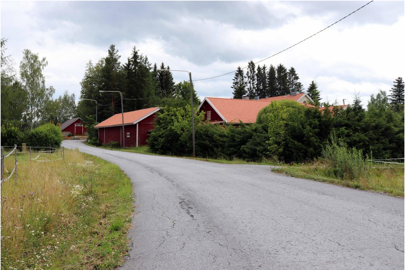
Kuva 2. Iso-Hongon tilakeskuksen paikalla on perinteisiä rakennuksia. Alue on hoidettua pihapiiriä.