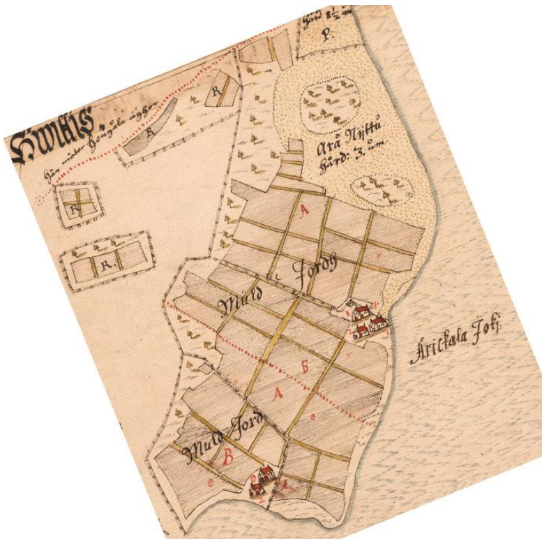
Kartta 3. Vuoden 1646 maakirjakartta.