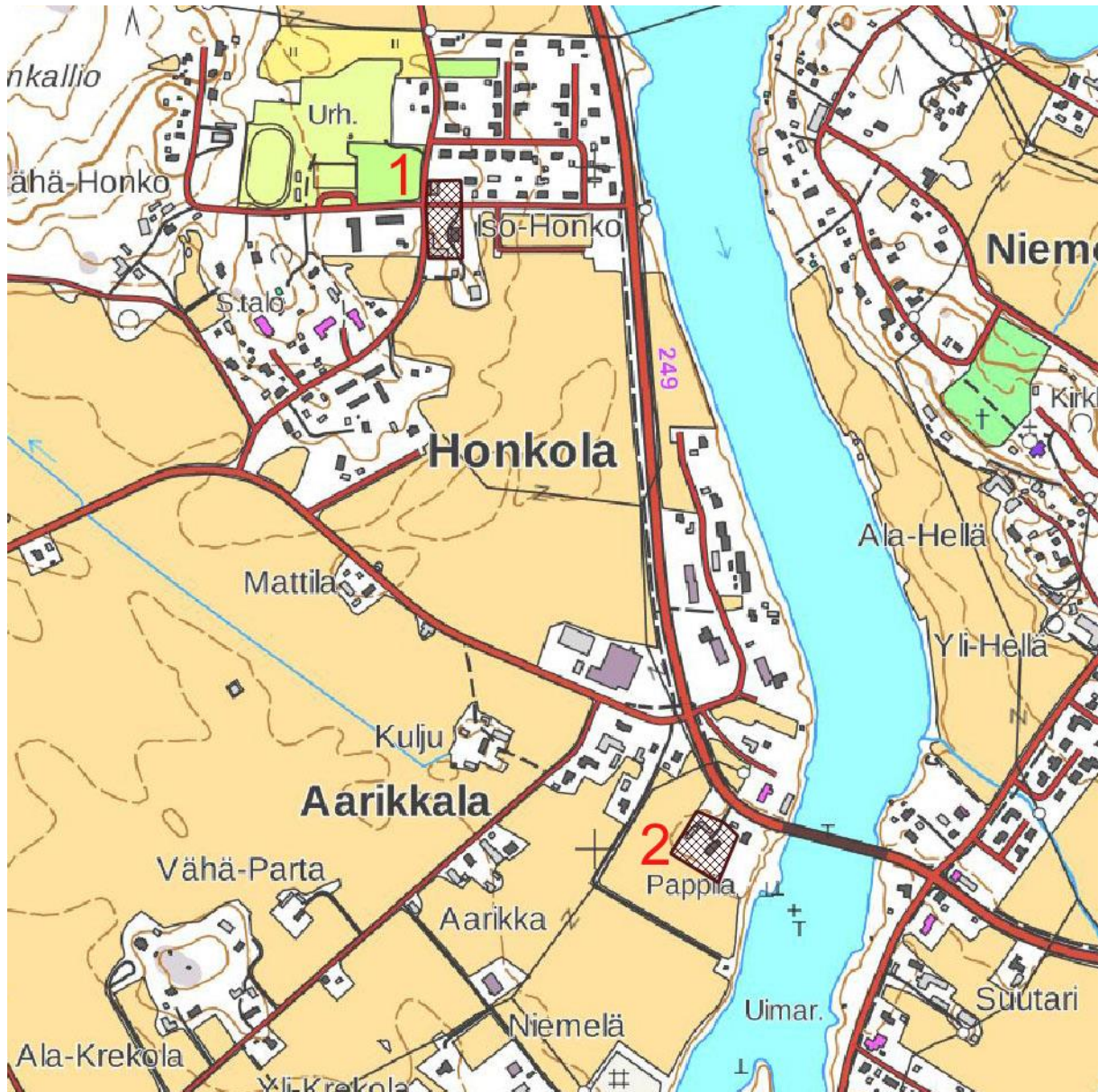
Kartta 2. Kartta kohteiden sijainnista. MK 1 : 10 000.