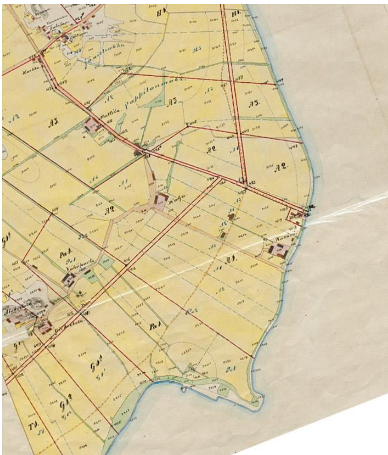
Kartta 4. Vuoden 1906 tiluskartta.