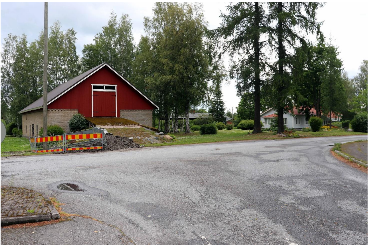
Kuva 3. Honkolantien pohjoispuolella maasto on avoimempaa pihapiiriä.