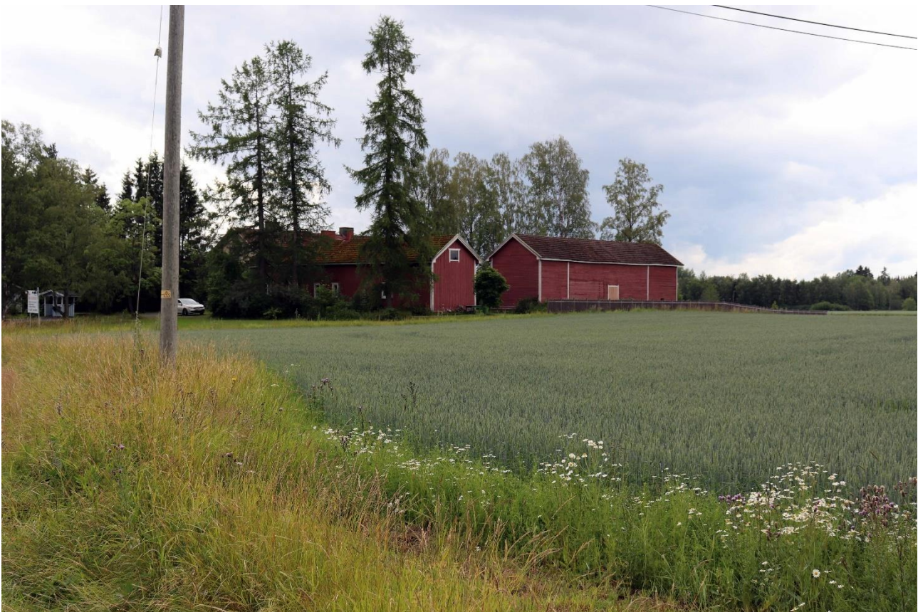
Kuva 1. Aarikkalan kylän tonttimaata sijoittuu Pappila/Käsäri nimisen tilan paikalle. Viljelyksessä olevaa peltoa ei tarkastettu.

Maastotöiden yhteydessä löydetyt kohteet dokumentointiin muistiinpanoin, GPS-laitteella sekä valokuvaamalla. GPS-mittauksiin käytettiin Garmin GPSmap 62s laitetta. Mittausten tarkkuutena avoimessa maastossa voitaneen pitää noin \pm 3-5 metriä. Maastossa kohteiden paikantamisen perusteena oli maaston topografia ja havainnot. Raportointivaiheessa analysoitiin maastotöiden yhteydessä kerätty aineisto sekä laadittiin raportti ja siihen liittyvät kartat. Raportin koordinaatit on ilmoitettu ETRS-TM35FIN - järjestelmän mukaisina. Inventointiin liittyvät digitaalivalokuvat ja raportin alkuperäiskappale on arkistoitu Heiskanen & Luoto Oy:n arkistoon Tampereella.