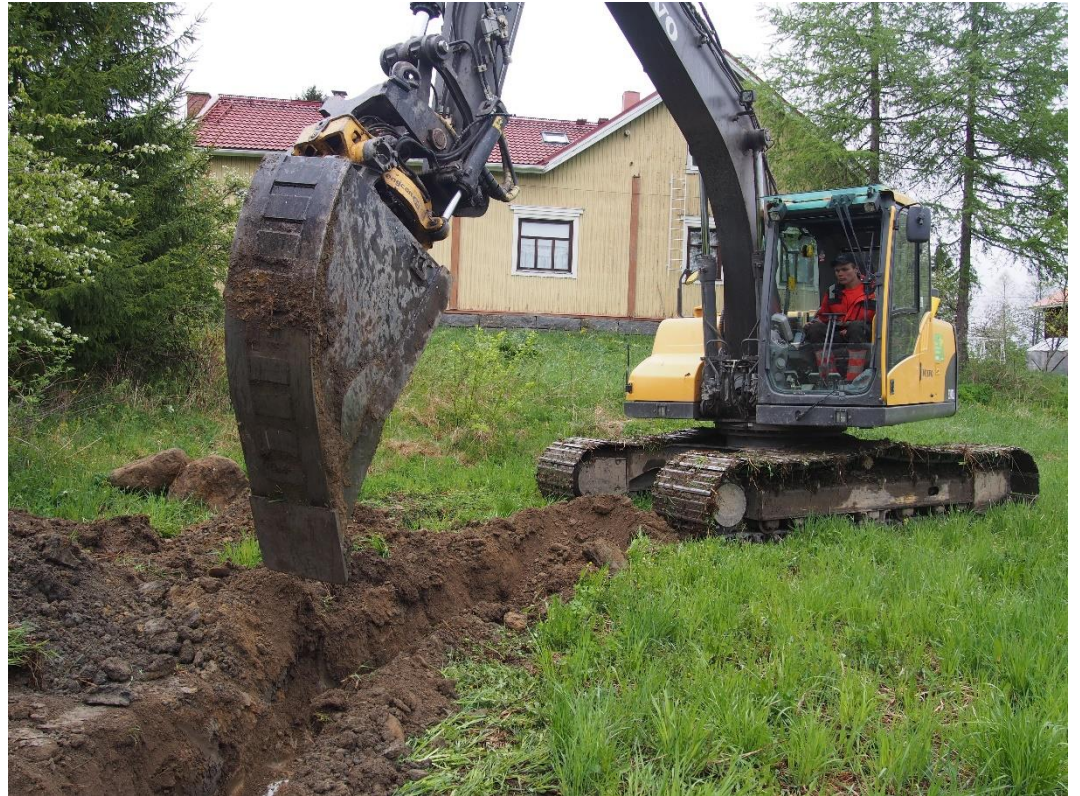
Kuva 2. Saukon talon eteläpuolelle oli aiemmin kaivettu viemärikaivantoja ja maakerrokset olivat pellolla talon kohdalla sekoittuneita.