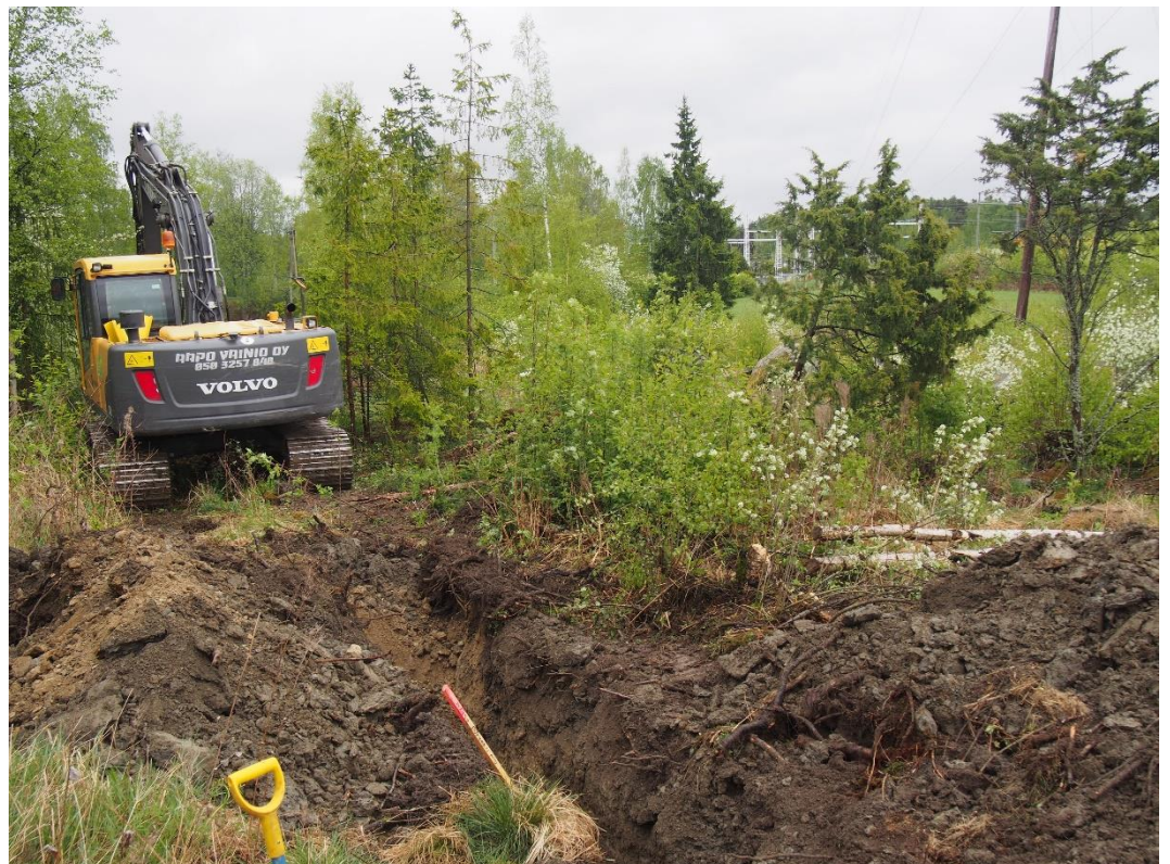
Kuva 1. kaivinkone kaivaa linjausta talojen väliseen umpeenkasvaneeseen notkelmaan.

Valvottava linjasta sijoittui Kaukolan Hohkon talon koillispuolelle asuitujen kohoimien väliseen notkelmaan ja Saukon talon lounaispuoliselle saviselle pellolle. Havaintojen perusteella kaivutyön toteutusta tarvittaessa tarkennettiin, lähinnä käsin kaivaen lastalla tai lapiolla. Havaitut ilmiöt valokuvattiin digitaalikameralla sekä tehtiin kirjallisia muistiinpanoja.