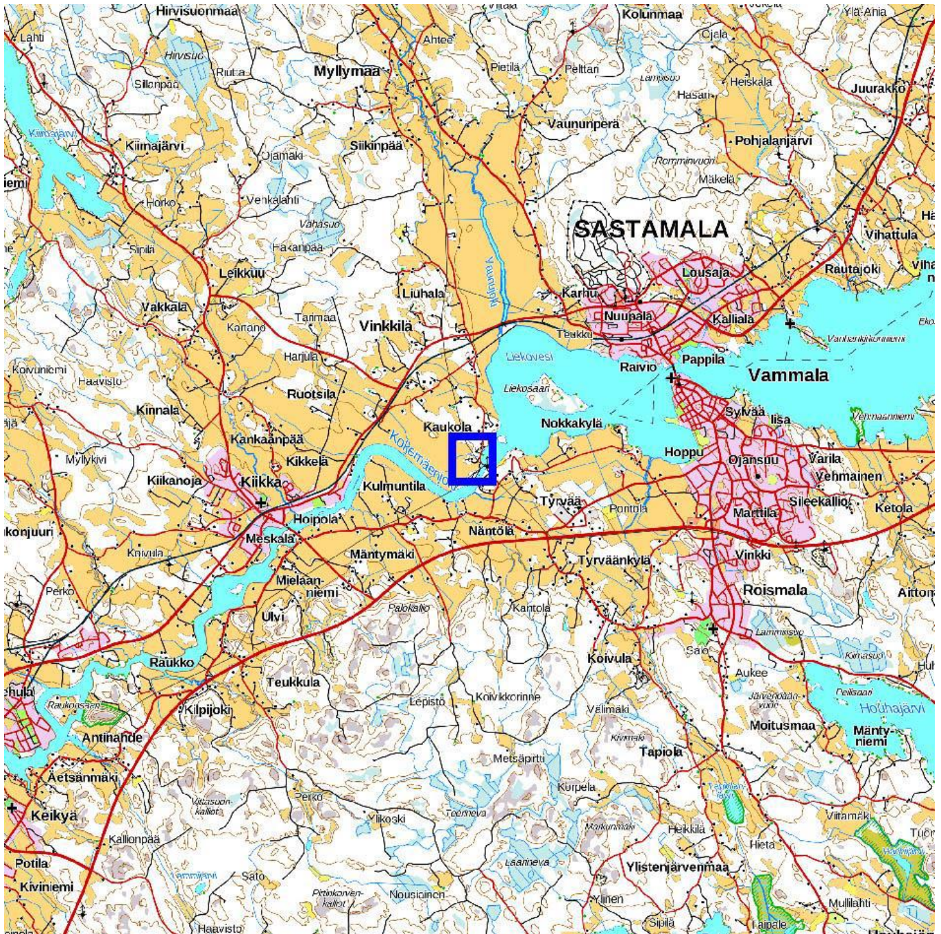
Kartta 1. Valvonta-alueen sijainti. MK 1 : 100 000.