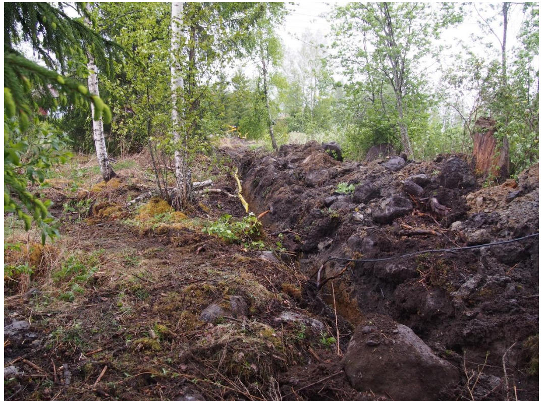
Kuva 3. Saukon ja Hohkon talojen välinen notkelma oli huomattavan kivinen.