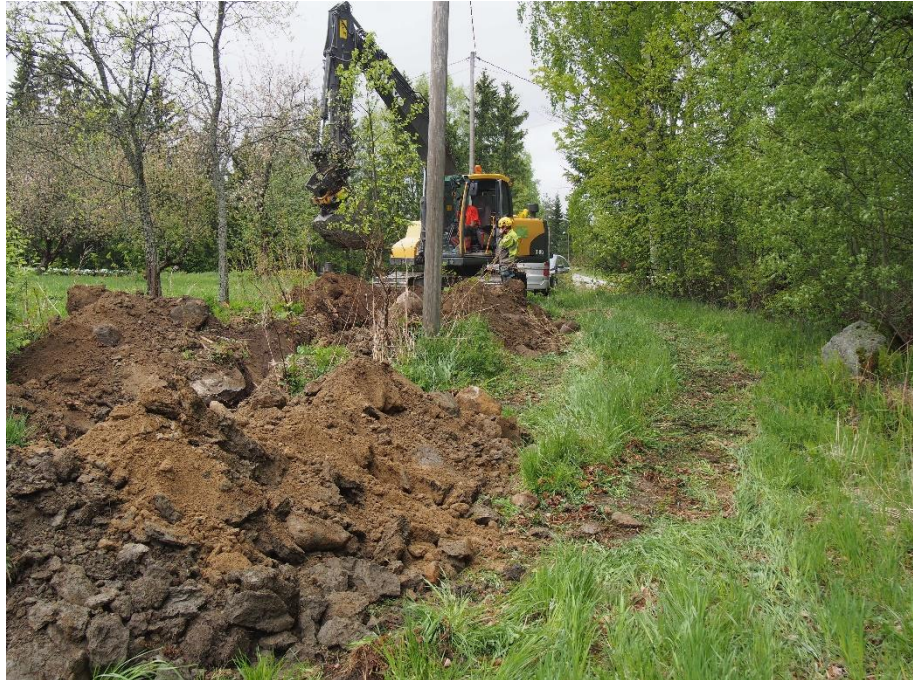
Kuva 4. Saukon talon kaakkoispuolelle pystytettiin uusi pylväs. Paikalla olleet maakerrokset olivat sekoittuneita.