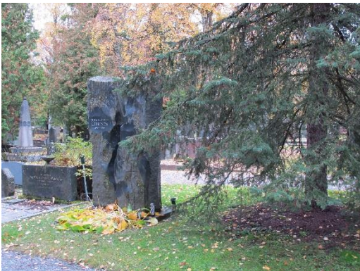
Juice Leskinen muistomerkki pääkäytävän varrella.

Aiemmassa vuoden 1989 tutkimuksessa neliöstä oli inventoitu noin 120 hautapaikkaa. Osassa inventointikortteja ei ollut selkeää merkintää, suositellaanko kohde säilytettäväksi vai ei. Näissä tapauksissa muistomerkit valokuvattiin ja oletettiin, että koska kohde on inventoitu, se myös suositellaan säilytettäväksi.