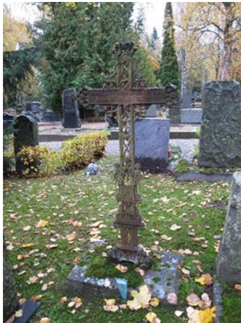
3003-003-008 Tamlander Hautausmaalla erittäin harvinainen rautaristi vuodelta 1881.

Hautausmaan vanhimpaan kerrokseen kuuluu myös Näsijärveen hukkuneiden lasten muistomerkki vuodelta 1881 (3003-007-009). Se on Kalevankankaan hautausmaan vanhin yhteismuistomerkki. Kts. yhteismuistomerkit.