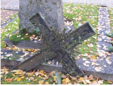
3003-010-009 Canth, takana risti