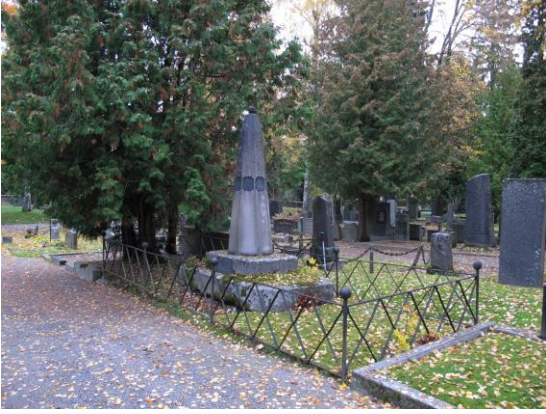
3003-007-009 Näsijärveen hukkuneiden muistomerkki v.1881 kts. Yhteismuistomerkit