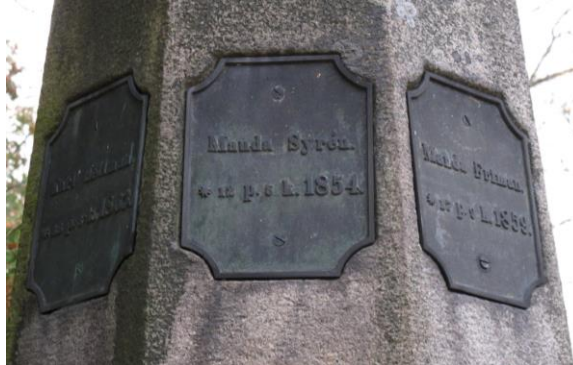
Näsijärven hukkuneiden muistomerkki 1881, Kalevankankaan hautausmaan ensimmäinen yhteismuistomerkki. Neliö 3, rivi 7, paikka 9.