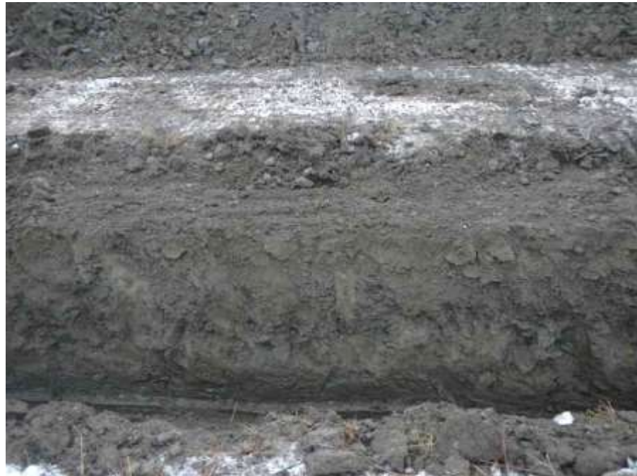
Kuva 12. Esimerkki vesihuoltolinjauksen esillä olleesta eteläprofiilista. Kuvattu pohjoisesta.

Valvottavaksi määritellyn linjauksen korkeimmalla kohdalla, Ruokosen yksinäistalon tontin kohdalla, oli maannos työmaan mestarin mukaan ollut sellainen, että kova moreenimaa oli ollut tällä kohtaa pinnemmassa nyt havainnoidun linjauksenosan maannokseen verrattuna. Kohtaa ei voitu dokumentoinnin yhteydessä havainnoida, sillä se oli jo ehditty täyttää.