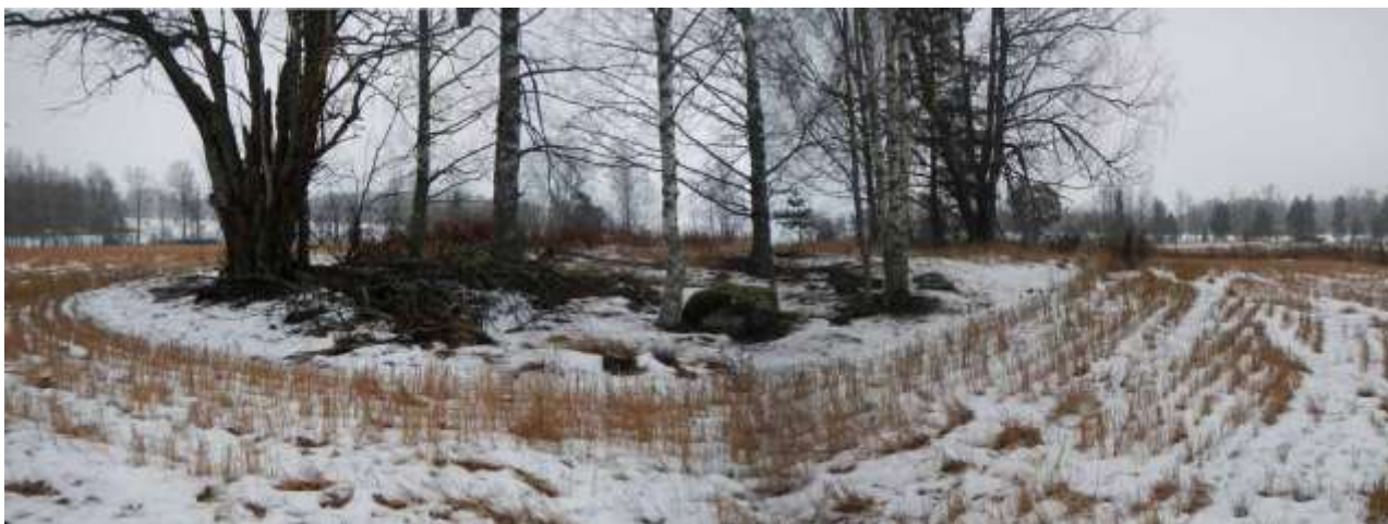
Kuva 9. Ruokosen autoitunutta talonpaikkaa metsäsaarekkeessa. Kuvattu pohjoisesta.

Vuoden 2017 dokumentoinnin yhteydessä havaittiin metsäsaarekkeessa muutamia kiviraunioita sekä hajallaan olevia, halkaisijaltaan 20 – 50 cm olevia kiviä. Näistä ainakin osa todennäköisesti peräisin alueella sijainneiden rakennusten perustuksista tai uuneista. Tarkastuksen perusteella metsäsaarekettä on pidettävä potentiaalisimpana Ruokosen yksinäistalon sijaintipaikkana.