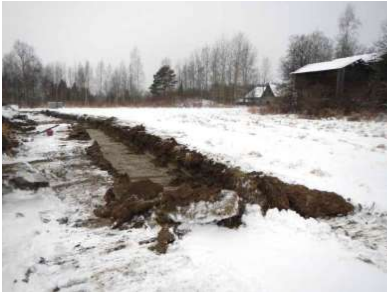
Kuva 3. Historiallinen asuinpaikka Hirviniemi Keso III kuvan taustalla olevassa metsikössä. Kuvattu idästä.