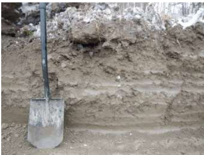
Kuva 6. Tyypillinen maannos vesihuoltolinjalla: 30 cm paksun peltokerroksen alla on hie-susavea, joka syvemmälle mentäessä muuttuu saveksi. (Kuva: Tampere Hirviniemi 2017:5)

Vesihuoltolinjauksen kaivuuta edeltäneessä silmämääräisessä havainnoinnissa ei havaittu maanpäällisiä merkkejä kiinteästä muinaisjäännöksestä. Valvottu vesihuoltolinjaus kulki pelolla historiallisen kylänpaikan Hirviniemi Keso III ja kivikautisen asuinpaikan Keso I – II välistä. Routaa esiintyi vain peltokerroksen yläosassa, paksuudeltaan noin 5 – 10 cm olevana kerroksena. Valvottu kaivannonosa oli löydötön ja vailla arkeologisesti mielenkiintoisia anomalioita. Kaivannon maannos oli noin 30 cm paksun peltokerroksen (savimultaa) alla puhdasta hie-susavea ja syvemmällä savea. Maannos oli samanlainen kautta koko valvotun linjauksenosan.