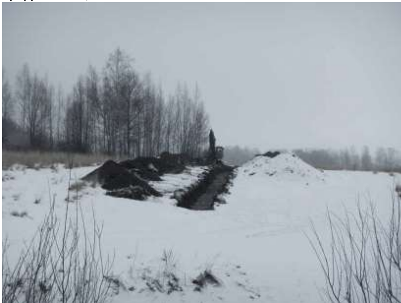
Kuva 4. Valvonnassa kaivetun vesihuoltolinjauksen sijaintia alueen länsipäässä. Kuvassa linjauksen oikealla puolella näkyvät ja lumen peittämät maakasat ovat paikalle muualta tuotua maata. Kuvattu lounaasta.

Työn aluksi valvottavaksi määrätty linjanosa käytiin läpi maastossa. Kaivettavan linjauksen viereen oli tuotu maata muualta. Maa oli suurina kasoina kaivettavan linjauksen vieressä. Kaivutyö eteni arkeologin valvonnassa aina luonnolliseen pohjamaahan (savi) saakka sekä tästä tasta hieman alaspäin. Loppusyvyyteensä (noin 2 m) linjaus kaivettiin urakoitsijan toimesta sen jälkeen omaan tahtiin. Valvotun vesihuoltolinjan leveys oli pääsääntöisesti noin 1,5 m ja syvyys noin 0,7 m.