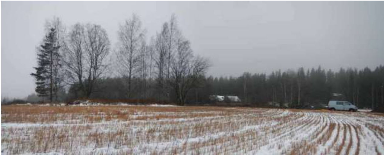
Kuva 8. Historiallinen asuinpaikka Hirviniemi Ruokonen kuvattuna etelästä.

Ruokosen autoitunut talonpaikka sijaitsee Aitoniementien eteläpuolella noin 750 m lounaaseen Aitolahden vanhalta kirkolta. Nykyiset Ruokosen tilan rakennukset sijaitsevat Aitoniementien pohjoispuolella samalla kohdalla. Talonpaikka sijoittuu noin 40 metriä pohjoisosastaan ja 65 metriä eteläosastaan Aitoniementieltä pääosin nykyisin viljellyn pellon ja peltoaarekkeen kohdalle.