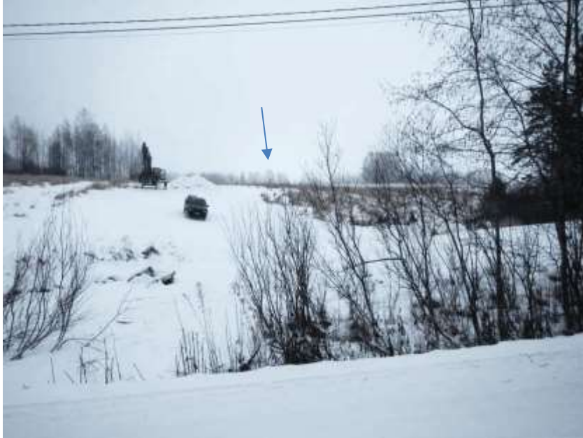
Kuva 2. Kivikautisen asuinpaikan Keso I – II läntisempi osa-alue sijaitsee kaivetun vesihuolto-linjan eteläpuolella, kuvassa olevan nuolen osoittamassa kohdassa. Kuvattu lounaasta.

ketta oleva kivikirves (KM 13929). Rätty löysi kohteesta kvartsi-iskoksia, ydinkappaleita ja kivi-esineen teelmiä (KM18824:1-6). Vuosien 1999 (Nurminen) ja 2007 (Salminen) inventoinneissa ei tehty kohdetta koskevia uusia havaintoja.