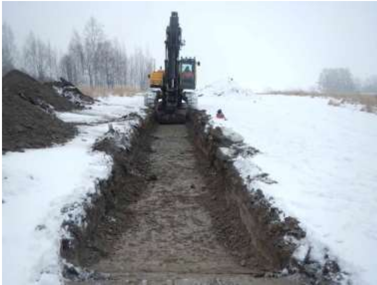
Kuva 5. Kaivinkone kaivamassa vesihuoltolinjaa sen länsipäässä. Kuvattu lounaasta.

käytännössä tähän ei ollut tarvetta. Valvontaan liittyvät jälkityöt tehtiin helmikuussa 2017. Kartat piirrettiin puhtaaksi käyttäen MapInfo-paikkatieto-ohjelmistoa ja digitaalikuvat arkistoiitiin Kulttuuriympäristöpalvelut Heiskanen & Luoto Oy:n arkistoon Tampereella. Valvonnan yhteydessä ei saatu Kansallismuseon kokoelmiin luetteloitavia löytöjä.