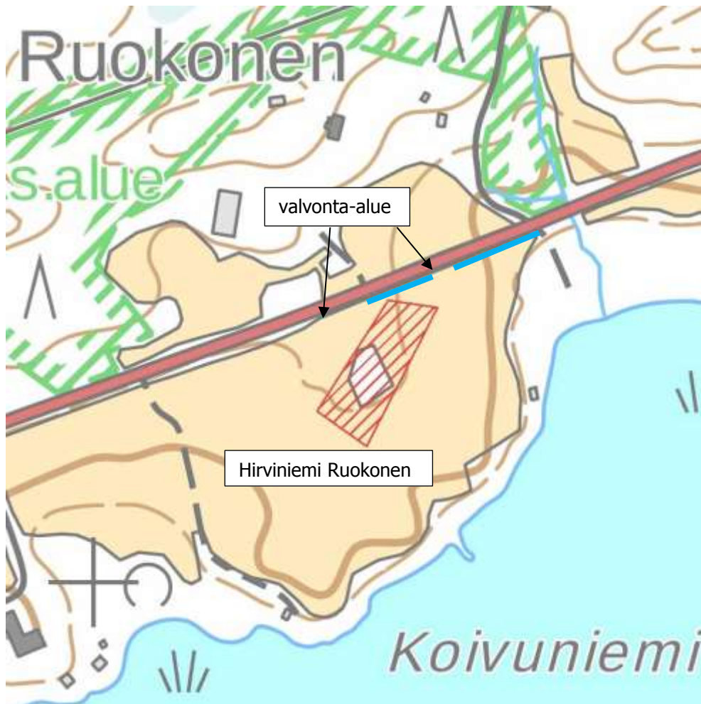
Kuva 13. Sinisellä viivalla merkitty se vesihuoltolinjaosa, joka dokumentointihetkellä oli vielä täyttämättä ja siis havainnoitavissa. Pirkanmaan maakuntamuseon valvottavaksi määrittelemän linjanosan ääripäät merkitty nuolilla. Nuolien väliin jäävä linjaosa oli siis määritelty valvottavaksi. Pohjakartta © Maanmittauslaitos 02/2017, ei mittakaavassa, kiinteä muinaisjäännös muinaisjäännösrekisterin tietojen pohjalta 02/2017.