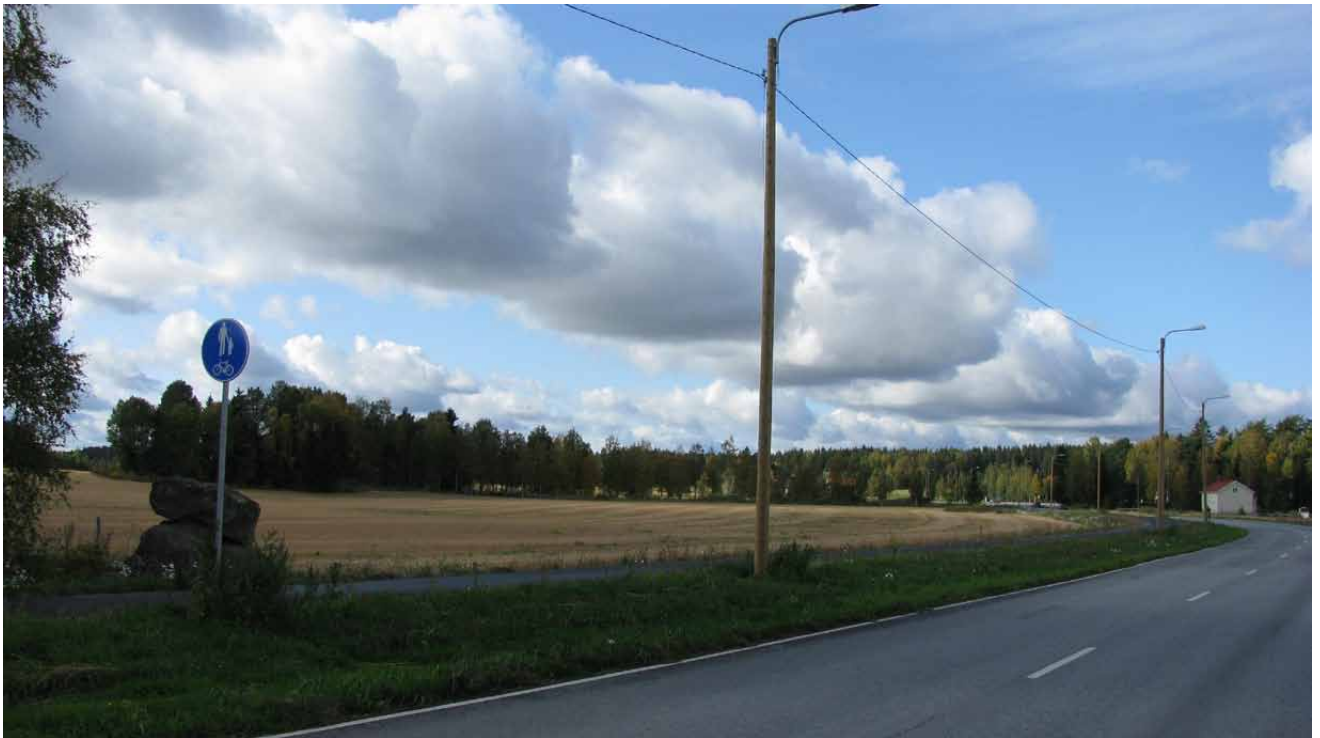
Kuvassa näkymä Anian rantatieltä. Vasemmalla näkyvä kivi on mielenkiintoinen maiseman yksityiskohta.

Maaperältään korkeammat kohdat ovat kalliomaata ja moreenia, alavammat alueet ovat savea tai hie-