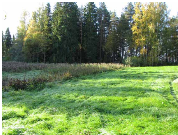
Reipin läntisintä peltoa.

Rahoitusmahdollisuus: Peltotukikelpoisuuden ulkopuolella olevat entiset pellot voivat saada luonnon ja maiseman monimuotoisuuden edistämisen tukea, mikäli niiden kasvillisuus on kehittynyt niittymäiseksi monilajiseksi ja/tai ne sijaitsevat aivan erityisen näkyvällä maisemallisesti tärkeällä paikalla. Sama tuki sopii saarekkeiden ja reunavyöhykkeiden raivaukseen ym. hoitoon.