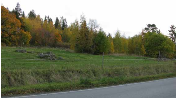
Kuvassa viehättävä hevoslaidunalue Paravuoren lounaispuolella Anian rantien varressa.

Rahoitusmahdollisuus: Maatalouden ympäristötuen erityistuki luonnon ja maiseman monimuotoisuuden edistämiseen (saarekkeiden ja reunavyöhykkeiden hoito).