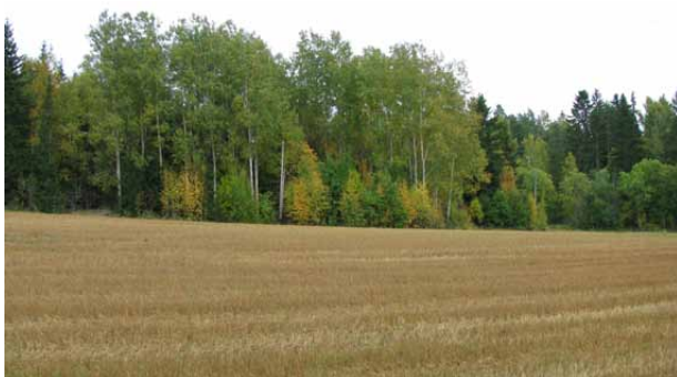
Ylhäällä pikkusaareke Kranaatinmäentien varressa, alhaalla monipuolista reunavyöhykettä Anian rantatien varressa.