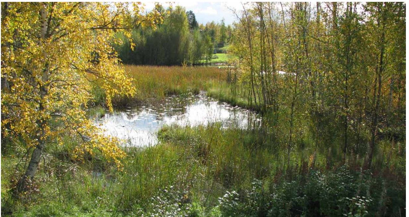
Kuvassa vesistönäkymää Sikosillalta pohjoiseen.

Suositus: Valkilan kallion merkitystä näköalapaikana olisi hyvä tuoda esille. Alue voisi olla myös mahdollinen lampaiden laidunalue. Pirkkalankylän kalliota tulisi hoitaa perinnebiotooppina, mutta myös alueen maisemamerkitys tulisi hoidossa huomioida.