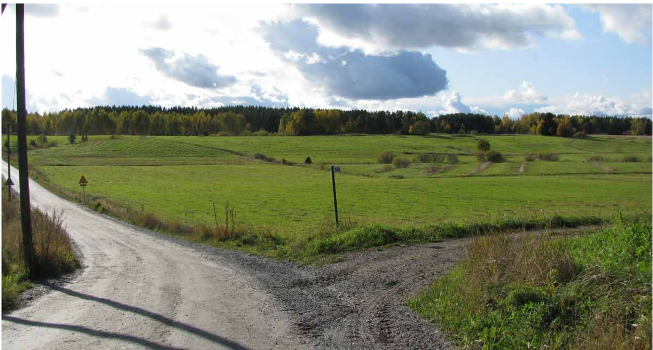
Kuvassa avara peltoaukea Paunintien varrella.

Suositus: Avoimet peltomaisemanäkymät pyritään säilyttämään pitämällä pellot viljelyksessä, laidunnuksessa tai niittämällä niitä säännöllisesti.