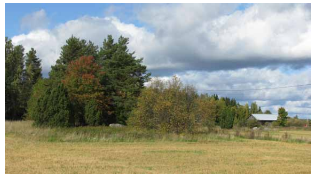
Kuvassa Hevossuon saarekkeita.

Rahoitusmahdollisuus: Maatalouden ympäristötuen erityistuki luonnon ja maiseman monimuotoisuuden edistämiseen (saarekkeiden ja reunavyöhykkeiden hoito).