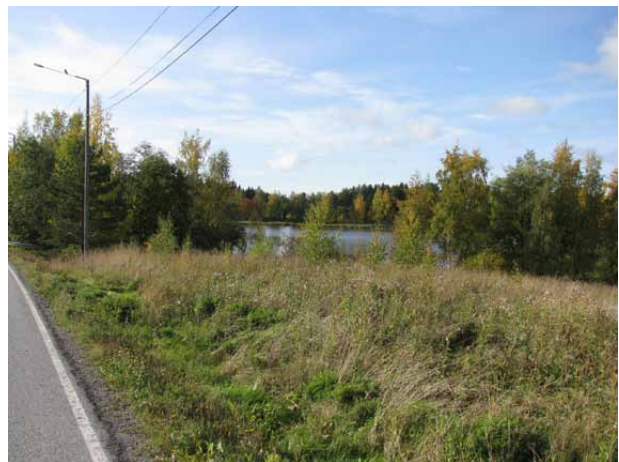
Näkymiä Anian rantatieltä: ylhäällä Kesämälahti, alhaalla Kotolahti.