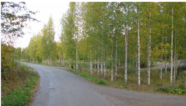
Esimerkkejä reuna-alueiden hoidosta: Hoitamaton reuna (yllä), niitetty reuna (keskellä), koivulle istutettu reuna (alla).

muotoisuutta lisää, jos tontilla on myös vähemmän hoidettuja kohtia, mm. nokkonen tarjoaa ravintoa monille perhosille.