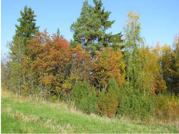
Suojeltu kataja Kotolahden rannassa.