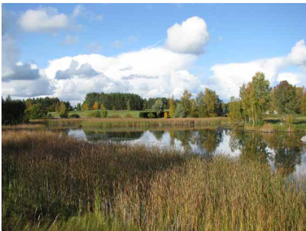
Ylhäällä Sikojoen rantaniittyä Sikosillan pohjoispuolelta, alhaalla näkymä Sikosillalta.