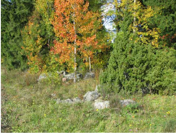
Toosin haan reunaa.