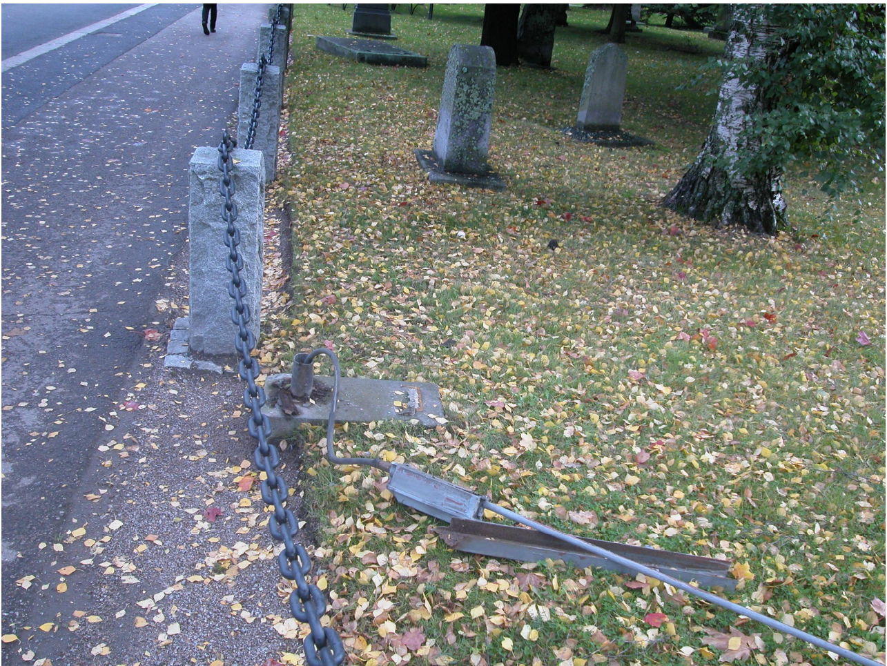
Poistetun valaisinpylvään jäännös Pirkankadun laidalla.