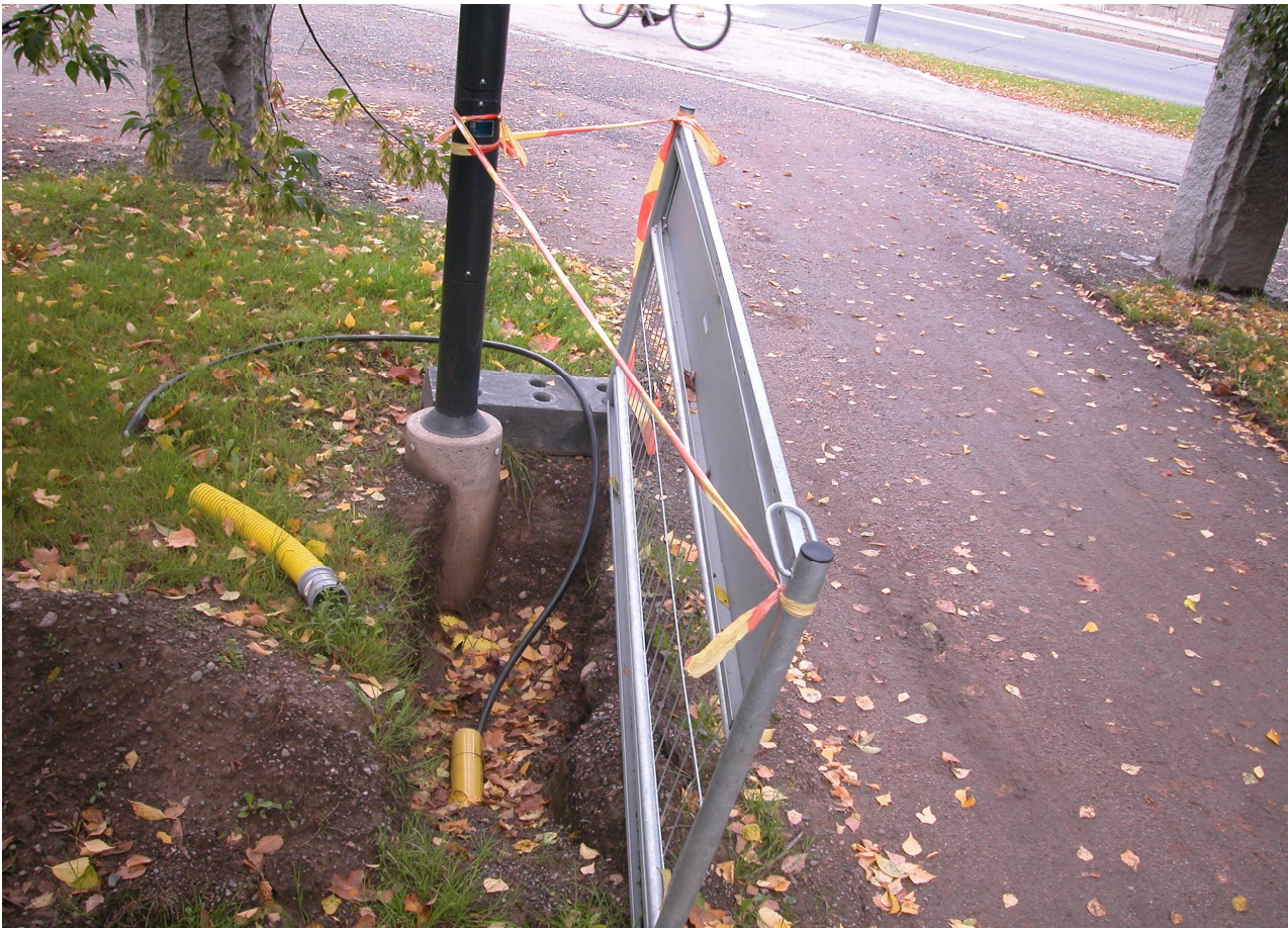
Kaapelikaivanto hautausmaan luoteiskulmassa. Taustalla Pirkankatu.

Maankäytöstä, jonka voisi olettaa ulottuneen muutamaa kymmentä senttimetriä syvemmälle, ei ollut viitteitä – pois lukien ehkä Suru-veistos, jonka perustussyvyyttä ei osattu arvioida.