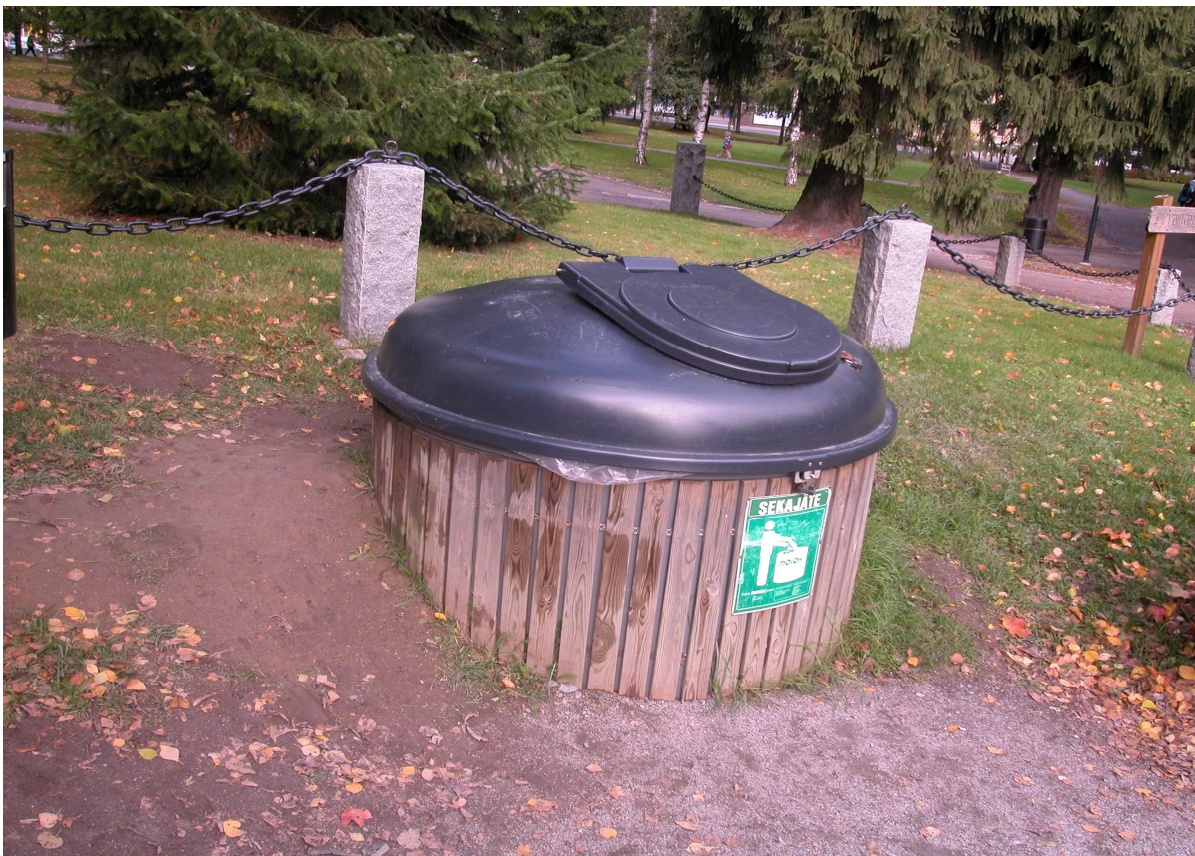
Hautausmaan etelälaitaa: kevyen liikenteen väylälle laskeutuva törmä ja törmän itäpäähän kaivettu sekajätekuilu.