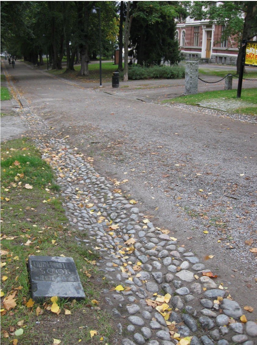
Hautakivi puistokäytävän välittömässä tuntumassa hautausmaan kaakkoisosassa.