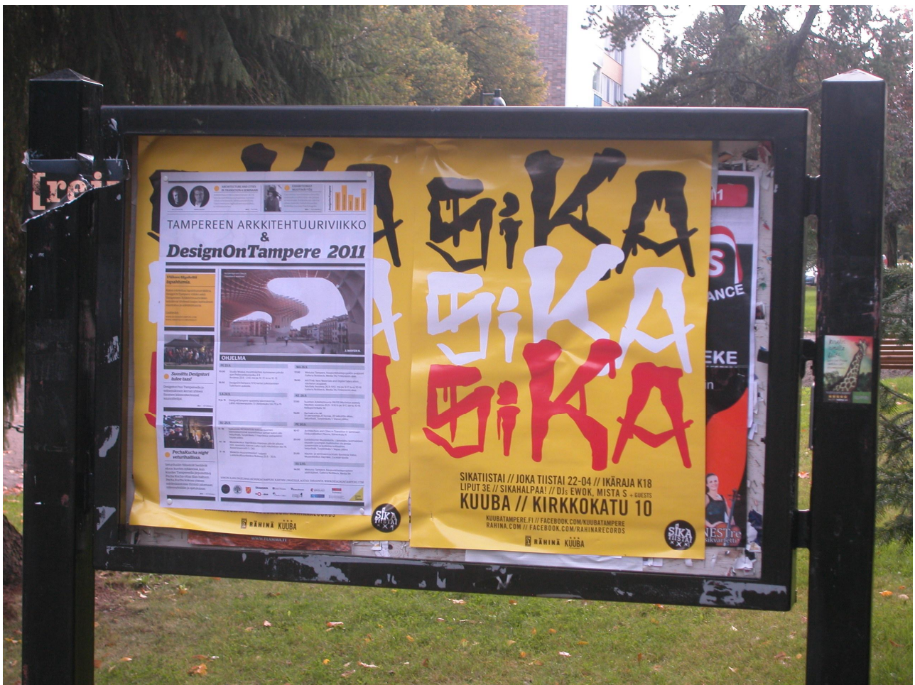
Hautausmaan ilmoitustaulu 20. 9. 2011.

Hautausmaan kaakkoisnurkassa sijaitseva ilmoitustaulu oli pääasiassa tamperelaisten ravintoloiden maksuttomassa mainoskäytössä. Inventoinnin aikana eräs ravintola mainosti näkyvästi "Sikatiistai"-nimistä tapahtumaa. Räikeiden ja huomiota herättävien mainosjulisteiden soveltuvuudesta hautausmaalle ja muinaisjäänösalueelle voidaan keskustella.