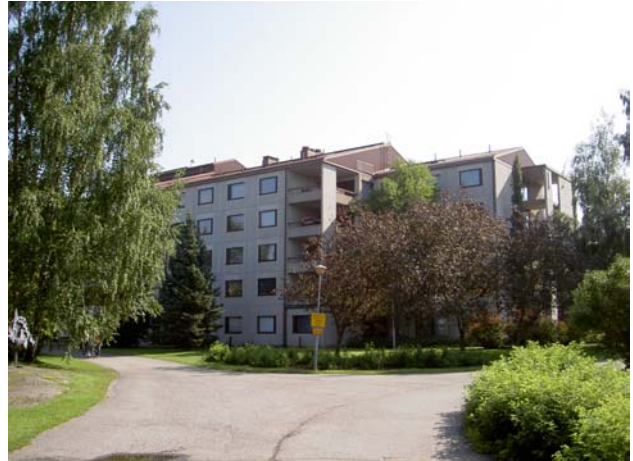
Lehtelä lännestä Niksulan suunnasta