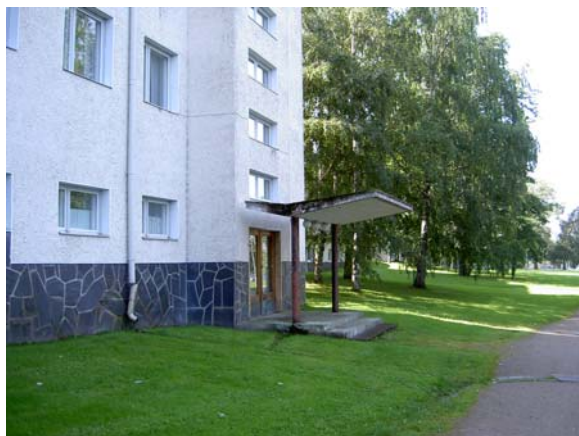
Jukolan ovikatos järven puolella.