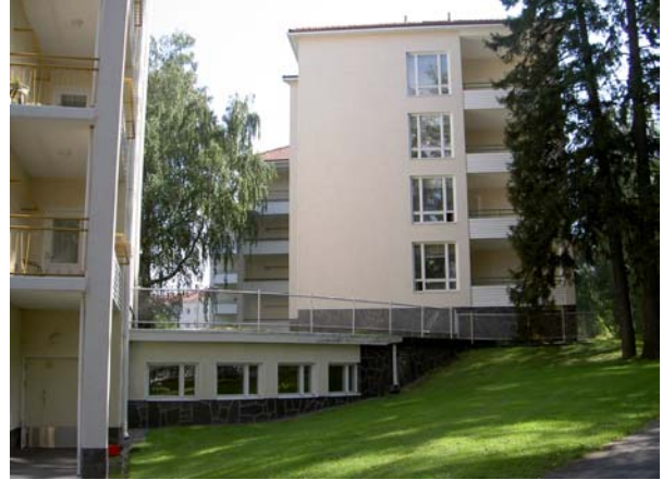
Varpulan pääty ja tunnelia järven puolelta.