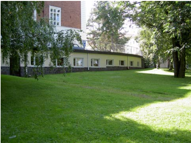
Tunnelia ja verkkoaitaa hallintorakennuksen takana. Tunnelin näkyvät julkisivut on käsitelty kuten hoitorakennustenkin.

rapattu ravintokeskus (Pekka Ilveskoski 1976, 1984) on hoitorakennuksista poiketen matala ja osin satula- osin tasakattoinen. Ikkunajako on säännöllinen ja puitejako 1950-luvulle tyypillisesti epäsymmetrinen.