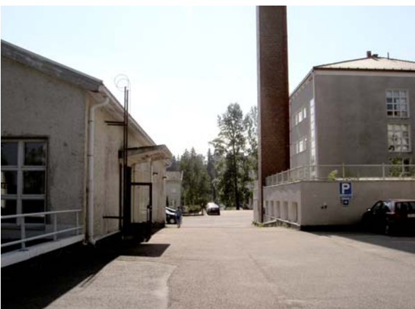
Ravintokeskus vasemmalla, lämpökeskus piippuineen oikealla. Takana sairaala.

Hoitorakennus Iltalan päädyssä lähellä hallintorakennusta sijaitseva juhlatalo on tasakattoinen, yksikerroksinen ja melko vapaamuotoinen, sisäänkäynti on pihan puolelta ja maisema suuntautuu järvelle.