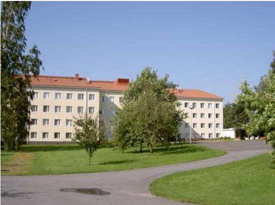
Iltala korttelipihan puolelta.

ovat päädyissä. Julkisivuissa on karkea roiskerappaus, liuskekivisokkeli ja säännöllinen ikkunajako, tammiset, lakatut lasiovet sekä ylöspäin suuntautuvat tai taitetut ovikatokset.