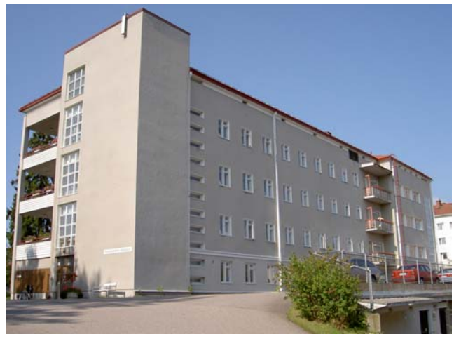
Sairaala huoltopihan puolelta.

Sairaala Bertel Strömmer 1935. Funkis-henkinen lisäys Jaakko Ilveskoski 1956. Nelikerroksisessa, suorakaiteen muotoisessa rapatussa massassa on pieni L-uloke koillisnurkassa. Pohjakerros on erotettu kerroslistalla jalustaksi, jonka pitäisi olla seinäpintaa tummempi. Loiva aumakatto lienee alun perin ollut peltikatto. Ikkunajako on säännöllinen. pihan puolella ikkunat kolmiosaiset ja järven puolella kaksiosaiset, joka