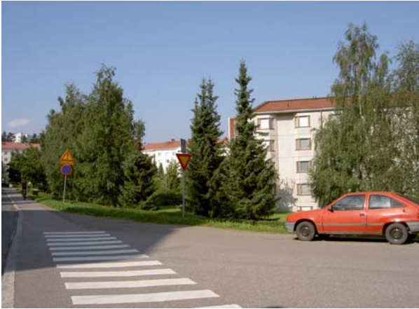
Lähestyminen idästä. Oikealla Koivula. Taustalla näkyy vähän Havulaa.