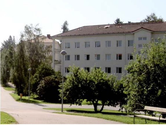
Varpula pihan puolelta