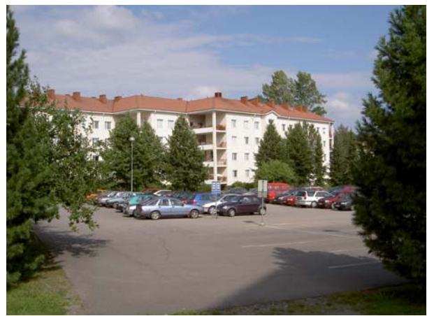
Korttelin reuna näkyy paikoin aukean ylitse. Paikoitusalue on entistä peltoa.

Tärkeä länsiosan solmukohta on puukujan alkupään lisäksi loppupää, josta avautuu näkymä korttelipihaan. Vuosina 1954-61 rakennetut muodostava vanhempien rakennusten kanssa laajan, ilmeeltään varsin yhtenäisen kehän, jota ainoa materiaaliltaan poikkeava ja kehältä sisään päin työntyvä hallintorakennus dominoi korkealla akselin päätteellä.