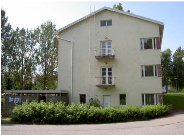
Niksulan itäpääty. Piha on aidattu huoltotiestä pensasaidalla.

ikkunan yhdessä osassa on pieni tuuletusikkuna. Yleisissä tiloissa on suuria ruutuikkunoita sekä vaakasuuntaisia, pieniä ikkunoita. Vanhat parvekekaiteet ovat vaakasuuntaista teräsputkea, uudemmat umpinaiset kuten hoitorakennuksissa.