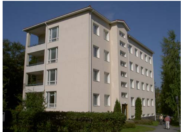
Urpula puukujan alkupäästä Rauhaniementieltä