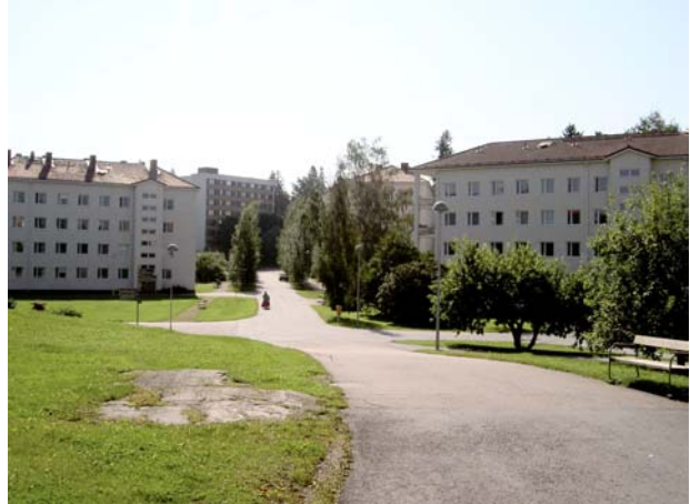
Näkymä kalliokumpareelta etelään, tulosuuntaan.

Vihersuunnitelmissa on pyritty viihtyisyyteen varsinkin lähimaisemassa; pensaat ja matalat kasvit sijaitsevat enimmäkseen rakennusten seinustoilla, ja pihan keskialueella on nurmikentän lisäksi muutamia, hyvin korkeita pihtakuusia ja korkeimmalla kohdalla pieni männikkö. Kioskin vaiheilla on oleskelupaikkoja penkkeineen ja keinuineen ja niiden lähellä suojakasvillisuutta. Asfaltoitujen kulkuväylien varrella on muuten lähinnä yksittäisiä puupenkkejä. Näkö- ja kulkuyhteyksiä pihalta järven suuntaan on rakennusten väleistä, jossa rantapuusto usein peittää näkymät. Rantapuustoa tulisikin paikoin harventaa.