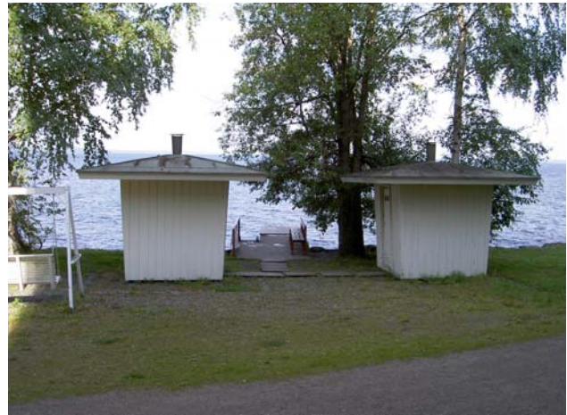
Puiset uimakopit ja laituri alueen länsiosan rannassa.