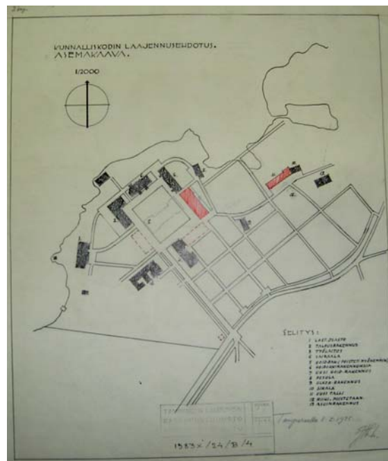
Asemapiirros 1935, Jaakko Laaksovirta

Ehdotuksesta toteutui punaisella värillä piirretty nykyinen Rauhaniemen sairaala 1936, silloinen hoidokkirakennus, ja lahdenpoukaman yli oikaiseva betoninen silta sekä itäpuolella sijaitseva sikalan laajennus. Korttelin keskelle purettavaksi merkitty vanha päärakennus jäi paikoilleen 1960-luvulle asti, jolloin ympäristö oli jo täysin erilainen.