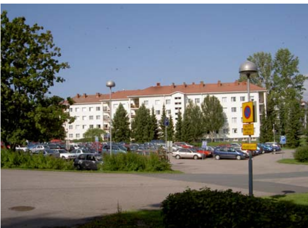
Havula Rauhaniementieltä läheltä huoltotien päätä.