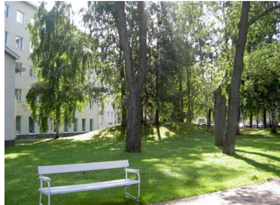
Iltala rannan puolelta.