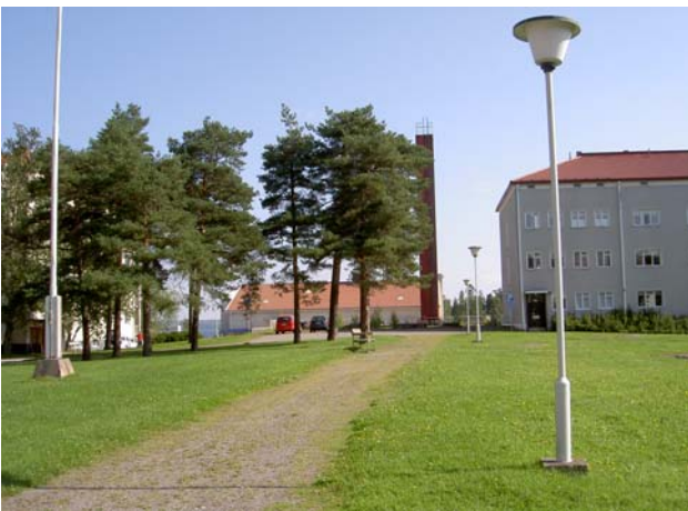
Järvi pilkottaa ravintokeskuksen päädystä.

Vihersuunnitelmissa on pyritty viihtyisyyteen varsinkin lähimaisemassa; pensaat ja matalat kasvit sijaitsevat enimmäkseen rakennusten seinustoilla, ja pihan keskialueella on nurmikentän lisäksi muutamia, hyvin korkeita pihtakuusia ja korkeimmalla kohdalla pieni männikkö. Kioskin vaiheilla on oleskelupaikkoja penkkeineen ja keinuineen ja niiden lähellä suojakasvillisuutta. Asfaltoitujen kulkuväylien varrella on muuten lähinnä yksittäisiä puupenkkejä. Näkö- ja kulkuyhteyksiä pihalta järven suuntaan on rakennusten väleistä, jossa rantapuusto usein peittää näkymät. Rantapuustoa tulisikin paikoin harventaa.