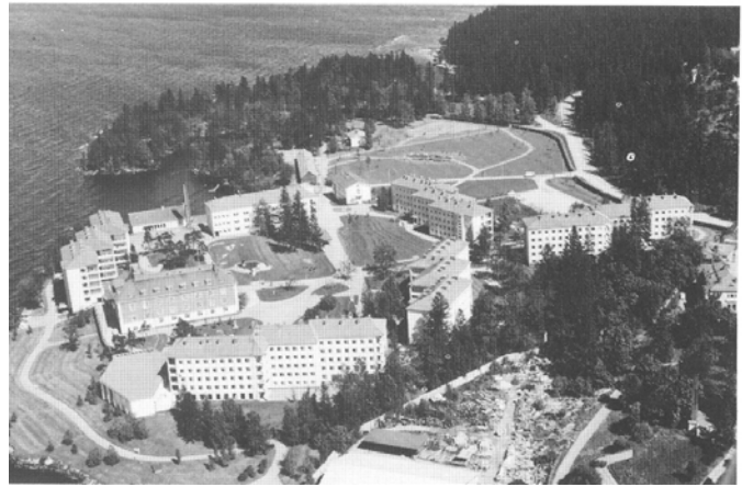
Ilmakuva lännestä 1967. Pihan keskellä olevaa puustoa on jo karsittu.

Suorakulmaisesta koordinaatistosta oli luovuttu. Uudet, porrastetut, pitkät rakennusmassat myötäilivät maaston muotoja metsäkaupunki-ihanteen mukaisesti, mikä oli 1950-luvun alulle tyypillistä. Funktionalismin perintönä tulleet valoisuuden ja väljyyden vaatimukset näkyivät pihan avarina nurmikenttinä Tapiolan tapaan. Asuinrakennuksia muistuttavia hoitorakennuksia tehtiin useita laitospäätymisen välttämiseksi. Rakennukset ja rannasta päin katsottuna näkyvissä kulkeva tunneli muodostivat nyt suurkorttelipihan, joka rajautui selkeästi varsinkin järveltä päin; pihalta näki järvelle vain paikoin rakennusten välistä.