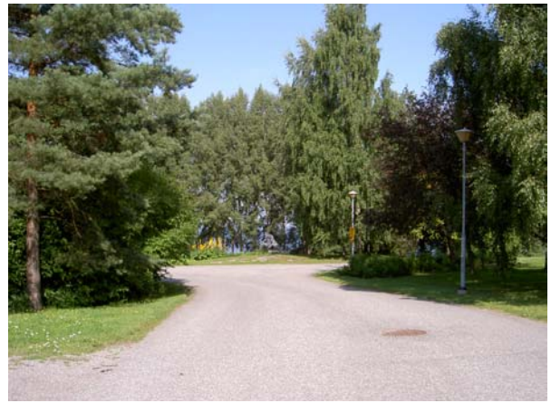
Huoltotien pohjoispäässä on veistos, mutta mahdollisuus järvinäkymään on jätetty hyödyntämättä.

Voimassa oleva asemakaava on vahvistettu 1989, ja siinä aluetta koskee mm. merkintä sj-5: ”Rakennustaiteellisesti arvokas ja kaupunkikuvan säilymisen kannalta tärkeä alue. Alueen kaupunkikuvan kannalta merkittävää luonnetta ei saa muuttaa. Uudisrakennusta tai olemassa olevaan rakennukseen tehtäviä muutoksia suunniteltaessa on kiinnitettävä erityistä huomiota alueen rakennustaiteellisten ja kaupunkikuvallisten arvojen säilyttämiseen”. YS-alueelle sallitaan kuusikerroksisia rakennuksia tehokkuudella 0,8. Rakennusala on määritelty suurpiirteisesti, eikä sillä ohjata rakennusten sijoittelua, vain rantavyöhyke on sen ulkopuolella. Ensimmäinen varsinainen asemakaava on tehty vasta suuren laajennustyön jälkeen 1961, ja se noudattelee toteutettua ratkaisua. Vuoden 1935 asemakaava on lähinnä suunnitelma, sillä kaavamerkintöjä siinä ei ole. (ks. kuva sivulla 2)