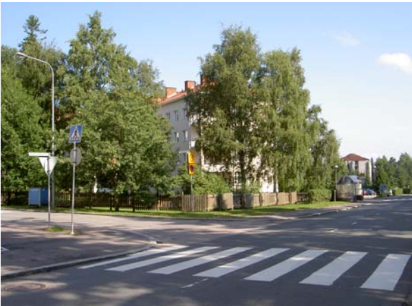
Urpulan pääty puiden takana