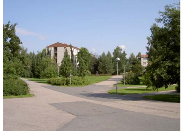
Yleiskuva itäpuolesta huoltotieltä katsottuna. Keskellä Lehtelä.

Itäpuolen kasvillisuudessa korostuu monipuolisuus ja runsaus, mikä on rakennusajankohta huomioon ottaen luonnollista. Puustoa ja pensaita on joka puolella rakennuksia, paikoin tiivistikin. Molempien rakennusten seinustalla kasvavat korkeat pylväshaavat ovat voimakkaita elementtejä maisemassa. Näkymiä järvelle ei kulkuväyliltä tai oleskelualueilta juuri ole. Rannan lahdenpoukaman yli johtavan betonisen kaarisillan itäpuoli on luonnonvaraisena hoidettua rantaa uimakoppeineen.