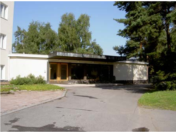
Juhlatalo pihan puolelta.