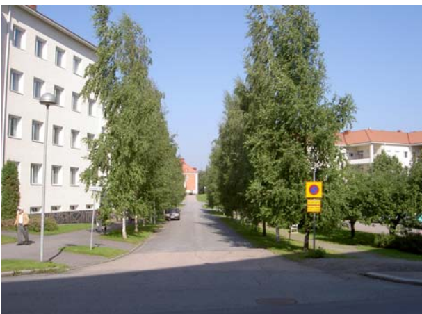
Puukujan korostama akseli hallintorakennukselle.

Pääsaapumissuunta on lännestä. Rauhaniementie kaartuu itäpuolella Lapin pientaloalueelle, josta suunnasta tulee vain vähän liikennettä. Hoitorakennuksen (Urpulan) pääty toimii periaatteessa maamerkinä ja alueen esittelijänä, joka ohjaa kulkijan pääkselinä toimivalle puukujalle. Talon pääty peittyy kuitenkin kesäaikaan lehtipuiden taakse ja maamerkin tehtävä jää yllättäen pysäkkikatokselle. Paikoitusalueen takana olevan hoitorakennuksenkin (Havula) pitäisi näkyä kunnolla paikoitusalueen yli. Tietä reunustava orapihlaja-aita on tarkoituksenmukaisiin matalana. Itäosan rakennusten päädyt näkyvät myös kauas tulosuuntaan. Maasto on itäpuolella huomattavasti tietä matalammalla.