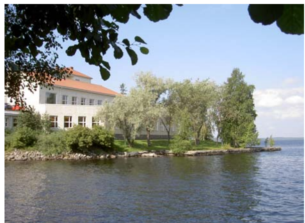
Ravintokeskus ja laivalaituri idästä.

Ravintokeskus ja lämpökeskus. Jaakko Ilveskoski 1954. Tilat sijoittuvat pihatason alapuolelle kehän koillisreunalle. Osittain maan ja katutason alla sijaitseva lämpökeskus on tasakattoinen ja sen hallitsevin piirre on punatiilipiippu. Useaan kertaan laajennettu,