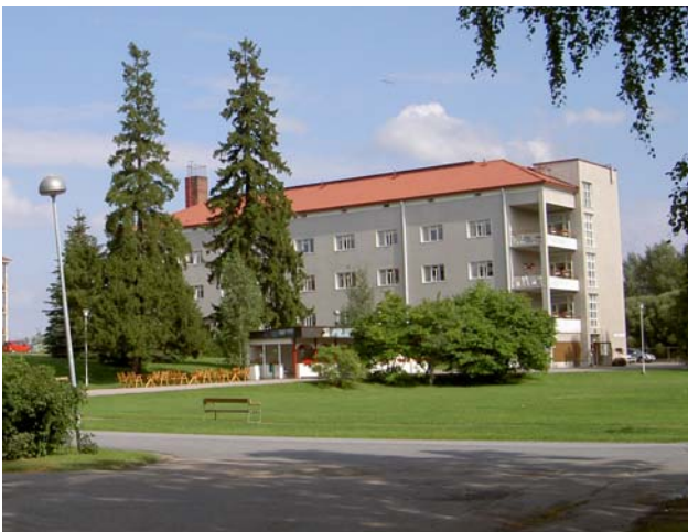
Sairaala pihan puolelta.