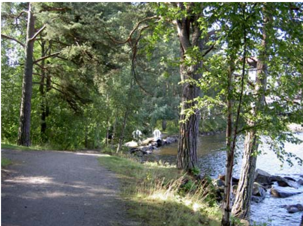
Itäpuolen rantavyöhyke on alueen ainoa luonnonmukaisena hoidettu alue vanhoine kaarisiltoineen. Näköyhteyttä muille pihalueille ei ole.

Itäpuolen kasvillisuudessa korostuu monipuolisuus ja runsaus, mikä on rakennusajankohta huomioon ottaen luonnollista. Puustoa ja pensaita on joka puolella rakennuksia, paikoin tiivistikin. Molempien rakennusten seinustalla kasvavat korkeat pylväshaavat ovat voimakkaita elementtejä maisemassa. Näkymiä järvelle ei kulkuväyliltä tai oleskelualueilta juuri ole. Rannan lahdenpoukaman yli johtavan betonisen kaarisillan itäpuoli on luonnonvaraisena hoidettua rantaa uimakoppeineen.