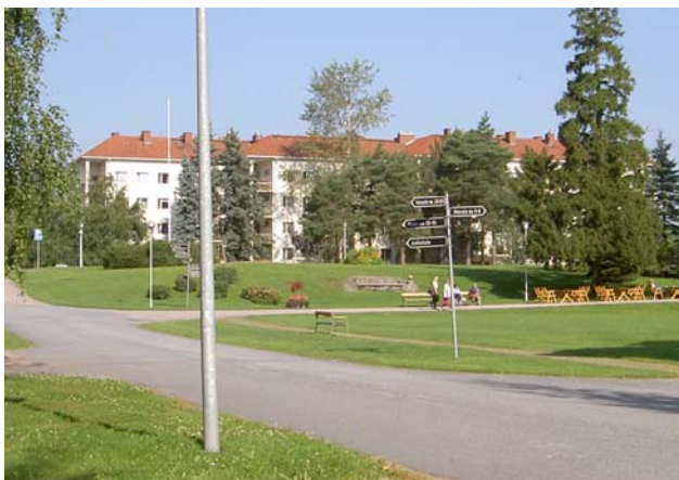
Jukola pihan puolelta.

Ominaispiirteisiin kuuluvat tiilinen satulakatto, roiskerapatut julkisivut ja rapattu sokkeli, pieni erkkeri eteläsivulla ja parvekkeissa teräsputkikaiteet. Porrashuoneen pystyikkunassa ja kulmaikkunoissa on punatiilikoristeet. Ikkunajako on tasainen ja puitejako epäsymmetrinen. Länsipäätyyn on lisätty portaat 1970-luvulla. Samalla vuosikymmenellä kaakkoiskulmaan lisätty puinen katos sopii huonosti rakennuksen kylkeen.