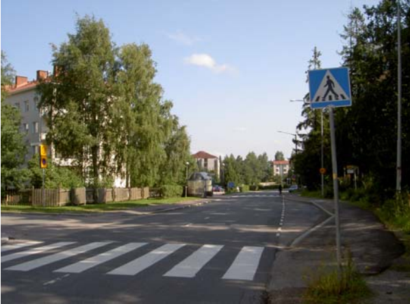
Saapuminen alueelle. Puut peittävät talon päädyn vasemmalla.

länsiosan rakennuskanta. Alueen lounaispuolelle rakennetut uudet kerrostalot liittävätkin Koukkuniemen kaupunkirakenteeseen ja rajalla ollut metsikkö on nykyisin kapea vyöhyke. Itse alueelle johtaa kaksi liittymää, joista ensimmäinen on suureen korttelipihaan johtava vanha puukuja ja toinen 1950-luvulla rakennettu huoltotie, josta päästään myös kahteen uusimpaan hoitorakennukseen.