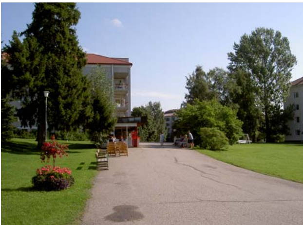
Kioski ja pihan oleskelupaikkoja lännestä.

Muoto on ylöspäin levenevä sekä peiterimalaudoitetuissa seinissä että kuparisessa ilmanvaihtoputkessa, loiva aumakatto on peltiä, ovesa on kolme pyöreää aukkoa. Ulkonäkö ei ole muuttunut alkuperäisestä.