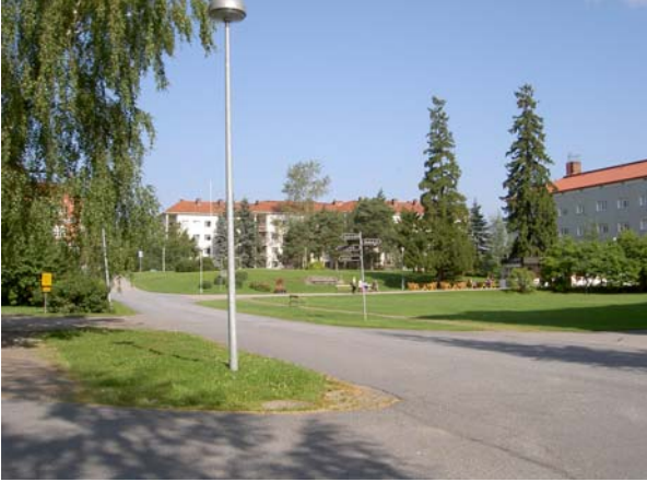
Avaraa korttelipihaa maisemapuineen. Edustalla kulkee pihan pääakseli.