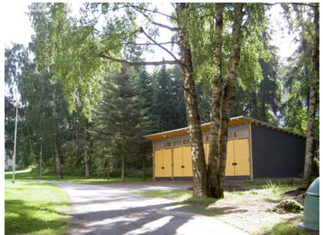
Varasto lännestä järven suunnasta.