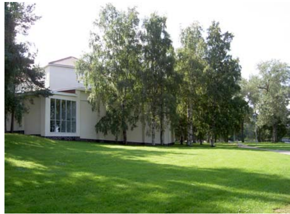
Juhlatalo järven puolelta.