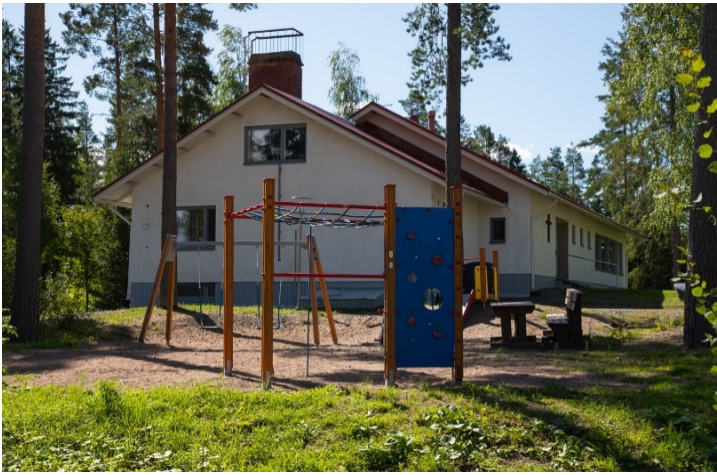
Rakennus nähtynä pohjoisesta.