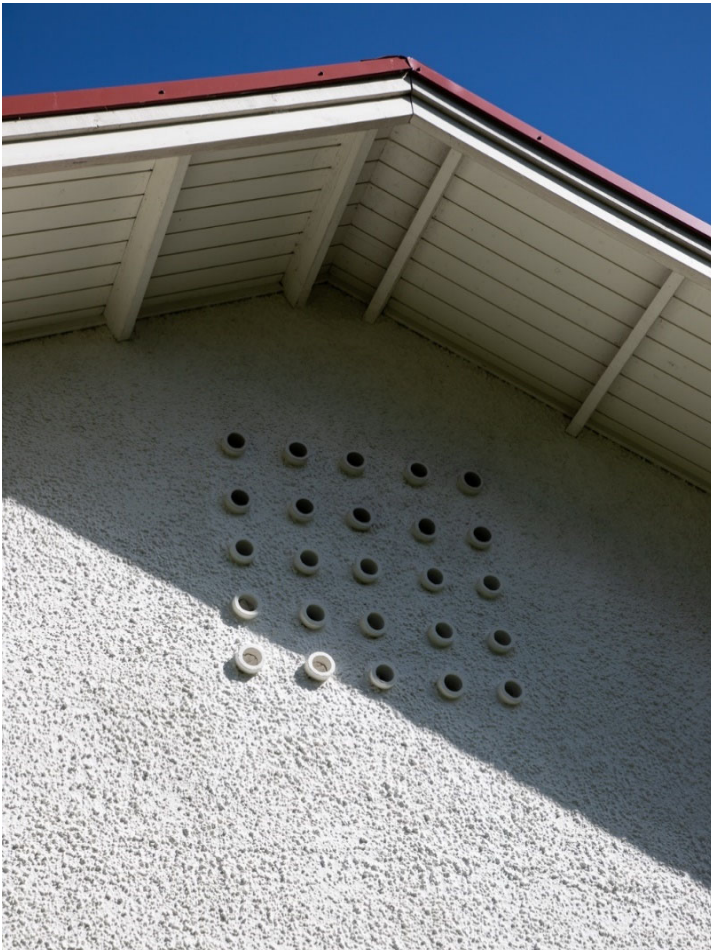
Tuuletusaukot ja räystään rakenne.