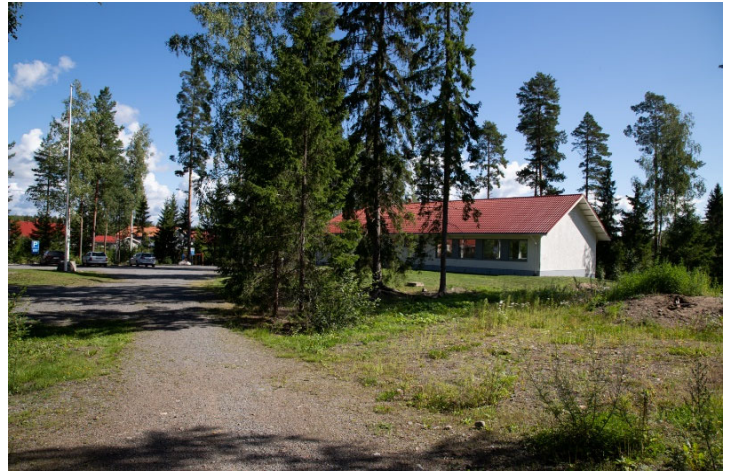
Rakennus nähtynä lounaasta.