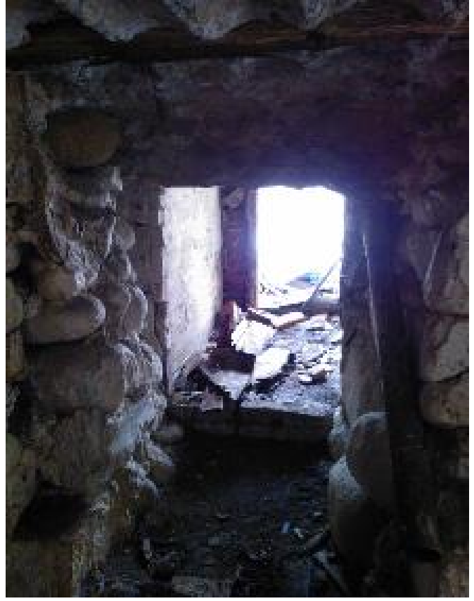
Kuva 6. Linnoituslaitteen seinä- ja kattorakennetta sekä kellarin eteinen taustalla. Kuva: Vadim Adel, KY 289: 4.