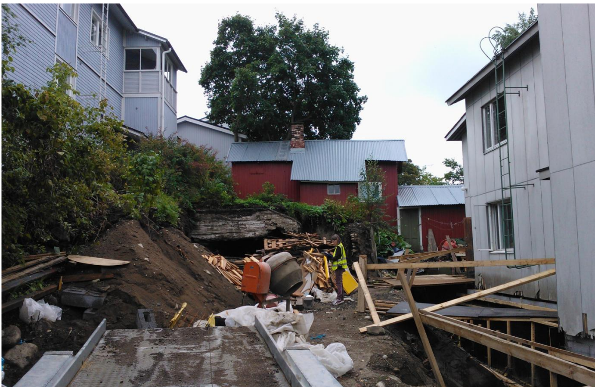
Kuva 9. Yleiskuva Mäkikatu 35:stä vuonna 2013 tehdyn arkeologisen tarkastuksen aikaan, jolloin rakenne on ollut hieman enemmän esillä.