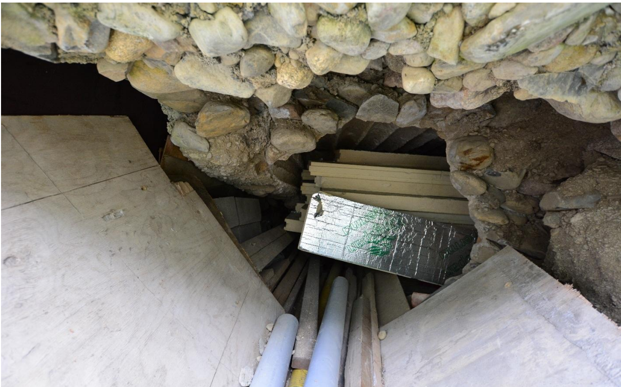
Kuva 3. Puolustusvarustuksen sisätilaa kulkuaukolta lännestä nähtynä. Sisätilaa on käytetty varastona. Kuva: Ulla Moilanen, KY 294:4.