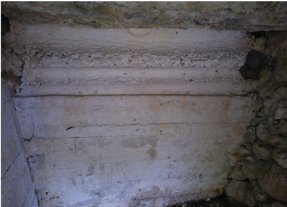
Kuva 7. Linnoituslaitteen seinä- ja kattorakennetta. Kuva: Vadim Adel, KY 289: 6.