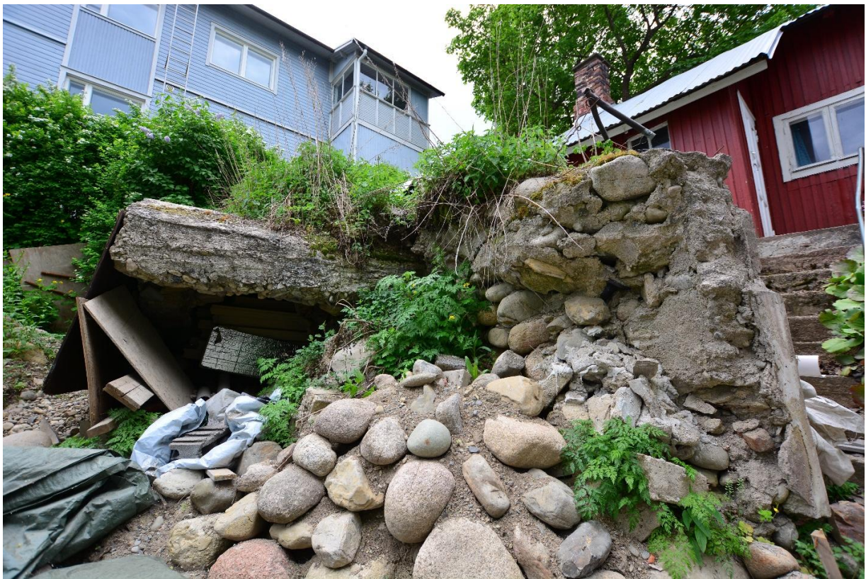
Kuva 1. Puolustusvarustuksen kulkuaukko kuvassa vasemmalla, lännestä nähtynä. Oikealla näkyvän muurin taakse jää maakellari. Muurin eteen on kasattu irtokiviä ja hiekkaa pengerrykseksi. Kuva: Ulla Moilanen, KYY 294:2.

Kenttätöissä Mäkikatu 35:n pihalla oleva betonirakenne mitattiin ja sen tarkat sijaintitiedot merkittiin ylös. Rakenne dokumentoitiin piirtämällä ja valokuvaamalla. Rakenteen käyttäminen varastona kuitenkin haittasi dokumentointia merkittävästi, sillä se oli täytetty kattoon saakka mm. puutavaralla ja erilaisilla putkilla (kuvat 1-9). Myös rakenteen ulkopuolelle oli nostettu levyjä yms. Maakellari oli niin täynnä tavaraa, että sen sisäosia ei voitu dokumentoida. Koko rakenteen tarkka sijainti voitiin kuitenkin merkitä tarkasti kartalle ja muinaisjäännösrekisteriin merkitty muinaisjäännösrajaus voitiin päivittää vastaamaan rakenteen todellista sijaintia. Rakenteita on myös piirretty liitekarttaan 1.