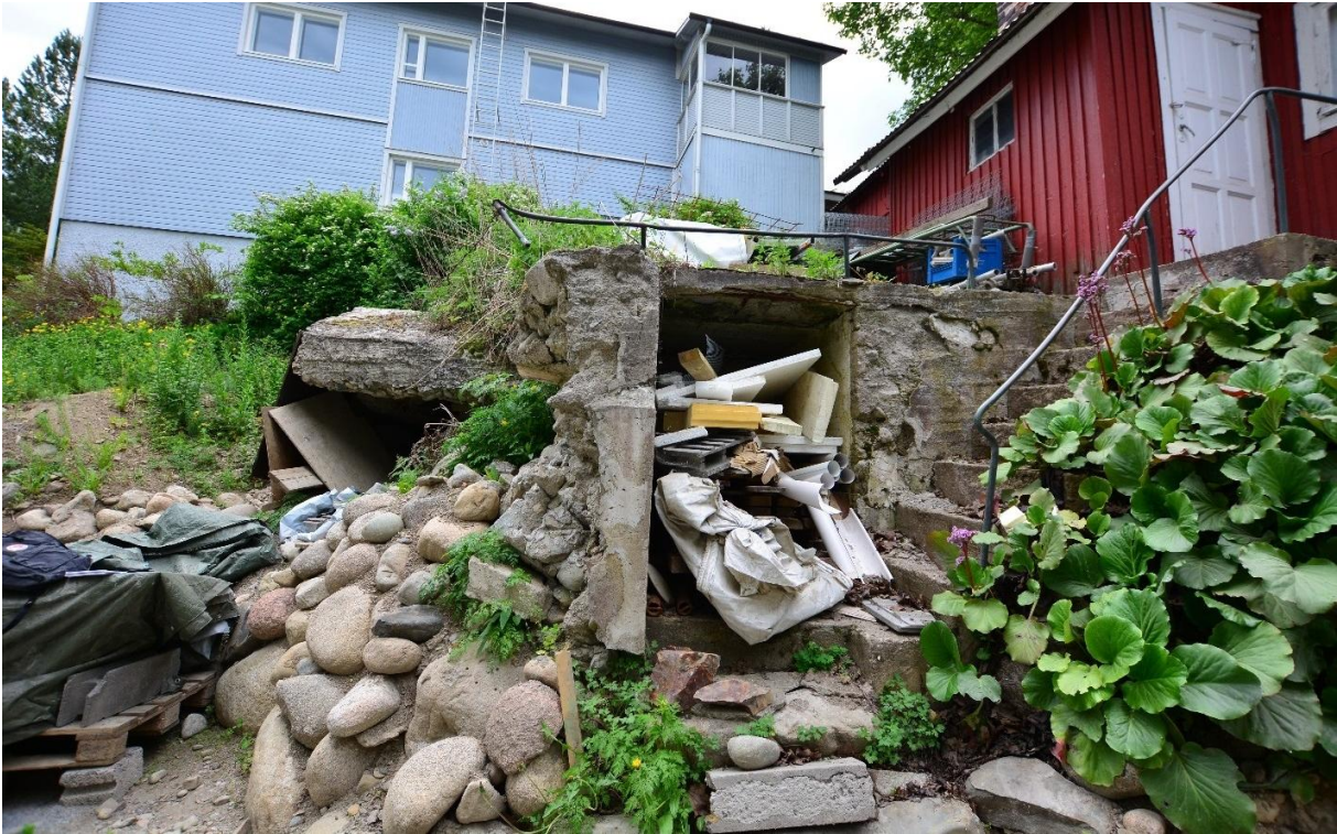
Kuva 2. Puolustusvarustuksen kulkuaukko kuvassa vasemmalla lännestä nähtynä, oikealla maakellarin sisäänkäynti. Kuva: Ulla Moilanen, KY 294:3.