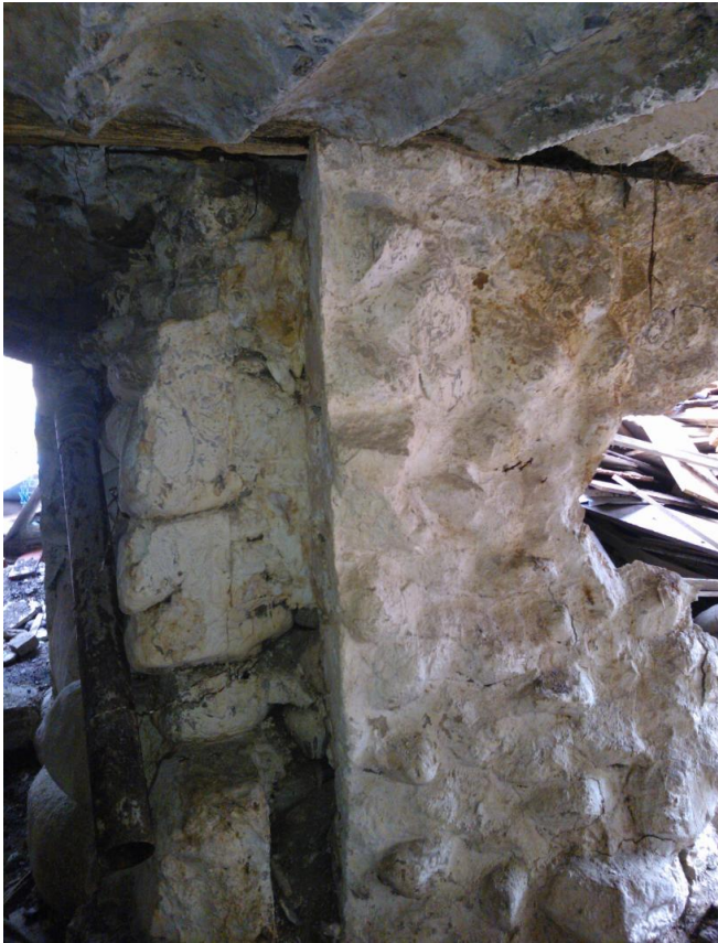
Kuva 5: Linnoituslaitteen seinä- ja kattorakennetta. Vasemmalla kellarin kulkuaukko, oikealla nykyinen kulkuaukko puolustusvarustukseen. Kuva: Vadim Adel, KY 289: 3.