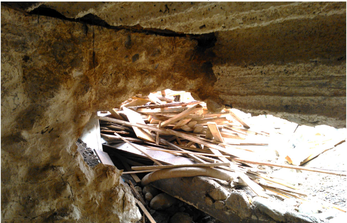
Kuva 4. Puolustusvarustuksen seinä ja kattorakenteita. Kuva: Vadim Adel, KY 289: 2.