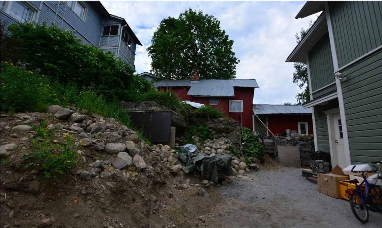
Kuva 8. Yleiskuva Mäkikatu 35:n pihapiiristä ja rakenteista pohjoisesta 2018. Puolustusvarustuksen edustalle on nostettu iso levy. Pihapiiriin on kasattu myös runsaasti kiviä ja hiekkaa. Kuva: Ulla Moilanen, KY 294:16.