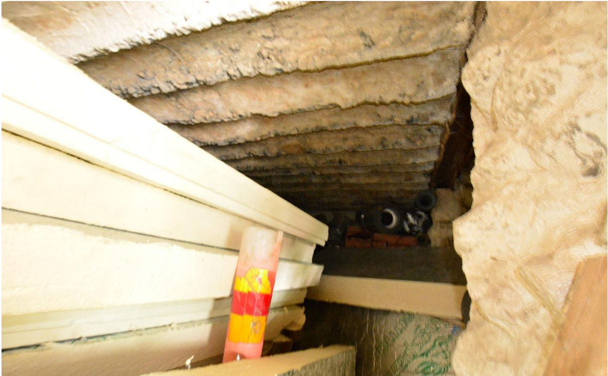
Kuva 4. Puolustusvarustuksen sisätiloja oli erittäin hankala kuvata rakenteeseen varastoidun runsaan tavaramäärän vuoksi. Kuvassa kattorakennetta. KY 294:7.