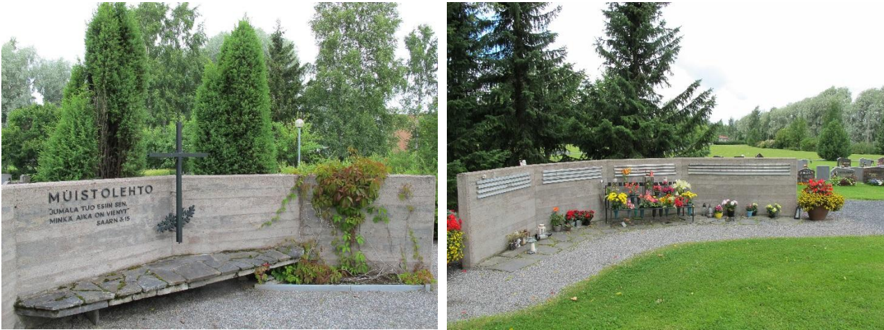
Viialan hautausmaan Muistolehdon on suunnitellut Ero Kökkö 1989.