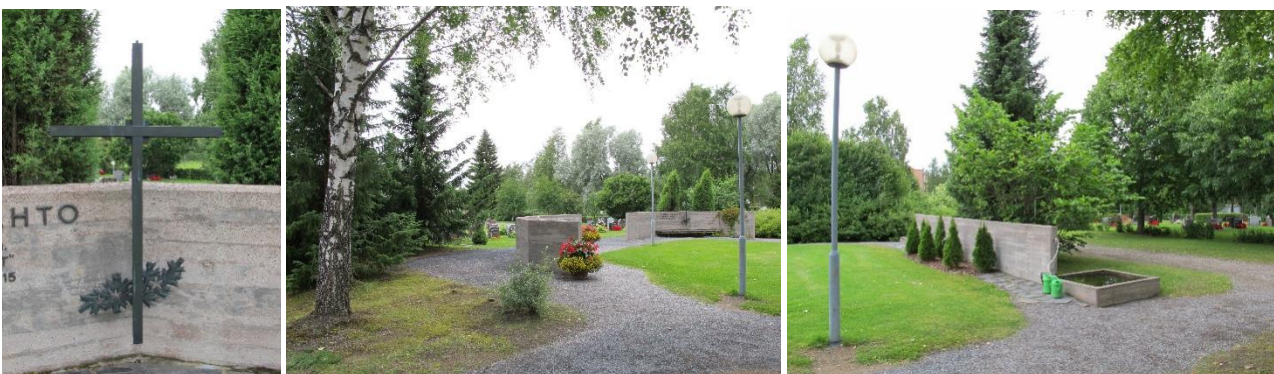
Muistolehdon risti ja sen edustan liuskekivipenkki lisättiin 1995. Muistolehto on betoniseinämien kehystämä nurmialue hautausmaan pohjoissivulla.

Uurnalehto koostuu kolmesta betoniseinämästä, joiden keskellä on pieni nurmialue. Keskikäytävän puoleisessa seinämässä on paikat vainajien nimilaatoille. Luoteiskulmassa olevassa seinämässä on risti ja teksti "Jumala tuo esiin sen, minkä aika on vienyt" Saarn.3:15. Seinämän edustalla on paikka muistosepeleille. Itäpuolen seinämä rajaa aluetta ja sen päädyssä on kastelualtaat.