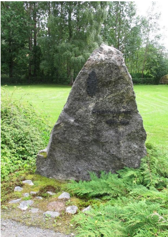
Muistomerkki on panssariestekivi Enon Harpatinvaarasta. Etupuolella on Sotaveteraanien tunnus, tammenlehti ja teksti "Sotaveteraanit 1939-1945".

http://www.mikkeli.fi/tietoa-mikkelista/veteraanipaiva-2742014/tammenlehtatunnus (luettu 11.8.2017)