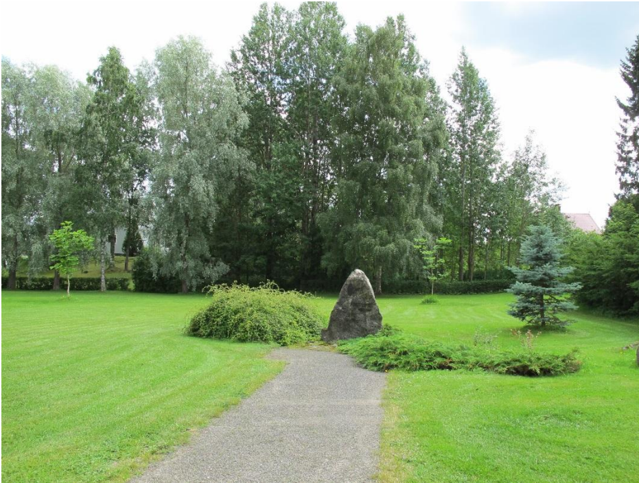
Viialan Lions Clubin lahjoittama Sotaveteraanien muistokivi Viialan kirkkopuistossa. Muistomerkki paljastettiin 1998.