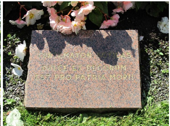
Vasemmalla Sankarihautausmaan muistomerkkejä pääkäytävän eteläpuolella. Oikealla Tuntemattoman sotilaan muistomerkki.