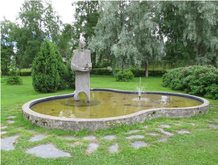
"Elävän veden lähde", taiteilija Sirkka Kiviranta 1987.