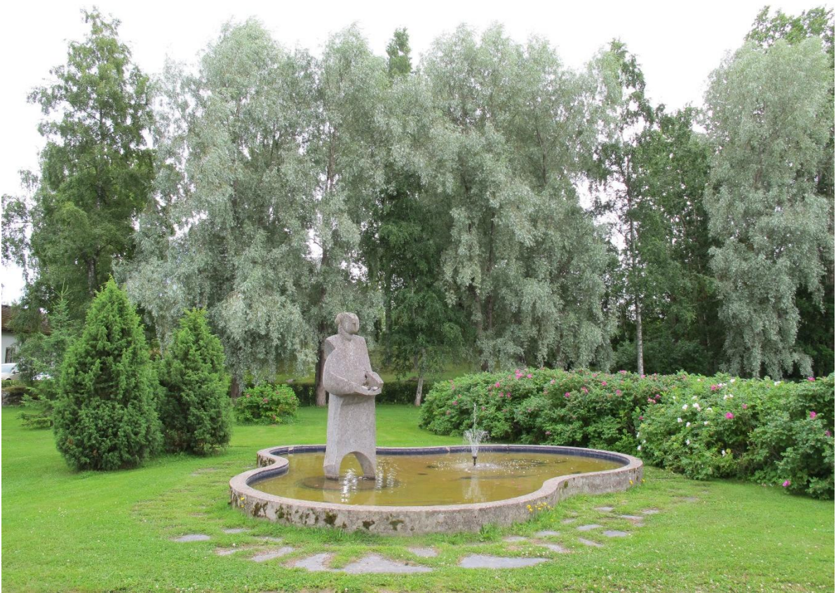
Viialan kirkkopuistossa sijaitseva Elävän veden lähde on kaunis suihkulähdeteos.