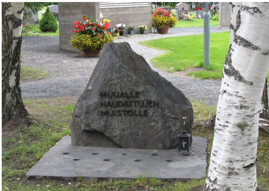
Muualle haudattujen muistomerkki 2012