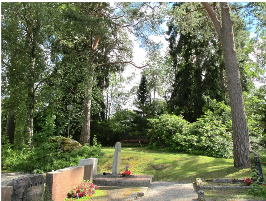
Karjalaan jääneiden muistomerkki sijaitsee pienellä kummulla hautausmaan eteläpuolella.