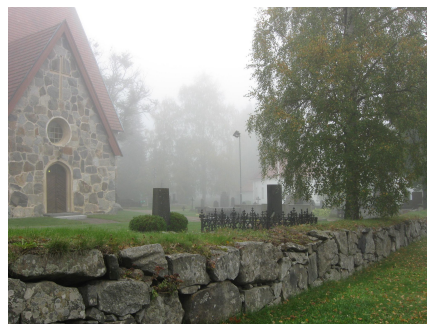
Kirkon etelän puoleista kiviaitaa.