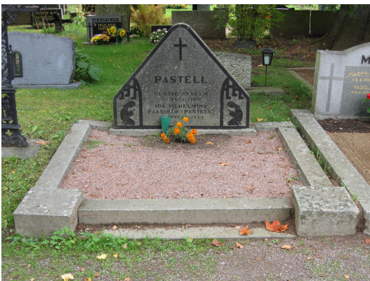
Pastellien muistomerkki 1940-luvulla.