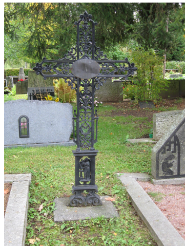
Sääksmäen hautausmaalla tyypillisiä umpirunkoisia valurautaristejä sekä läpikuviollinen valurautaristi. Kuvat vasemmalta. 0609449B_Pastell k. 1846/1865, K_0615_Leppänen k. 1898 ja 060113_Forsman k. 1903.