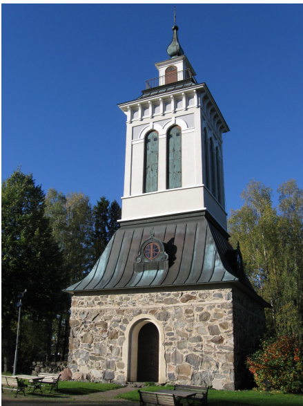
Sääksmäen kirkon kellotapulin alaosa on vuodelta 1766 ja yläosa vuodelta 1933.

Vuoden 1929 tulipalon jälkeen kellotapuliin tehtiin uusi, betonirakenteinen yläosa, joka noudatti 1840-luvun mallia. Uudisosan suunnitteli arkkitehti Kauno. S. Kallio, joka vastasi myös kirkon korjausrakennustöistä ja se valmistui 1933. (Kuvaliite 1/1)