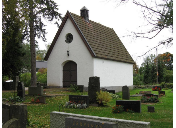
Kappeli itäpäädyssä kuvattuna.

Kappeli eli vainajien säilytysluona valmistui hautausmaahan länsilaidalle kirkon korjausrakentamisen jälkeen vuonna 1938. Paikalla sijaitsi jo aiemmin rakennus vainajien säilytystä ja ruumiinavauksia varten. Nykyisen kappelin on suunnitellut kirkon korjaussuunnitelmista vastannut Kauno S. Kallio. Kappeli on hyvin kaunis ja siro rakennus. Se on rapattu valkoiseksi, alaosa on harmaa ja länsipäätyä koristaa tyylitelty tasavartinen, hopeanharmaa risti. Ovet ovat jyrkät ja niissä on taotut helat. Ikkunat ovat goottilaishenkiset, kapeat ja korkeat. Itäpäädyssä on oven yläpuolella pyöreä ikkuna. Kappelin pääovi sijaitsee hautausmaan puolella rakennuksen itäpäädyssä. Muut kulkureitit ovat länsipuolella (Kirkkovainiontie) ja pohjoispuolella (hautausmaa). (Kuvaliite 1/1)