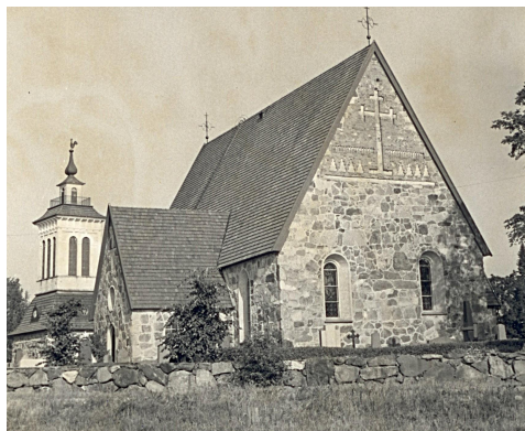
Kirkko vuoden 1929 palon jälkeen kunnostettuna. Asehuone on madaltunut.