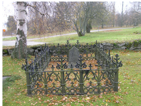
Denisoffien valurauta-aidalla ympäröity hauta.

Vuonna 1871 Sääksmäen kirkkomaalla mainitaan olleen hautakiviä ja rautaristejä sekä säätyläisten että rahvaankin hautasijoilla. 1800-luvun lopulla sukuhaudan ostajan tuli aidata hauta-alue rauta-aidalla, kivi-pylväillä tai ”muulla sievällä tavalla”. Sääksmäen hautausmaalla on säilynyt ainoastaan yksi erillinen hautausosa osastossa 7 valurauta-aidalla varustettu Denisoffien vuonna 1895 kuolleiden poikien haudalla.