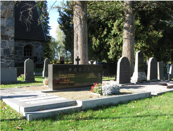
Osaston 6 muistomerkkejä. Vanhojen pystykiven keskellä näyttävä moderni hautausalue.

Osastolla 6 on useita kulttuurihistoriallisesti, henkilöhistoriallisesti sekä taide- ja tyylihistoriallisesti merkittäviä hautoja. Alueelle on tyypillistä näyttävä, vanha puusto sekä erittäin näkyvä sijainti kirkon itäpäädyssä.