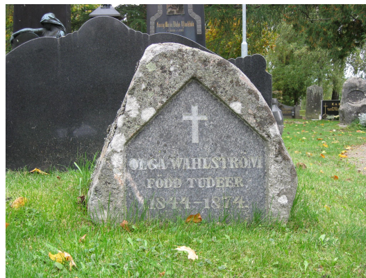
Olga Wahlströmin muistomerkki vuodelta 1874.