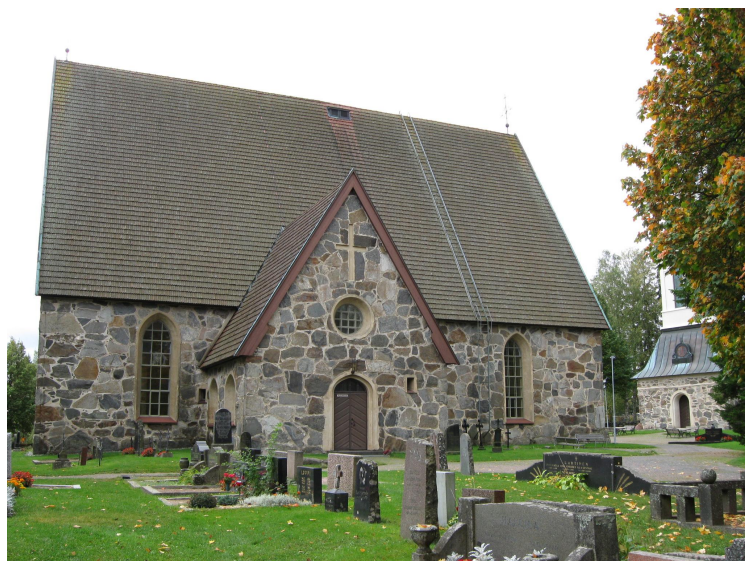
Sääksmäen kirkko pohjoispuolelta, edustalla sakasti.