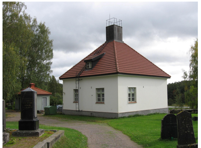
"Kahvimylly" toimii nykyisin kerhotilana. Alun perin se rakennettiin suntion asunnoksi.

Kirkon kaakkoispuolelle valmistui korjausrakentamisen yhteydessä vuosina 1932-33 suntion asunto, jonka yhteydessä on lämpökeskus. Rakennuksen on suunnitellut korjaussuunnitelmista vastannut Kauno S. Kallio. Suntion asuinrakennus on valkoiseksi rapattu, tiilikattoinen pienehkö talo. Rakennukselle antaa ilmettä korkea telttakatto, jonka yllä kohoaa savupiippu. Hauskan ulkonäkönsä takia rakennus on saanut lempinimen "kahvimylly". Rakennus toimii nykyään seurakunnan kerhotilana. Rakennuksen vieressä on pieni vaaleanvihreäksi maalattu rakennus, jossa sijaitsee lämpökeskus ja yleisö-WC:t. (Kuvaliite 1/2)