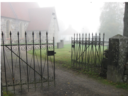
Hautausmaan lounainen pääportti.

Hautausmaan pääportti sijaitsee sen lounaiskulmassa. Portti on koristeellinen rautaportti. Ohitse kulkee Kirkkovainiontie. Toinen Kirkkovainiontien varressa oleva sisäänkäynti on kappelin vieressä. Hautausmaan kolmas sisäänkäynti sijaitsee hautausmaa-alueen koilliskulmauksessa, lähellä Kelhin seurantaloa Kelhinpolun varrella. (Kuvaliite ½)