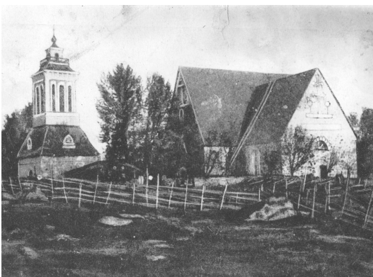
Kirkko kuvattuna eteläpuolelta. Edustalla asehuone, joka ennen kirkon paloa ulottui katon harjaan asti.