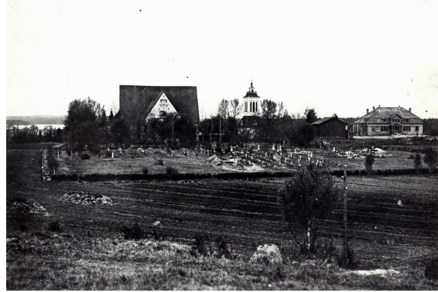
Hautausmaata laajennettiin pohjoiseen vuonna 1907.

1933 tehtiin taas uusi laajennus. Laajennuksen koko oli n. 1,8 hehtaaria ja se lohkaistiin pappilan maasta sekä ostettiin Sääksmäen kunnalta. Nyt hautausmaan koko pinta-ala oli 4, 87 hehtaaria. (Nykyiset osastot 8-11). Viimeisin laajennus hautausmaalla on tehty 2000-luvulla hautausmaan koilliskulmalle. (Nykyiset osastot 9,8 ja 13.) (Karttaliite 1)