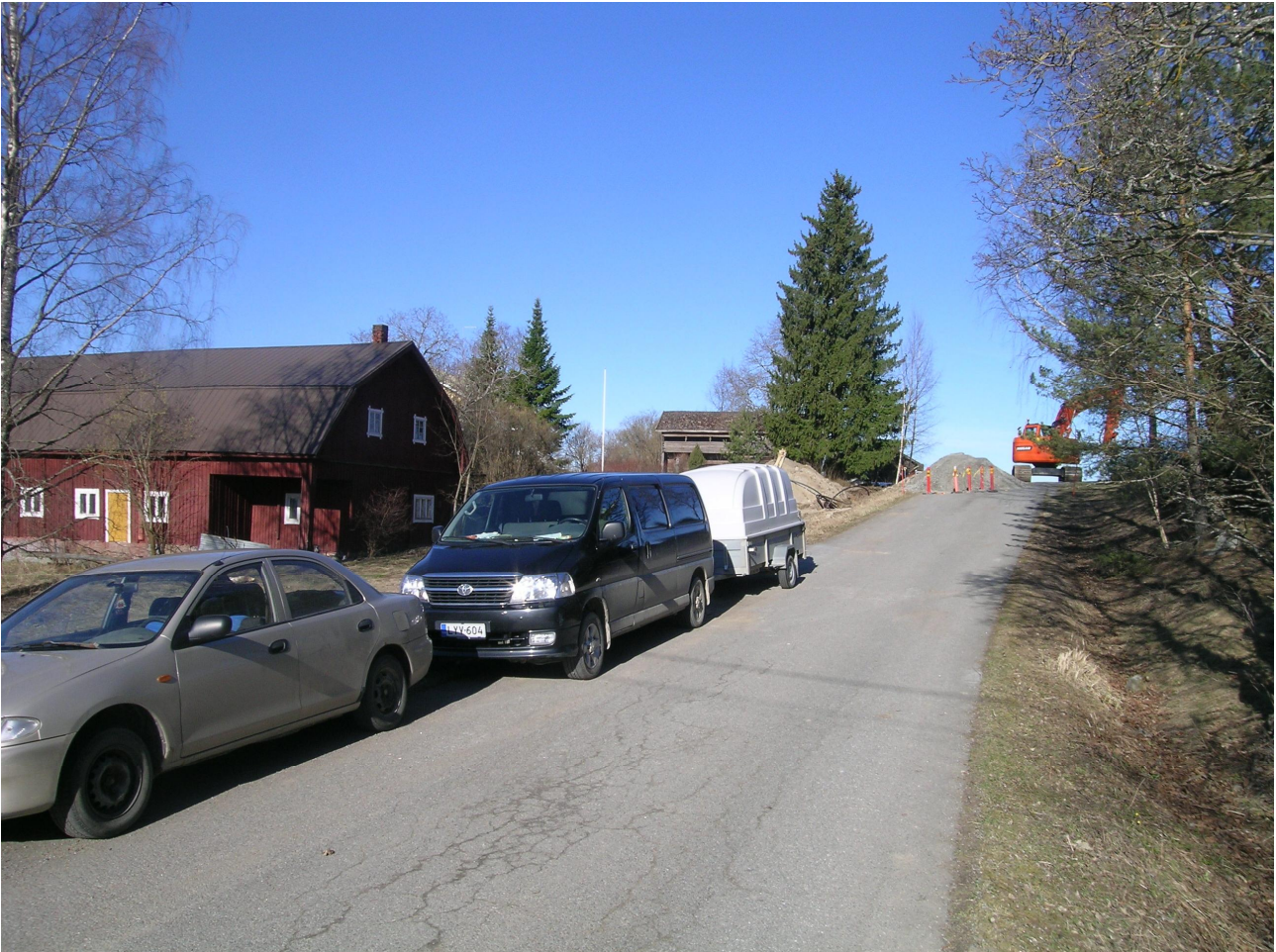
Kuva 1. Järviön kylämäki idästä nähtynä huhtikuussa 2015. Kuvan keskellä Järviöntie. Vasemmalla Hannulan navetta kylämäen itärinteellä. Kuvan keskellä (tien vieressä kasvavan kuusen vasemmalla puolella) näkyy Hannulan luhtiaitta kylämäen laella, historiallisen kylätontin keskellä. KYY 154: 7.