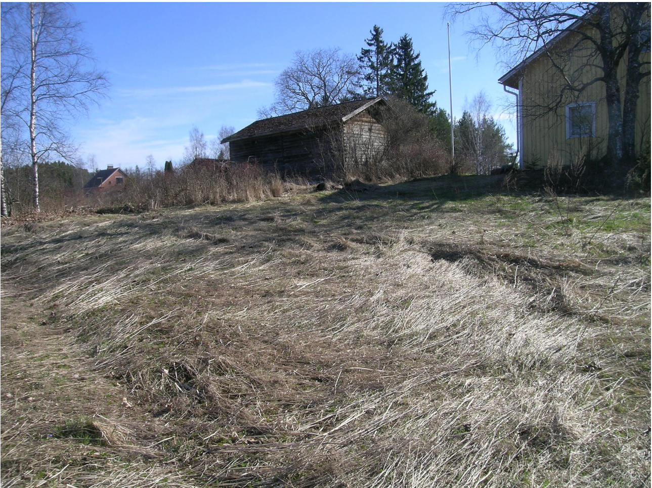
Kuva 5. Kylätontin autioitunutta osaa Hannulan pihapiirin länsipuolella. Kuvassa luhtiaitta (vasemmalla) ja päärakennuksen pääty (oikealla). Kuvattu koilliseen. KYY 154: 10.

Suurin osa kylätontista on autioitunut tai perinteisen rakennuskannan piirissä, joten valvonnan tuloksista huolimatta Järviön kylänpaikka on arkeologisesti lupaava kohde.