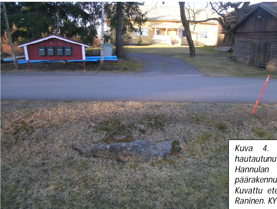
Kuva 4. Osittain tiepenkereeseen hautautunut Paimenkivi. Taustalla Hannulan pihapiiri, mm. keltainen päärakennus. Kuvattu etelälounaaseen. Kuva. Sami Raninen. KYY 154: 5.

Noin koordinaattipisteessä (ETRS-TM35FIN) p 6787363 i 323232 erottuu iso laakea kivi, joka pilkottaa Järviöntien pohjoisen tiepenkereen seasta. Kiveä on näkyvillä runsaan metrin pituudelta. Valvonnan aikana paikalla pistäytyneen järviöläisen henkilön mukaan kiven nimi on Paimenkivi ja siihen liittyy perimätietoa, jonka mukaan se oli paimenten kokoontumispaikka. Kiven esillä olleessa osassa ei ollut kuppeja eikä muita ihmistekoisia jälkiä. Kiveen ei kajottu vesihuoltolinjan kaivutyössä.