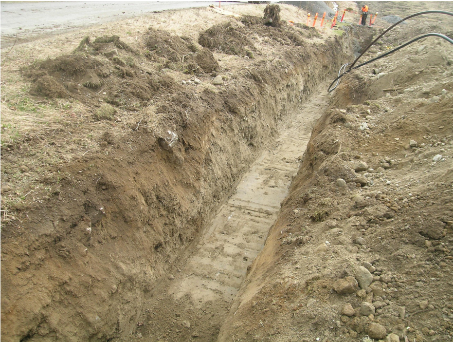
Kuva 2. Järviöntien eteläpuolista kaivantoa. Kuvattu itään. KYJ 154: 4.

1900-luvun jälkipuolella tehtyjä. Ne liittyivät Järviöntien rakenteisiin ja tien pohjoispuolella tehtyihin koneellisiin maansiirtotöihin, jotka voivat olla yhteydessä tiepenkereen rakentamiseen.