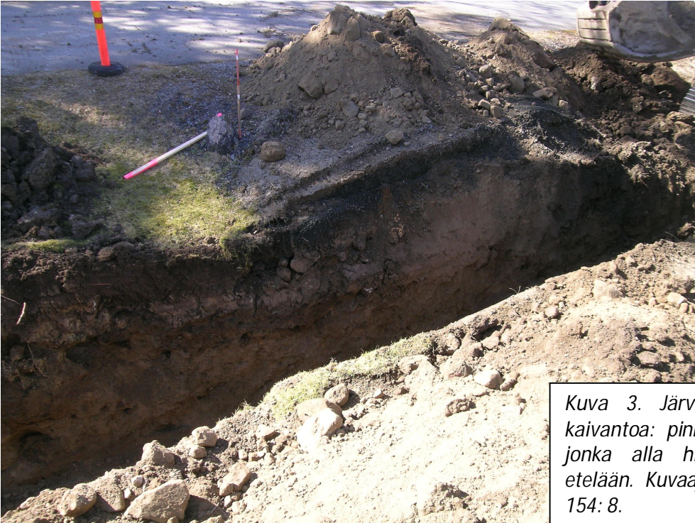
Kuva 3. Järviöntien pohjoispuolista kaivantoa: pinnalla paksu savikerros, jonka alla hiekkamoreeni. Kuvattu etelään. KYY 154: 8.