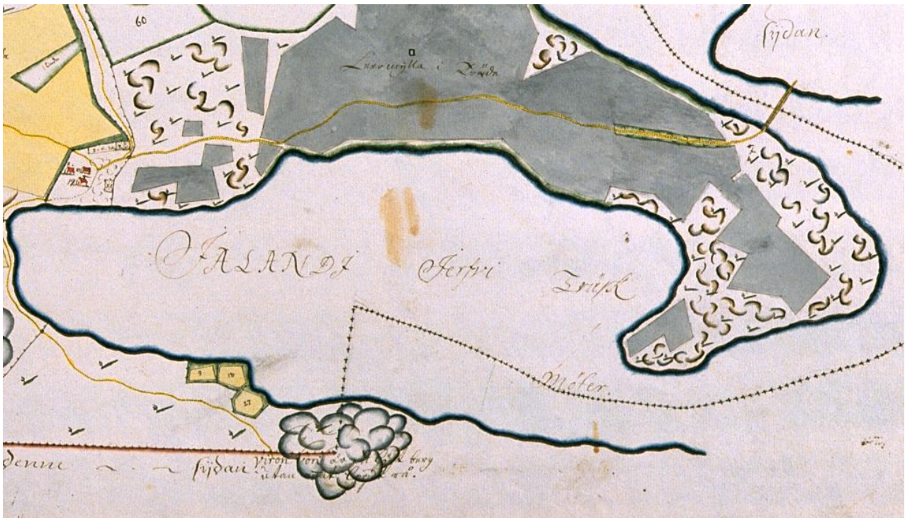
Karttaote 1: ote maakirjakartasta vuodelta 1700. Piirtänyt Niklas Avander. Järviö, Kylmäkoski, Hämeen lääni; Kansallisarkisto, arkistoyksikkö KA h1b: 4/1-2. Ei mittakaavassa.

Nykyinen Järviöntie vastaa osittain 1700-luvun kartoissa kuvatun kylätien linjausta, mutta on selvästi suurempi. Keppilän alueella sijaitseva pihatiestö näyttää säilyttäneen katkelmia historiallisista tielinjoista.